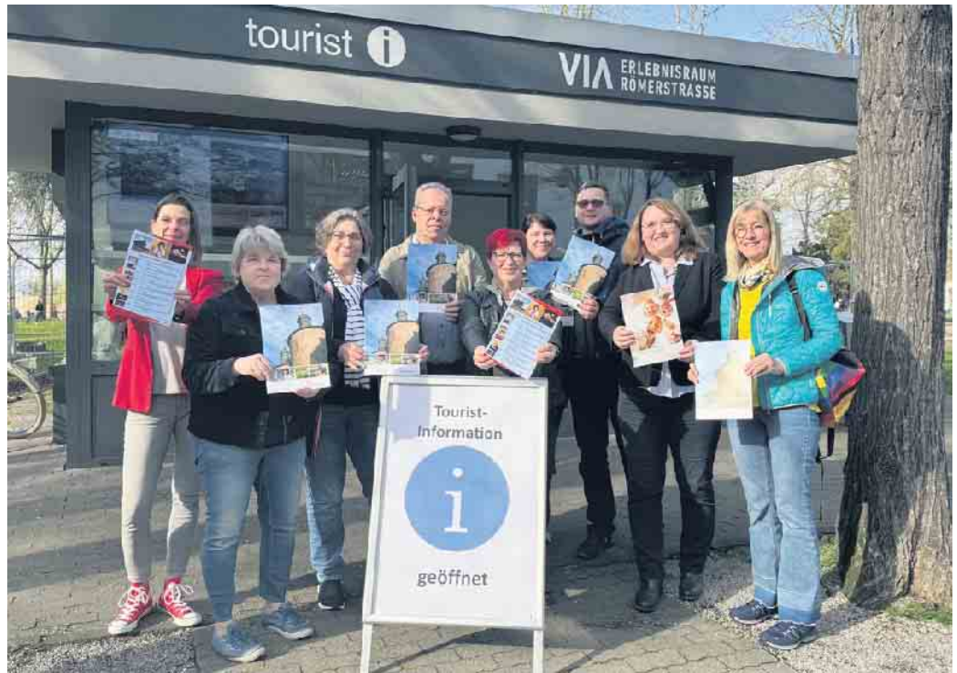
In der Tourist Information gibt es nicht nur Broschüren und Informationen, sondern auch viele Souvenirs. Das Team freut sich auf zahlreiche Gäste.

Wer als Tourist nach Jülich kommt, hat in der modernen Forschungsstadt und historischen Festungsstadt allerhand zu entdecken. Manche(r) lässt sich