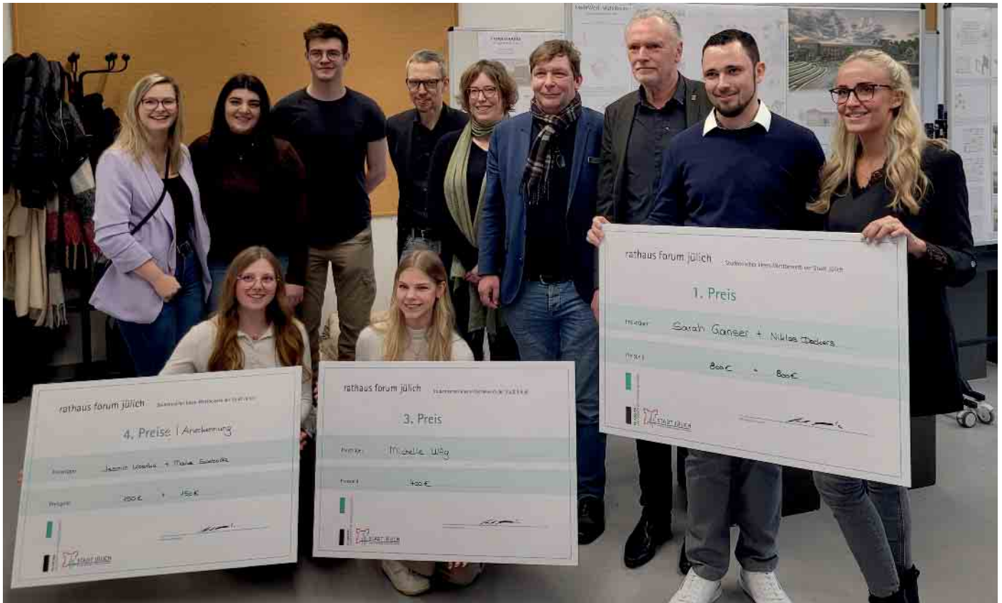
Preisverleihung des studentischen Ideenwettbewerbs zur Neugestaltung des Jülicher Rathauses.

Studierende der FH Aachen entwickeln Konzepte zur Neugestaltung des Jülicher Rathauses