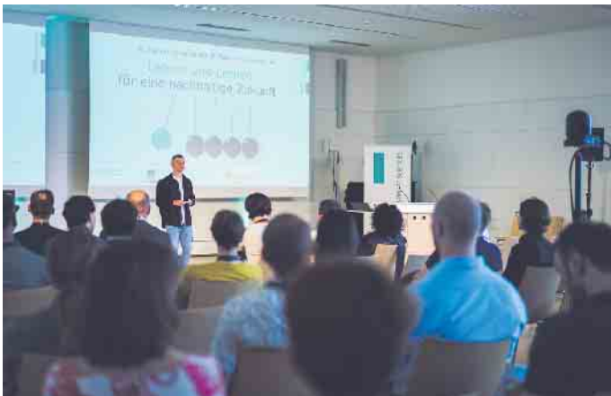
Zum achten Mal fand der Tag der Lehre an der FH Aachen statt.

und Digitalisierung ermögliche. Im Anschluss an die Plenarvorträge hatten die Teilnehmenden die Gelegenheit, die Thematik in Workshops zu diskutieren. Diese beschäftigten sich mit Themen wie Interdisziplinarität in der nachhaltigen Lehre und Mündigkeit oder dem Konzept einer Nachhaltigkeits-Challenge. Den Abschluss des Tags der Lehre bildeten die Vergabe des Lehrpreises sowie der Science-Slam, bei dem fünf Studierende ihr aktuelles Studien- oder Abschlusssthema auf unterhaltsame Weise präsentieren. Die FH Aachen dankt den Sponsoren Sparkasse Aachen und Kabelwerk Eupen, die mit ihrem Beitrag die Organisation des Tags der Lehre unterstützen.