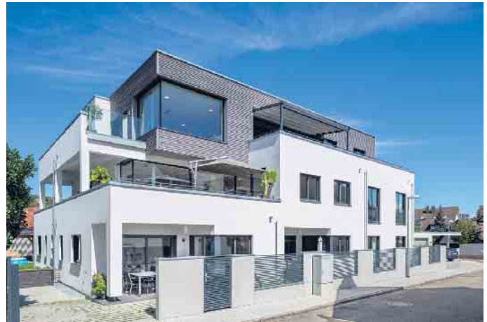
Mehrgenerationenhäuser in Holz-Fertigbauweise sind im Kommen.

In vielen Regionen Deutschlands sind Baugrundstücke aufgrund großer Nachfrage und teils mangelhafter Baulandausweisung schwer zu finden. Hinzu kommt, dass Baugrund ebenso wie Bauen insgesamt in den letzten Jahren teurer geworden ist. Gründe dafür sind etwa steigende baurechtliche und klimapolitische Anforderungen sowie Rohstoff- und Energiepreise oder auch gestörte Lieferketten und mangelnde Fachkräfte. „Dennoch werden seit Jahren immer mehr Fertighäuser gebaut, weil die Hersteller die Rahmenbedingungen gut im Griff haben und ihren Bauherren individuell passende, planungssichere Lösungen anbieten können“, erklärt Tews. Ein Mehrgenerationenhaus sei so eine Lösung für ein zukunftsicheres Eigenheim, dessen Bau- und Grundstückskosten auf mehreren Schultern verteilt werden können. Mitunter braucht es hierfür nicht einmal ein neues Baugrundstück und damit auch keinen ganz neuen Lebensmittelpunkt. Etwa wenn ein stark sanierungsbedürftiger, bereits in Familienbesitz befindlicher Altbau durch ein bedarfsgerechtes Mehrgenerationenhaus in nachhaltiger Holz-Fertigbauweise ersetzt wird. Auch Um- und Anbauten mit Fertigteilen oder ganzen Wohnmodulen aus Holz können je nach Bestandsgebäude Sinn machen, um ein Einfamilienhaus zu erweitern, das für die Großeltern zu groß geworden, aber für