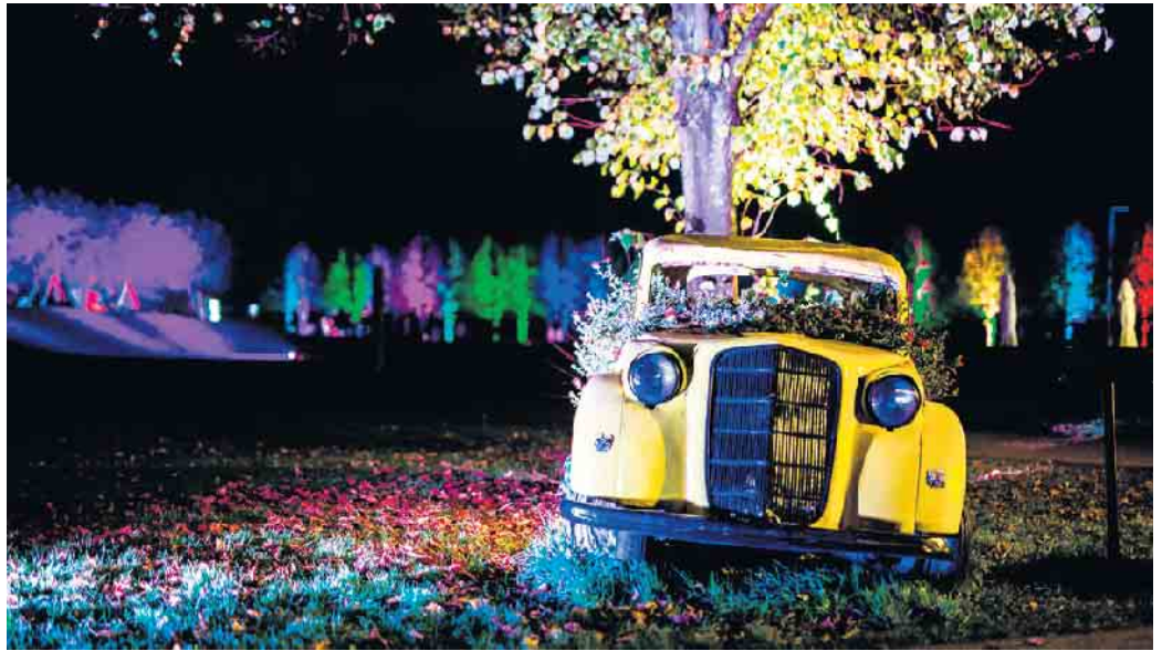
Herbstleuchten im Brückenkopf-Park.

Geboten werden atemberaubende Effekte, die den ganzen Park mit der Festungsanlage zu einem wahren Kunstwerk machen. Lichtobjekte werden an ausgewählten Punkten im Park aufgestellt oder bestehende Objekte illuminiert. Hier kennt die Kreativität keine Grenzen. Herbstlichter schaffen eine atemberaubende Atmosphäre in Stadtgarten, Südbastion, Zoo und auf den Wegen durch Wälder und