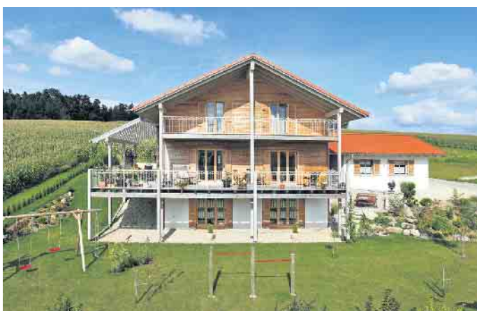
Dank individueller Hausplanung können sich alle Generationen dauerhaft unter einem Dach wohlfühlen.