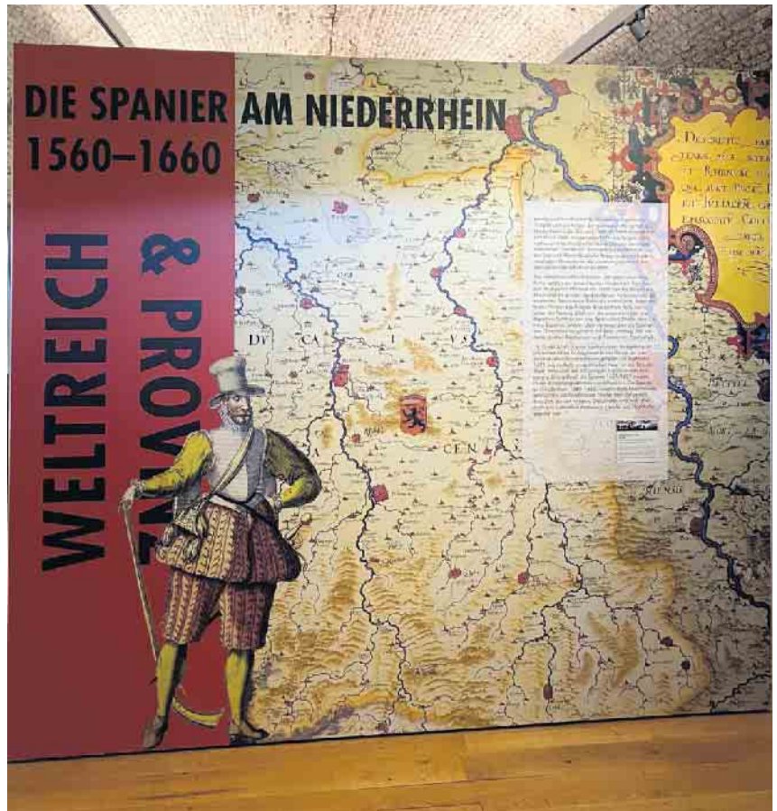
Ausstellung: Weltreich und Provinz.

Die Führung ist frei, der reguläre Eintritt (5 Euro, ermäßigt 4 Euro) ist zu entrichten. Treffpunkt ist um 11 Uhr am Info-Pavillon/Kasse in der Zitadelle. Die Ausstellung wird bis zum 6. August 2023 verlängert.