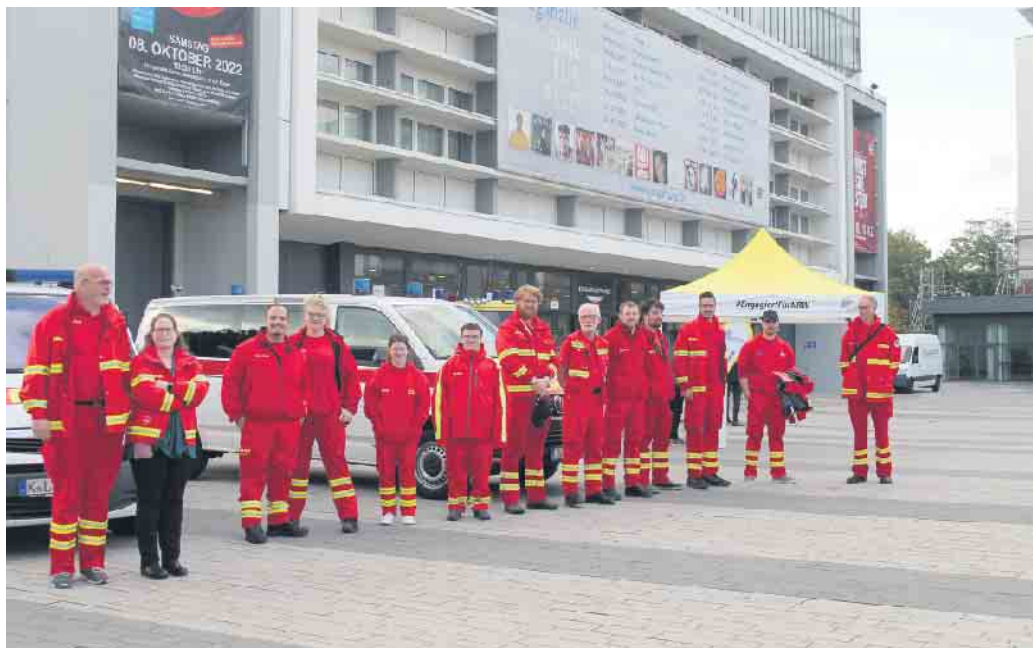
DLRG Katastrophenschützer aus dem Bezirk Kreis Düren mit Begleitern vor der Ehrung in der Grugahalle.