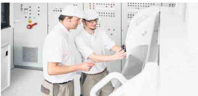
Moderne Mühlen verfügen über einen komplexen Maschinenpark, den es zu beherrschen gilt.

Nach erfolgreicher Gesellenprüfung sind die Chancen auf einen sicheren Arbeitsplatz und gute Bezahlung hoch. Zudem stehen Müllern und Müllerrinnen zahlreiche Karriereoptionen offen. So kann man die Meisterschule besuchen und einen Abschluss als Müllermeister machen oder an der Technikerschule in Braunschweig innerhalb von zwei Jahren die Titel „Meister“ und „staatlich geprüfter Müllereitechniker“ erwerben. Als letzter Schritt lässt sich ein betriebswirtschaftliches Studium draufpacken, das fit macht für alles rund um Finanzen, Marketing und Personalwesen. Zudem ermöglicht der Meisterbrief das (Fach-)Hochschulstudium in vielen technischen und ernährungswirtschaftlichen Fächern. (djd)