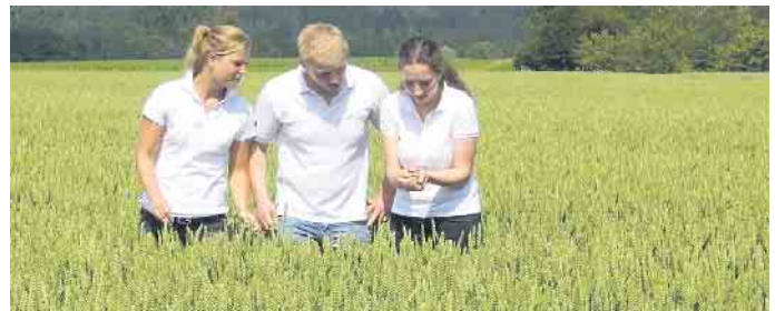
Genauere Kenntnisse über das Naturprodukt Getreide gehören zu den Grundlagen des Müllerberufs.