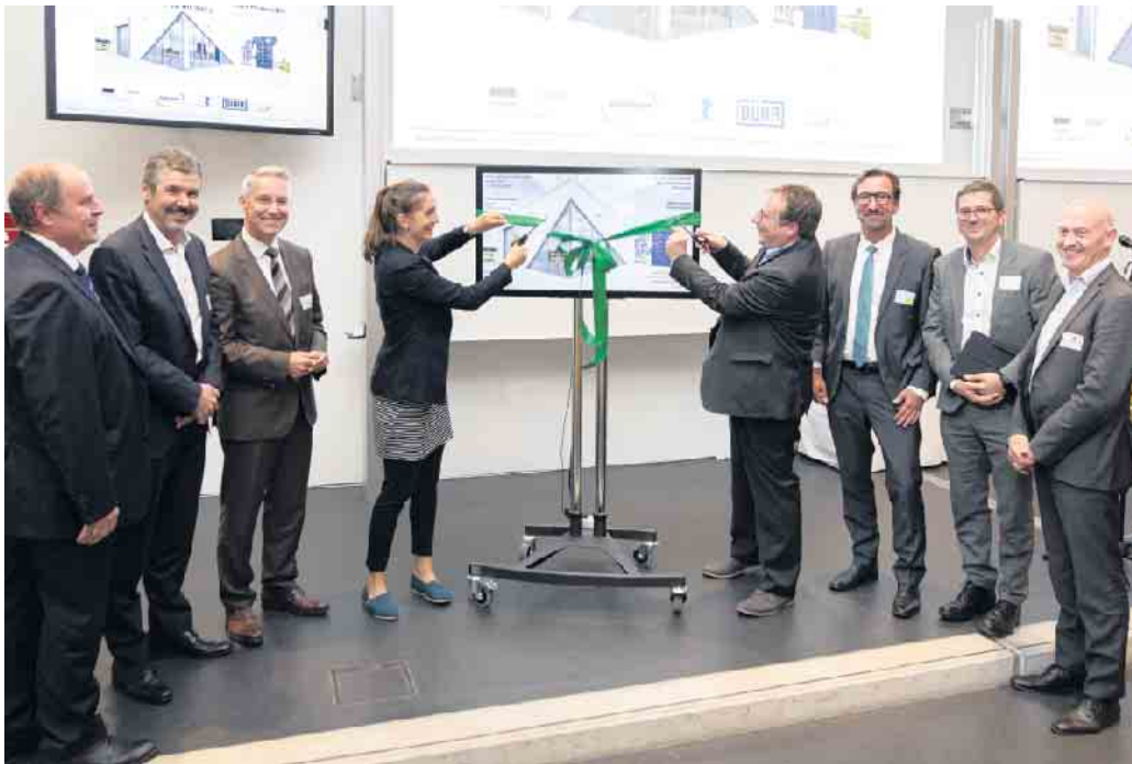
Eröffnung der multiTESS-Anlage in Jülich.

Die sichere und CO 2 -freie Wärme- und Stromversorgung aus regionalen Quellen sowie die sektorübergreifende Vernetzung sind zentrale Themen der Energiewende. Mit multiTESS entwickelt das Solar-Institut Jülich der FH Aachen (SIJ) gemeinsam mit den Industriepartnern Kraftanlagen Energies & Services, Otto Junker und Dürr Systems einen sogenannten Power-to-Heat-Speicher. Dieser erlaubt es, Energie in Form von Hochtemperaturwärme zu speichern („beladen“) und diese Wärme bei Bedarf wieder zu verstromen („entladen“). Zusätzlich können auch externe Wärmequellen - etwa die Abwärme aus industriellen Prozessen - einbezogen werden; ebenso ist denkbar, die gespeicherte Wärme nicht nur zur Stromproduktion, sondern auch zur Einspeisung in öffentliche Fernwärmenetze oder zur Bereitstellung von Prozesswärme für die (Schwer-)Industrie zu nutzen. Jetzt ist die Versuchsanlage in Jülich eröffnet worden.