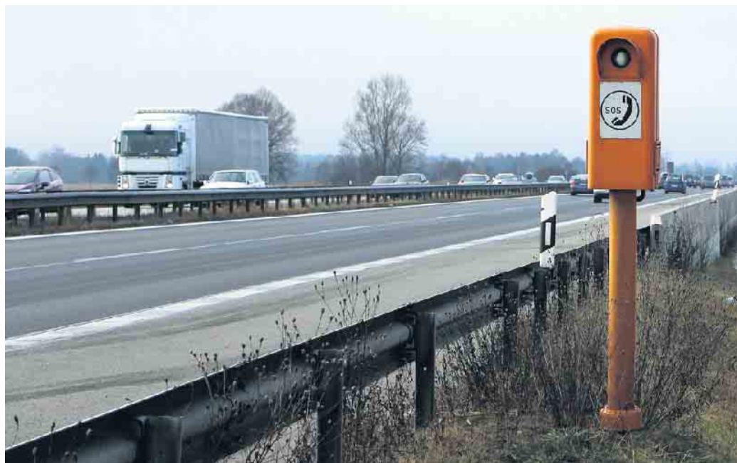
Alle zwei Kilometer steht eine Notrufsäule an der Autobahn. Ein Pfeil und eine Zahl auf den Leitpfosten geben Richtung und Abstand an.

Notrufsäulen haben eine selbst-erklärende Funktion: Bei Notfällen kann dort Hilfe gerufen werden. Aber auch wenn das Auto eine Panne hat und nicht mehr weiter möchte, kann man dort die rettenden Engel bestellen. Obwohl die meisten Menschen in Notfällen zum Handy greifen, laufen diese schon mal Gefahr, dass ihnen der Saft ausgeht - natürlich genau dann, wenn das Auto den Geist aufgibt. Von Funklöchern ganz zu schweigen. Die Zahlen belegen durchaus den Sinn der Säulen: Jährlich werden über diesen Weg immerhin circa 46.000 Notrufe abgesetzt, im Schnitt alle elf Minuten einer.