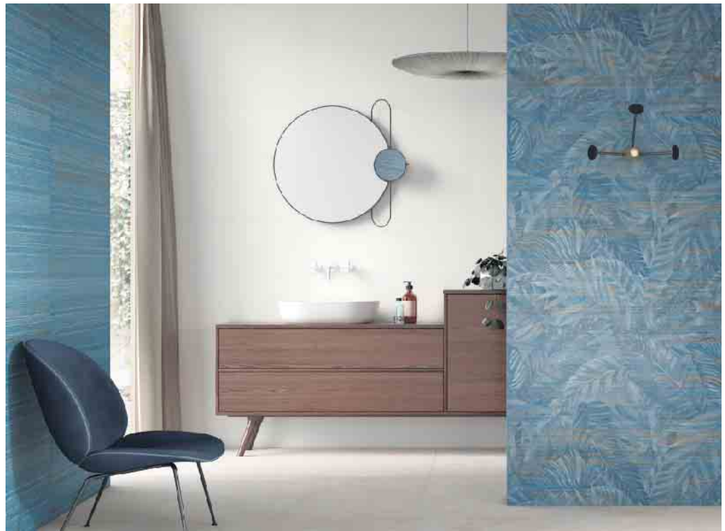
Das Bad als privaten Rückzugsort wünscht man sich heute wohnlich und individuell eingerichtet.

Das Bad gehört zu den wichtigsten Rückzugsräumen ins Private. Hier starten wir in den Tag, hier beenden wir ihn. Deshalb sollte die Badeinrichtung entspannenden Charakter haben - im Sinne eines Home-Spas zum Beispiel. Denn das Bad hat sich in den vergangenen Jahren von der nüchternen Nasszelle zu einem sinnlichen Lebensraum gewandelt. Zugleich sind Materialien und Farben im Bad vielfältiger geworden und spiegeln den persönlichen Einrichtungsstil ebenso wider wie das Wohnzimmer. Bauherren sind deshalb gut beraten, auf quali-