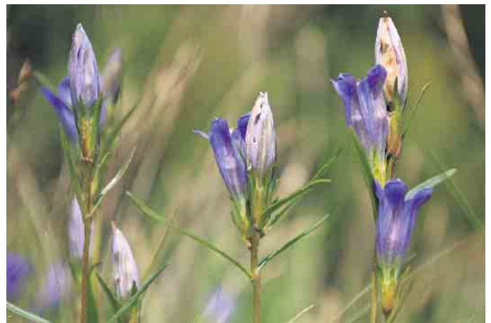
Wunderschön und stark gefährdet - der Lungen-Enzian blüht derzeit in der Sistig-Krekelel Heide.

ANZEIGEN · PROSPEKTEVERTEILUNG DRUCKE · WEB-AUFTRITTE · FILM