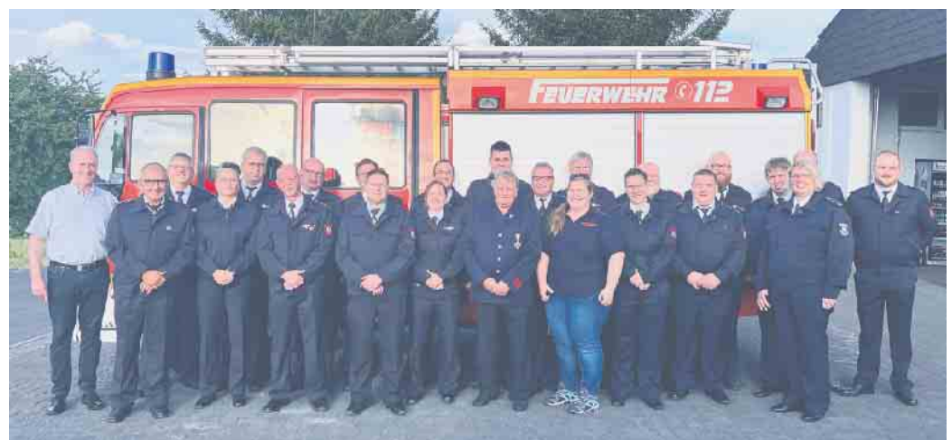
Ein Jahr nach der Flutkatastrophe bekamen die Einsatzkräfte der Löschgruppe Wahlen die vom NRW-Innenminister verliehenen Fluthelfer-Medaillen übergeben.