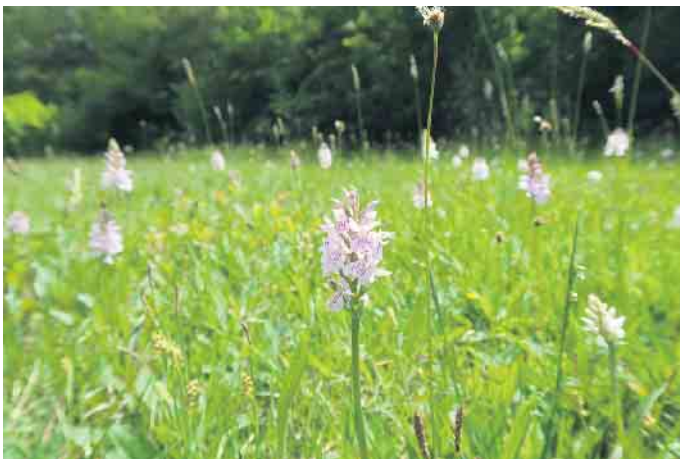
Neben dem Breitblättrigen Knabenkraut findet sich in der Heide auch das Gefleckte Knabenkraut, das im Frühsommer blüht.