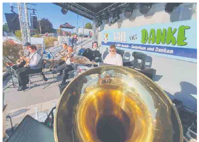
Bereits zum Jahrestag des Hochwassers Mitte Juli spielte die Musikkapelle Kall auf dem Bahnhofsvorplatz. Am 21. August lädt sie dort zum Sommerfest.