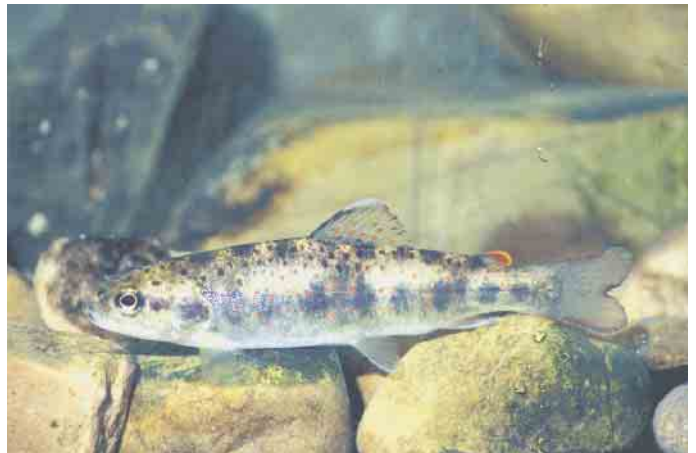
Die Bachforelle erholt sich offenbar gut von den Folgen der Flut