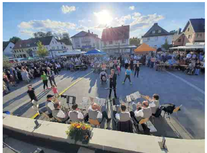
Bereits zum Jahrestag des Hochwassers Mitte Juli spielte die Musikkapelle Kall auf dem Bahnhofsvorplatz. Am 21. August lädt sie dort zum Sommerfest.