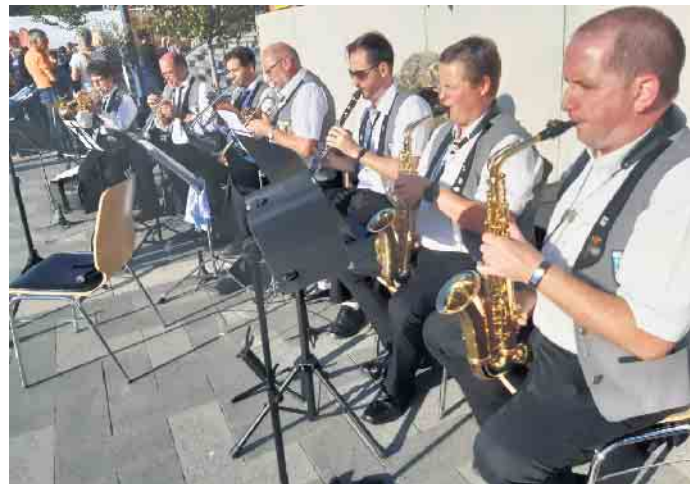
Bereits zum Jahrestag des Hochwassers Mitte Juli spielte die Musikkapelle Kall auf dem Bahnhofsvorplatz. Am 21. August lädt sie dort zum Sommerfest.

www.musikkapellekall.de, Facebook: MusikkapelleKall Instagram: musikkapellekall