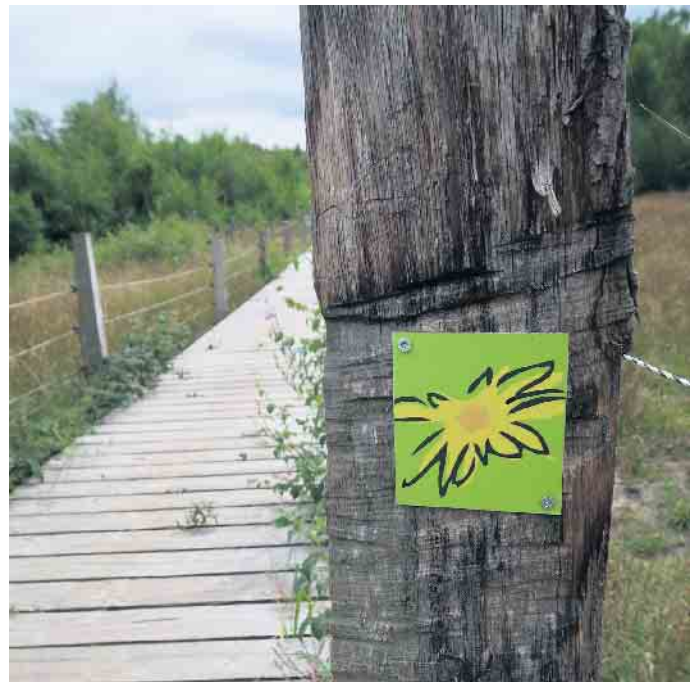
Größtenteils führen schmale Pfade durch Heide und kleinere Waldgebiete, hier und da überquert man aber auch den ein oder anderen Steg.

Tipp: Kleine, durch gelbe Holzpfähle gekennzeichnete Pfade führen mitten durch die Heide und an den seltenen Arten vorbei. Als Ausgangspunkt empfehlen sich die Parkplätze an der B 258, die allerdings über nur wenige Stellplätze verfügen. Aufgrund der Größe und Diversität des Gebietes sollten sich interessierte Wanderer vorab über mögliche Wanderwege informieren. (epa)