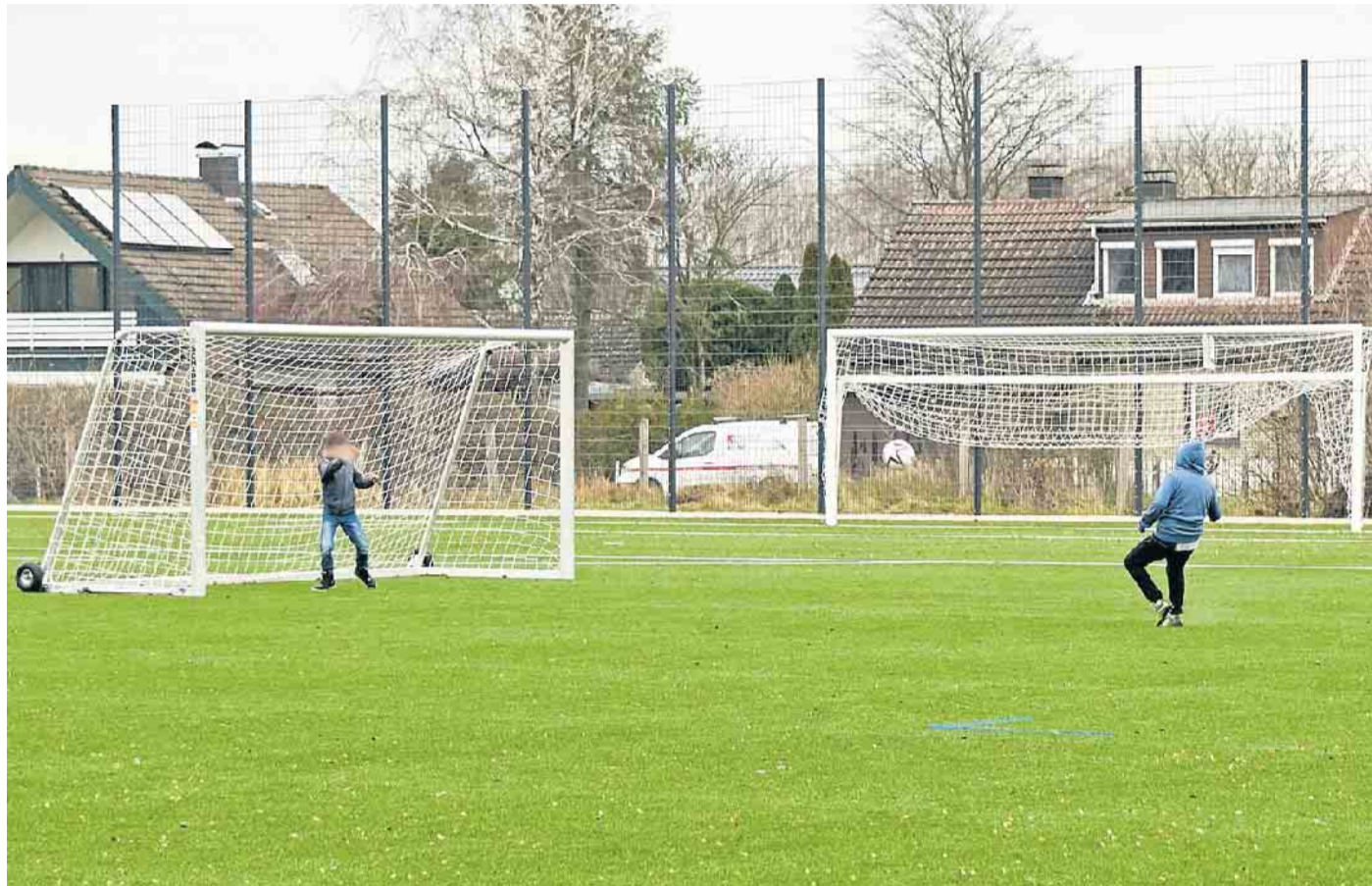
Der jüngste Kunstrasenplatz in Kachtenhausen ist zugleich der letzte Kunstrasenplatz, der neu angelegt wurde. Weitere derartige Spielfelder sind nicht geplant.

Die insbesondere von der Jamaika-Koalition (CDU, Grüne, FDP) jetzt formulierte Absage an Kunstrasenplätze in Hagen, Heiden und Hörste bedeutet eine deutliche Abkehr der Ratsmehrheit von den Ratsbeschlüssen vom 18. November 2021 und vom 8. Mai 2018, als man sich noch für die Errichtung von Kunstrasenkleinspielfeldern in den Ortsteilen Hagen, Heiden und Hörste ausgesprochen hatte. Im Mai 2018 hatte der Rat festgelegt, dass auf dem Nebenplatz des Sportplatzes Kachtenhausen der dritte Lagenser Kunstrasenplatz (106 mal 68 Meter) anzulegen sei. Weiter wurde entschieden, auf dem Trainingsgelände der