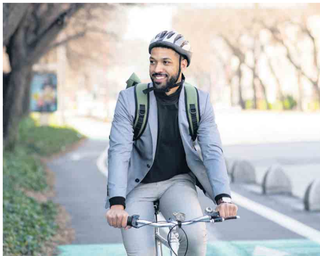
Die Mitmachaktion „Mit dem Rad zur Arbeit“ ist bei den Menschen im Kreis Lippe dauerhaft und sehr beliebt. Im diesjährigem Aktionszeitraum vom 1. Mai bis 31. August 2022 haben sich 843 Einzelteilnehmer beteiligt.