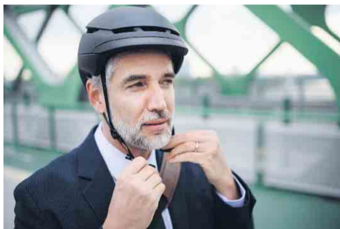
Für viele im Homeoffice Tätige ist Fahrradfahren ein wichtiger körperlicher Ausgleich geworden, der sich positiv bei der Arbeit und der persönlichen Fitness bemerkbar macht.

zur Mitarbeitergesundheit und zum Umweltschutz bei und senken ihre Kosten.“