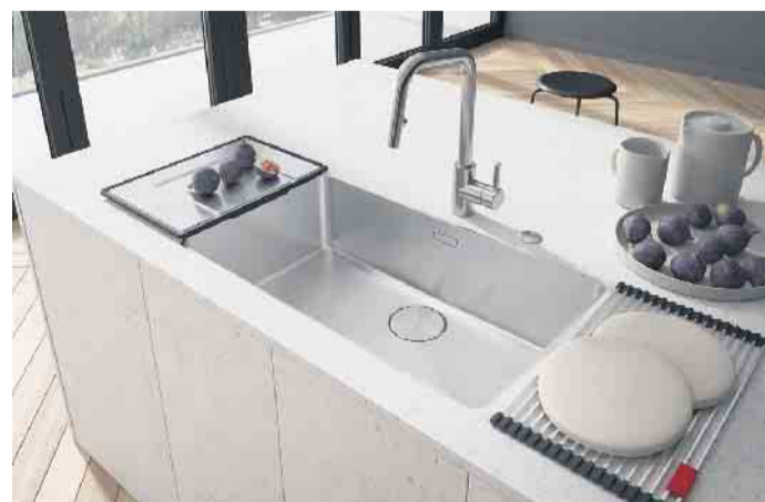
Blickfang Spüle: Filigran, zeitlos elegant und gefertigt mit höchster Präzision ist dieses Edelstahlbecken mit seinem nur 6 mm schmalen Rand. Passgenau gefertigt ist auch das Zubehör: die Rollmatte und das mobile Tropfteil.

Bei uns wird FACHBERATUNG groß geschrieben!