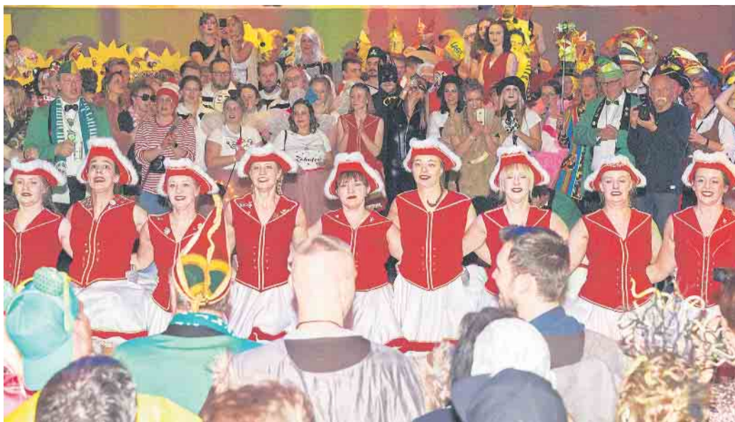
Phänomenal: Wenn das „Sunnerbieke-Ballett“ tanzt, kocht der Saal.

1949 etablierte sich ein Elferat im TuS Müssen-Billinghausen und lud ein zur Karnevalsfeier „Sunnerbieke-Ellernhüchte!“ Mit den Einnahmen aus der Feier wurde die Jugendabteilung des Vereins unterstützt. Am Samstag, 28. Januar 2023, wird in der Sporthalle an der Hörster Straße und im benachbarten TuS-Culum die 73. Auflage der Feier zelebriert, die sich mittlerweile gemausert hat zur ausgelassenen Kostümparty mit den fantastischsten Verkleidungen weit und breit. Einlass ist ab 19.30 Uhr.