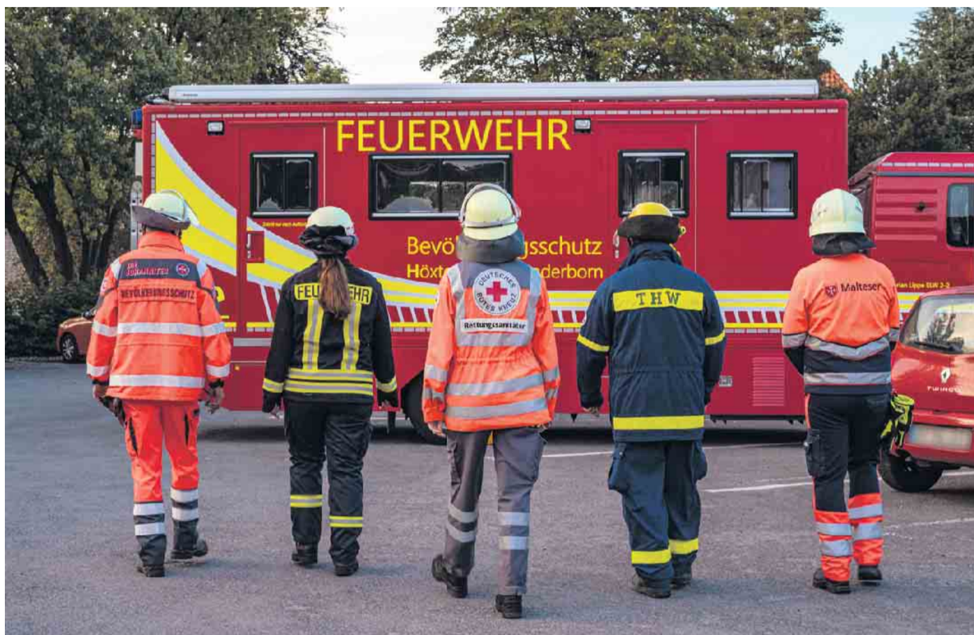
Ohne sie geht es nicht: Rettungskräfte aus allen Bereichen waren auch in 2022 für die Lipperinnen und Lipper im Einsatz.

Im Jahr 2022 stehen 96.516 Einsätze, die nicht über die 116117 disponiert wurden, 86.402 Einsätzen in 2021 gegenüber. Insgesamt musste die Feuerwehr 4.732 Mal alarmiert werden (im Vergleich 2021: 4.123). Der Ret-