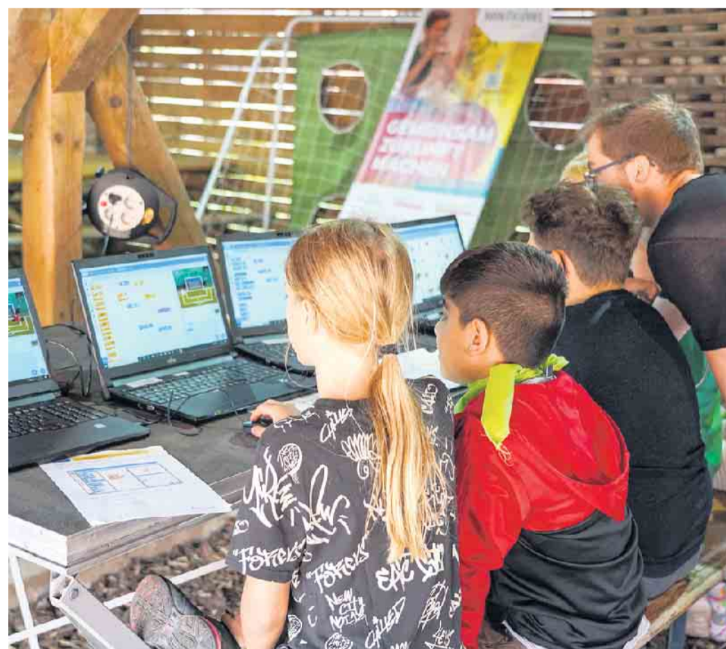
Kinder und Jugendliche lernen gemeinsam die Programmiersprache „Scratch“ kennen.

Nach einer Einführung in die Programmiersprache „Scratch“ entwickeln die Teilnehmenden eigene Ideen für kleine Computerspiele. Anschließend können die Kinder und Jugendlichen ihre Ideen selbst programmieren. Der Workshop findet am Samstag, 14. Januar, von 10.30 bis 13.30 Uhr im Innovationszentrum des Kreises Lippe, Energiepark 2, 32694 Dörentrup (gegenüber vom Schloss Wendlinghausen), statt. Das Angebot ist für Jugendliche kostenfrei, da es im Rahmen des geförderten Projektes MINT Community 4.OWL stattfindet. Weitere Informationen zum Workshop und zur Anmeldung gibt es unter www.innovationszentrum-doerentrup.de/veranstaltung .