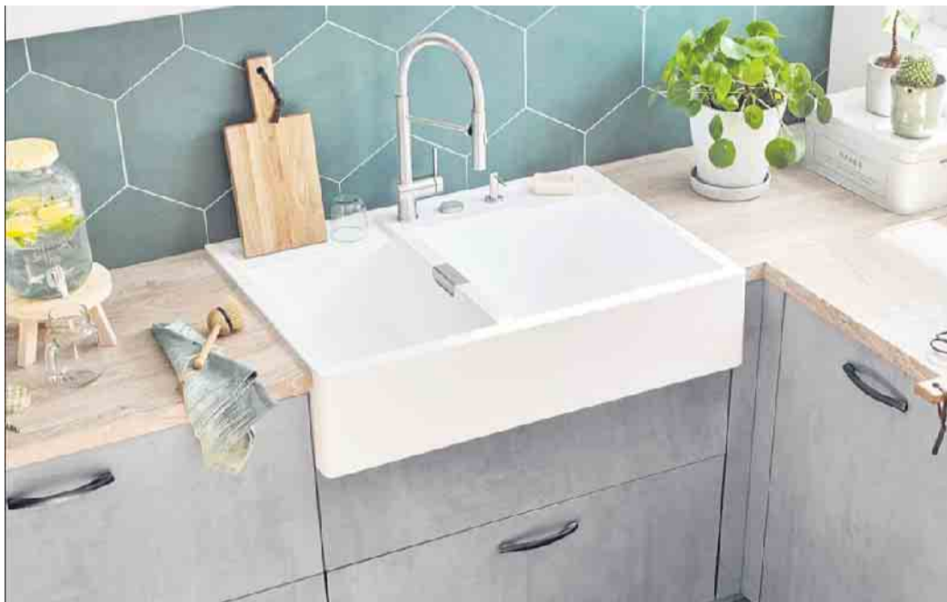
Nachhaltiges Granitspülenmodul mit seidenmatter Premium-Oberfläche und ABERLEFFEKT, was sie besonders reinigungsfreundlich macht. Am Ende ihres Lebenszyklus wird sie in einen Recycling-Kreislauf zurückgeführt.

Zu einer der ältesten zivilisatorischen Kulturtechniken gehört die Herstellung von Keramik, wie die vielen und auch hoch künstlerisch gestalteten Artefakte vergangener Kulturen belegen. Das moderne Pendant ist ebenfalls ein Kunstwerk und erfordert große Expertise: die