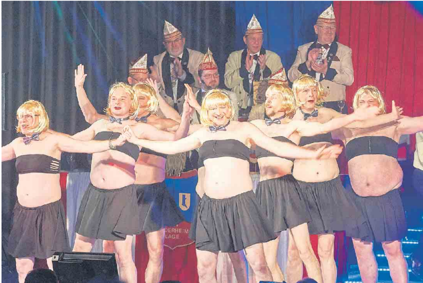
Immer wieder ein Höhepunkt bei der Liederheim Prunksitzung: „Die LiLa Girls“.