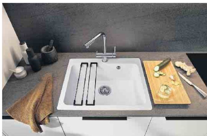
Raumwunder mit großem Beckenvolumen: Diese Granitspüle in einer ausgewogenen und modernen Linienführung sorgt für Spülkomfort im Kompaktformat. Vielseitiges Zubehör macht sie zum Multitalent am Wasserplatz. (Foto: AMK)

„Neben ihren besonderen Gebrauchs- und Materialeigenschaften überzeugen moderne Spülen insbesondere auch aufgrund ihrer hohen Funktionalität. Hinzu kommen ein außergewöhnliches Design und eine sehr angenehme Haptik. Ob es nun eine formschöne Edelstahl-, Keramik- oder Granit-spüle wird, seine finale Kaufentscheidung sollte man am besten in einem Küchenstudio oder in einem Möbelhaus treffen“, empfiehlt AMK-Geschäftsführer Volker Irle. (AMK)