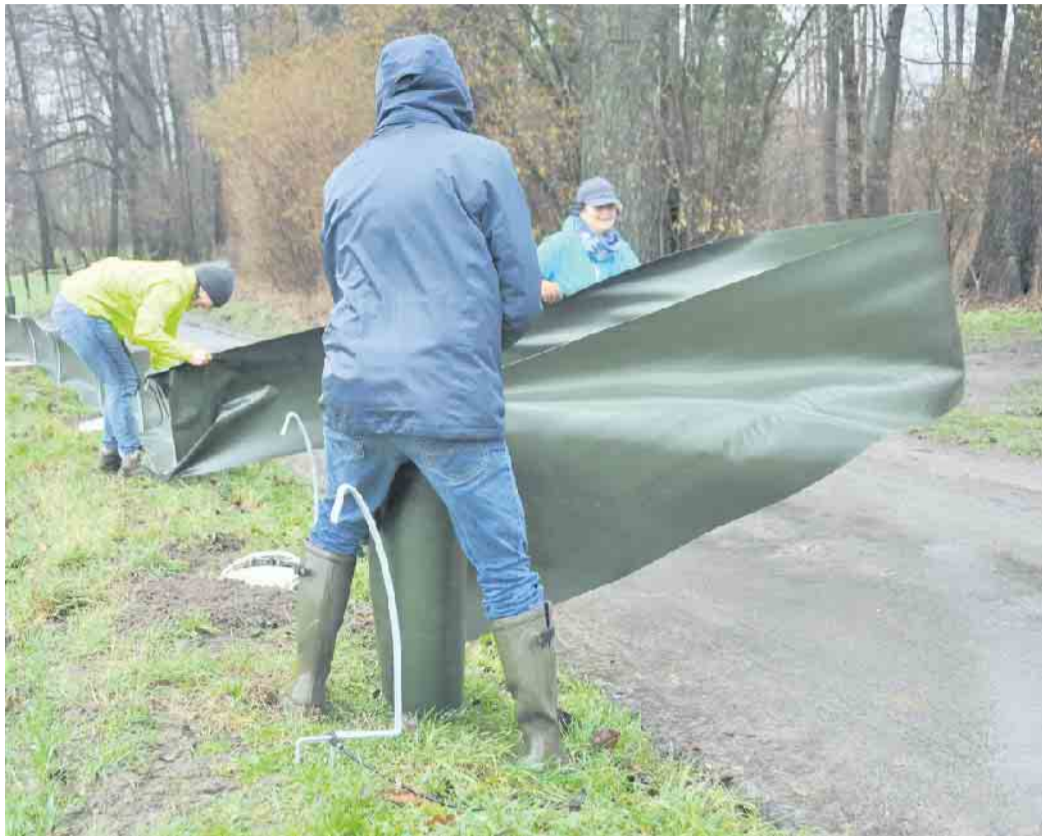
Wehender Zaun: BUND-Mitglieder stellen bei schwieriger Wetterlage den Krötenzaun auf.

Damit sie an Straßen unbeschadet bleiben, sind jetzt in Lage an bewährten Stellen wieder Amphibien-Schutzzäune aufgebaut. In diesem Jahr sollte auch an der Schieregge in Lage Müssen ein Schutzzaun installiert werden. Da von Seiten der Stadt und des Kreises Lippe aufgrund von Personalmangel keine Unterstützung zu bekommen war, bauten vier Mitglieder des BUND Lage am vergangenen Wochenende den Amphibienzaun in Müssen auf. Das Wetter war zum Aufbauen ungünstig. Windböen erschwerten den Umgang mit dem Zaunmaterial. So werden Nacharbeiten noch im Laufe der nächsten Woche zu erledigen sein: Die Eimerböden werden mit Materialien wie feuchtem Moos belegt, damit sich