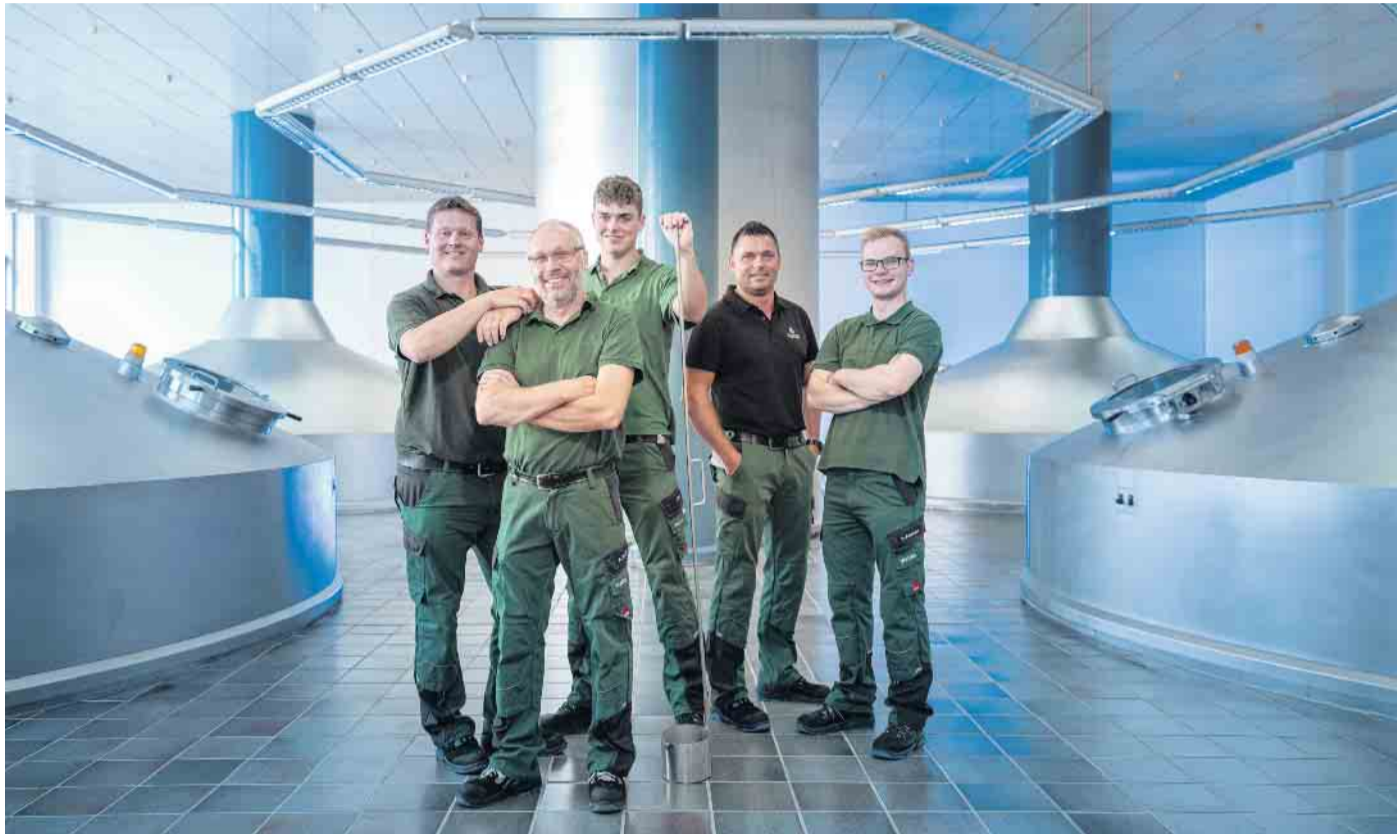
Ein traditionsreicher Beruf setzt heute auf fortschrittliche Technik: Das macht den Reiz der Tätigkeit des Brauers und Mälzers aus.

Berufe: Brauer und Mälzer sorgen für den individuellen Charakter eines Bieres