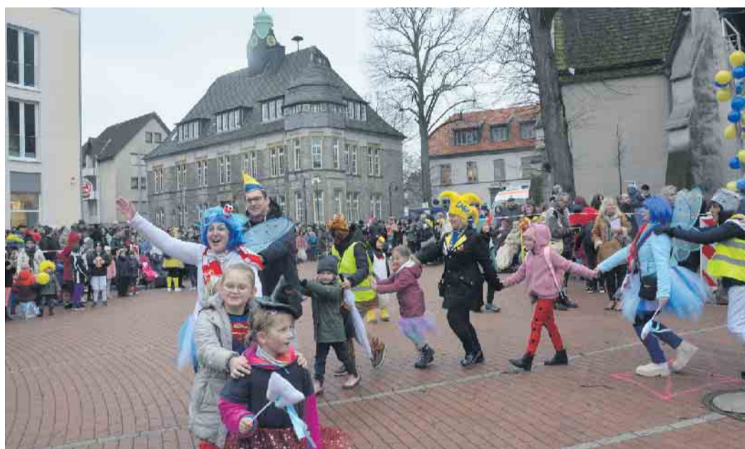
Polonaise durch die Lagenser Innenstadt