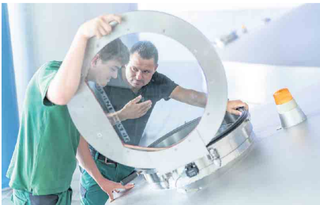
Brauer- und Mälzer-Azubis durchlaufen in drei Jahren alle Schritte der Bierherstellung und erlernen den Umgang und den Einsatz von Roh-, Hilfs- und Betriebsstoffen.

verantwortlich. Besonders das sogenannte Pichen war nicht ungefährlich. Um die Poren und Fugen des Holzes zu schließen und ein Entweichen der Kohlensäure zu verhindern, aber auch um im Fassinneren eine geschmackliche Veränderung durch den Kontakt zwischen Bier und Holz zu vermeiden, mussten Küfer die Holzfässer mit flüssigem und extrem heißem Pech auskleiden. War die dünne Schicht beschädigt, musste mühsam eine neue aufgetragen werden. (djd)