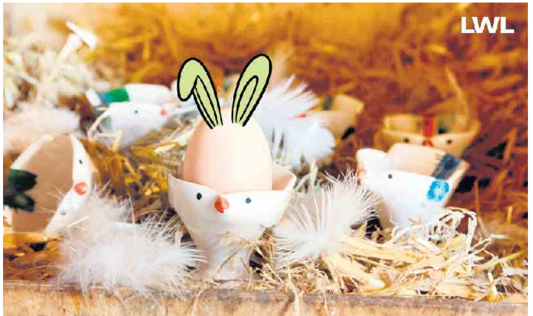
Der Osterhase kennt alle guten Verstecke auf dem Museumsgelände.

(lwl). Ostern steht vor der Tür und das LWL-Museum Ziegelei Lage startet am Gründonnerstag (28. März) sein Kinder-Osterprogramm mit dem Workshop „Altes Handwerk: Ostern“. Zwischen 10 und 15 Uhr können im Museum des Land schaftsverbandes Westfalen-Lippe (LWL) Kinder ab 5 Jahren eine Stunde verweilen und aus verschiedenen Materialien kleine Osterüberraschungen basteln, während die Erwachsenen das Museum erkunden oder eine Stärkung im Museumscafé zu sich nehmen. Offenes Mitmachprogramm ohne Anmeldung. Teilnahmegebühr inkl. Material 8 Euro.