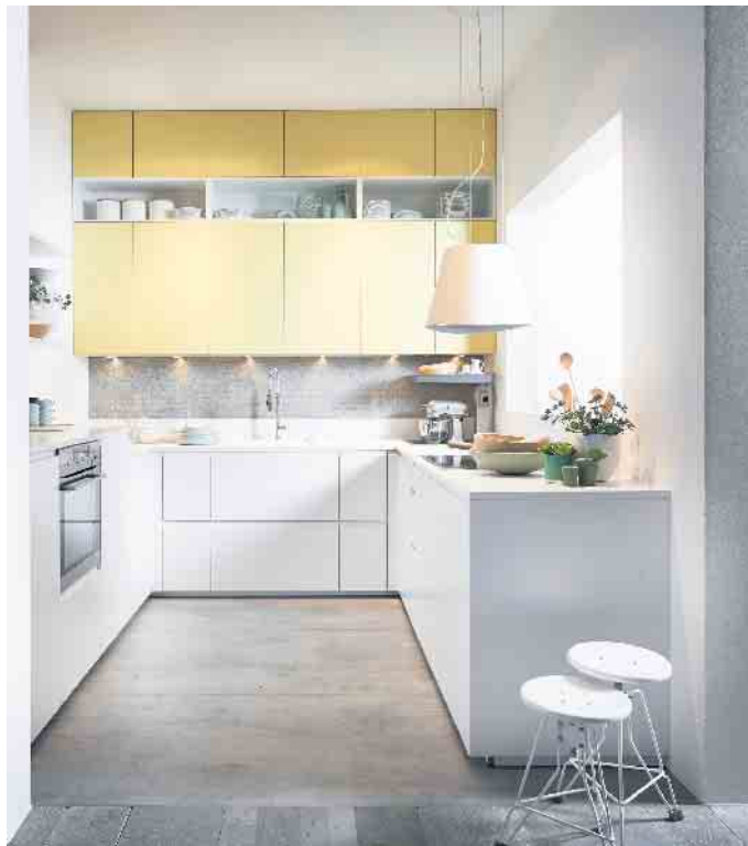
Je weniger Grundfläche zur Verfügung steht, desto mehr wird in die Höhe geplant wie bei dieser sehr ansprechenden Lösung mit reichlich Stauraum und modernen, softmatten Oberflächen in hochwertigem Echtlack.

Möbel, Hausgeräte und Küchenzubehör - sie alle sind so konzipiert und optimiert, dass sie ihre Nutzer nachhaltig erfreuen, Schönheit und Komfort in ihren Alltag bringen und ihnen ein angenehmes Lebens- und Wohngefühl vermitteln. Das gilt auch für die Planung kleiner, feiner Küchen bis hin zu Tiny Kitchen. Mit raumoptimierten Möbeln, Beschlägen, Hausgeräten und Zubehörelementen können auch kleinere Küchen zu wahren Stauraumwundern werden. Am Anfang steht das exakte Aufmaß. Dabei haben die Küchenspezialisten gerade bei kleinen Grundrissen alle Optionen im Blick, die Wände, Nischen/Ecken und die Decke bieten. Denn wo es an Grundfläche fehlt, wird in die Höhe geplant - mit Hilfe von Hoch-, Hängeschränken und Regalsystemen. Damit man später an seine verstauten Inhalte in luftiger Höhe auch bequem herankommt, gibt es zum Beispiel innovative Auszugssysteme. Damit zieht man das Staugut elegant auf die gewünschte Höhe zu sich heran. Oder Teleskopregale, die per Fernbedienung aus dem Hängeschrank herausfahren. Auch die Decke über einer kleinen Kochinsel lässt sich nutzen - beispiels-