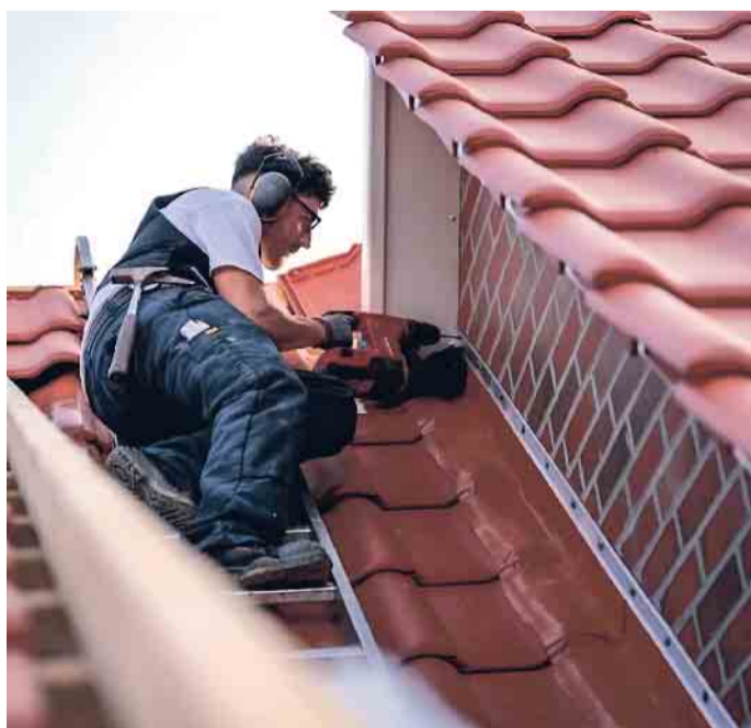
„Am Ende des Tages möchte ich das Resultat meiner Arbeit sehen. Das bietet mir der Beruf.“ Ercan Cibar, Dachdecker-Azubi im 3. Lehrjahr.