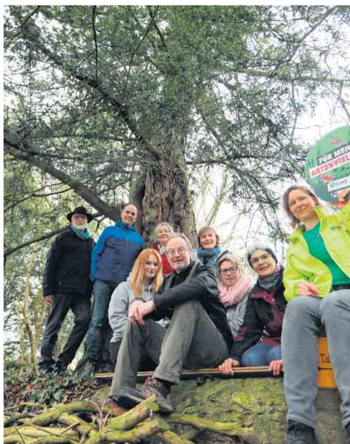
BUND Ortsgruppe Lage vor einer 300-jährigen Eibe in Lage-Ehrentrop.

Bäume dienen als lebendige Klimaanlage. Dabei sind sie Hauptträger der biologischen Vielfalt und nicht zuletzt durch ihre Schönheit besonders wertvoll für Menschen. Jetzt lädt die Ortsgruppe die Bürgerinnen und Bürger zum Einsenden von Fotos und zu Baum-Spaziergängen ein. Dabei geht es jeweils um Ihren persönlichen Lieblingsbaum: Machen Sie mit? Viele haben ihren besonderen Baum, einen den sie immer wieder aufsuchen, den sie hegen und pflegen oder einfach schön finden. Wenn auch Sie solch einen Baum schätzen, sei es in Ihrem Garten oder auf öffentlicher Fläche, zeigen Sie ihn uns. Machen Sie ein Foto von Ihrem Lieblingsbaum und laden Sie das Bild auf unserer Homepage hoch (mit Anleitung auf www.bund-lippe.de/mein-liebingsbaum ). Die eingesendeten Fotos werden dort öffentlich sichtbar. Aus allen eingesandten Bildern werden zehn für die Herausgabe einer Postkarten-Serie ausgewählt, die am Ende des Jahres erscheint. Daneben lädt der BUND Lage zu geführten Spaziergängen ein, um die genannten Lieblingsbäume vor Ort aufzusuchen. Die Expertin für Natur- und Baumschutz Margarete Wißmann wird angesichts der Bäume Fachwissen beitragen sowie alte Geschichten über die Baumarten erzählen. Der erste Spaziergang findet im Mai statt, der Termin wird rechtzeitig über die Medien bekannt gegeben sowie auf www.bund-lage.de . Alle sind herzlich eingeladen.