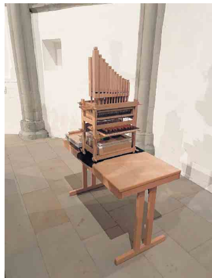
Lippischer Orgeltag mit Orgelbauprojekt.