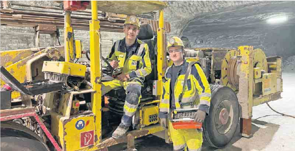
Die Bergleute arbeiten mit hochmoderner Ausrüstung und Technik.

Eine Ausbildung im Bergbau ist spannend und bietet sehr gute Berufsperspektiven