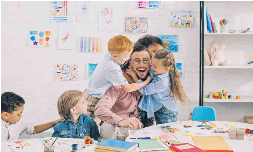
Ein Kita-Assistent kümmert sich um alle nicht-pädagogischen Belange in der Kita, hilft unter anderem bei Mahlzeiten, Körperhygiene und organisatorischen Dingen.

Weiterbildung als Schlüssel zu persönlicher Erfüllung und beruflicher Sicherheit