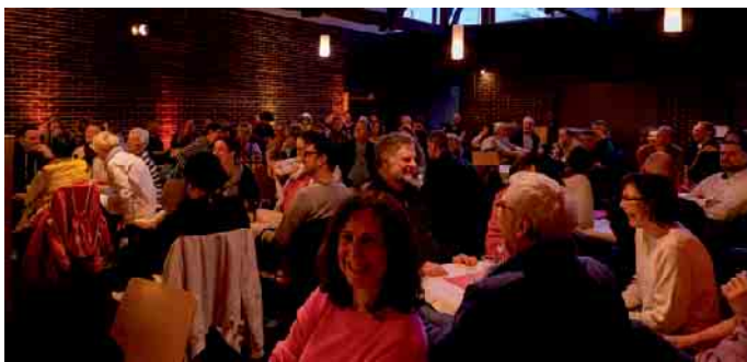
Impressionen vom Kneipenquiz (ohne Kneipe) im April

Nach dem großen Erfolg der vergangenen zwei Quiz-Veranstaltungen