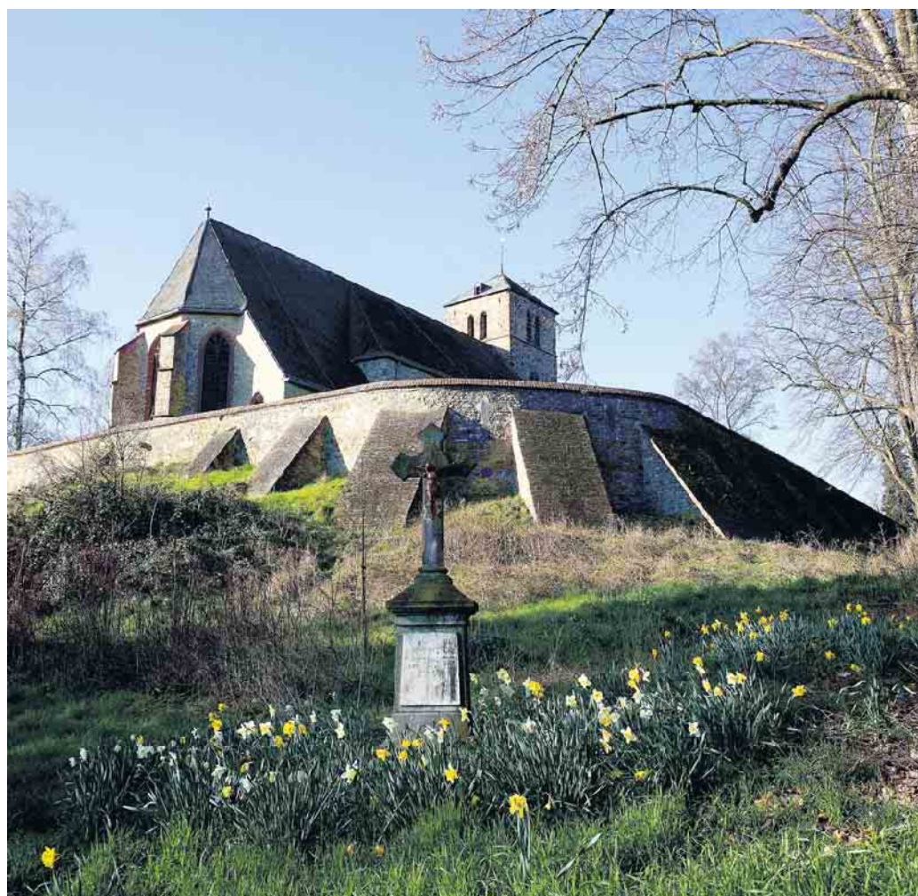
Osterglocken zur Osterzeit.