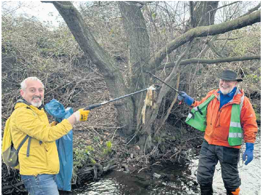
Frühjahrsputz kann auch Freude machen