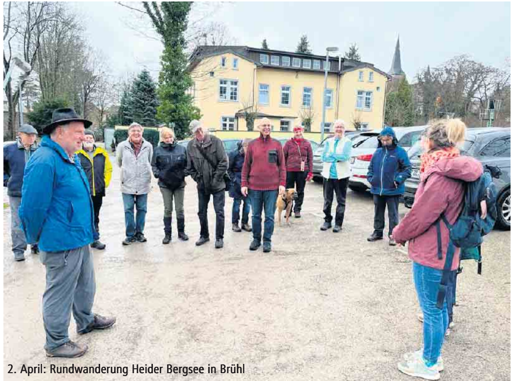
2. April: Rundwanderung Heider Bergsee in Brühl