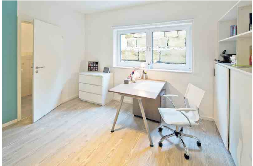
„Wohnkeller stehen oberirdischen Räumen heute in puncto Wohnkomfort in nichts mehr nach“.

Eine separate Wohneinheit unter dem eigenen Dach bietet maximale Flexibilität. Sie kann familienintern genutzt werden, beispielsweise zunächst von einem der Kinder und später dann von den Eltern, wenn der Nachwuchs mit der eigenen Familie