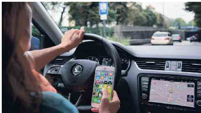
Schon eine Sekunde Ablenkung am Steuer bedeutet viele Meter Blindfahrt.

des Lenkers angebracht werden, damit das Handy nicht beim Bremsen stört. (mid/ak-o)