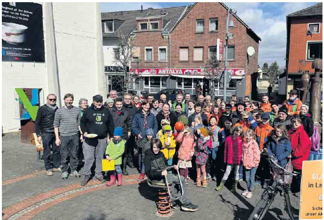
TeilnehmerInnen der IG-Aktion nach getaner Arbeit

Das seit vielen Jahren beliebte Reibekuchenfest des Jugendtreffs JuWeL e.V. in Langerwehe-Heistern, Hamicherstr. 53, findet in diesem Jahr am 7. Mai ab 12 Uhr statt. Außer Reibekuchen gibt es Kaffee und Kuchen sowie verschiedenste Kältgetränke im Angebot.