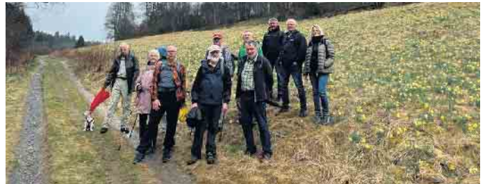
13. April: Narzissenwanderung in Monschau-Höfen