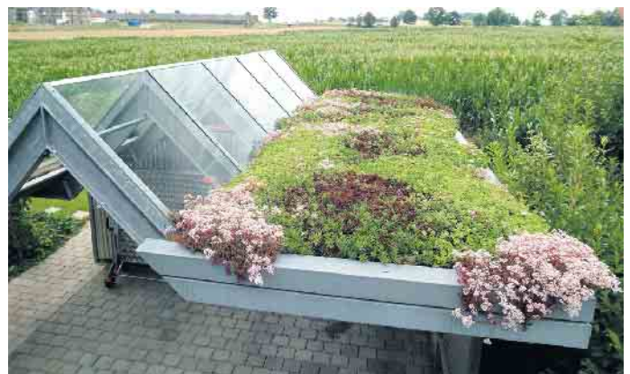
Auch auf kleinen Flächen wie dem Dach eines Carports kann viel Grün sprießen.

insektenfreundlichen Biotopelmenten, variierenden Substratstärken sowie blütenreicher Bepflanzung für Bienen und Schmetterlinge zum Schutz der Artenvielfalt. Komplettsysteme beispielsweise von Bauder erleichtern den Aufbau langlebiger und dichter Gründächer, unter www.bauder.de etwa finden sich mehr Details sowie Ansprechpartner im Fachhandwerk vor Ort. Erfahrene Experten begleiten die gesamte Planung und Ausführung und können darüber hinaus nützliche Tipps zur Pflege des Gründachs geben. Übrigens: Einige Kommunen fördern die Dachbegrünung, zum Beispiel durch Nachlässe bei den Abwassergebühren. Details dazu sind mit der örtlichen Verwaltung zu klären, dabei können die Fachbetriebe ebenfalls unterstützen. (DJD)