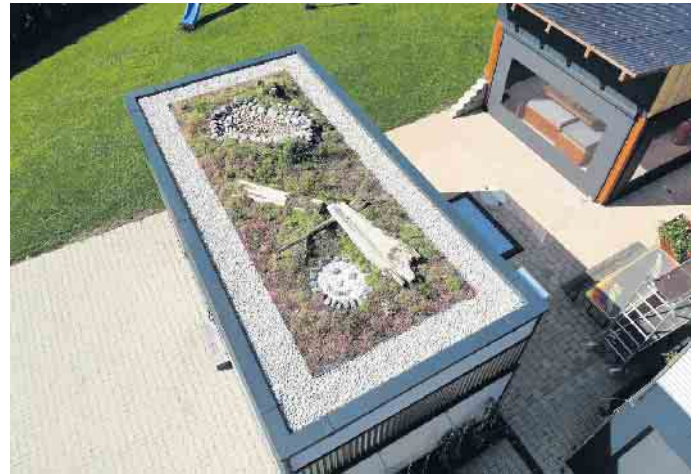
Mehr Grün für die Stadt: Flachdächer lassen sich in kleine Biotope verwandeln.

Bei einer nachträglichen Begrünung von Dächern sind zunächst die Voraussetzungen zu prüfen, von der Statik bis hin zur Dichtigkeit. Noch unkomplizierter ist es, bei Neubauten direkt an eine Bepflanzung zu denken und damit Teilflächen wieder zu entsiegeln. Dafür gibt es grundsätzlich drei Möglichkeiten. Die extensive Begrünung ist, wie es der Name schon andeutet, die pflegeleichteste Variante. Dabei erhält das Dach einen geschlossenen grünen Teppich, der sich selbst versorgt -