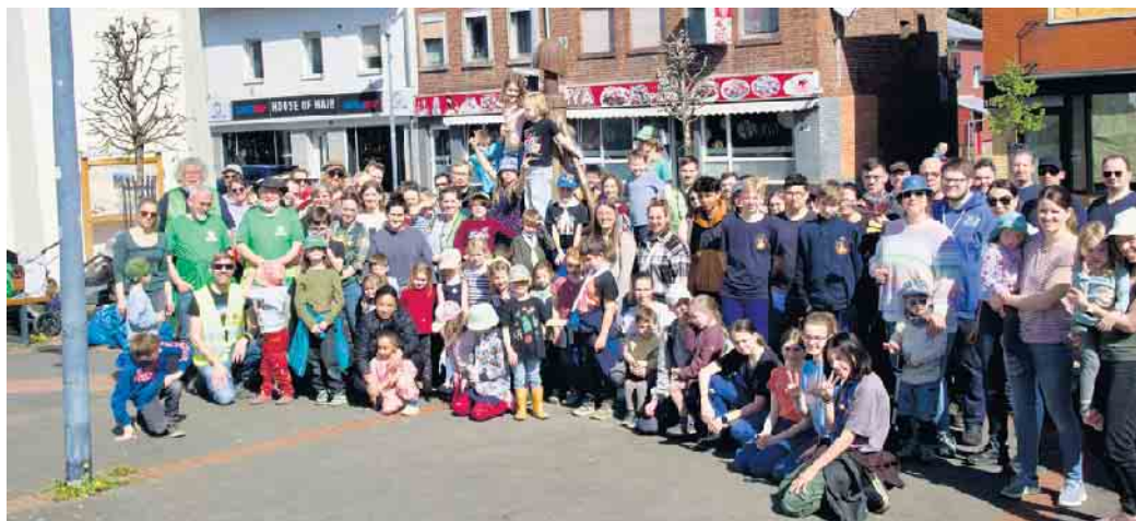
Teilnehmer des Frühjahrspuzzes

Anfang April lud die Interessengemeinschaft der Langerweher Vereine (IG Langerwehe) zum gemeinsamen Frühjahrsputz in Langerwehe ein. Über 100 Bürger-