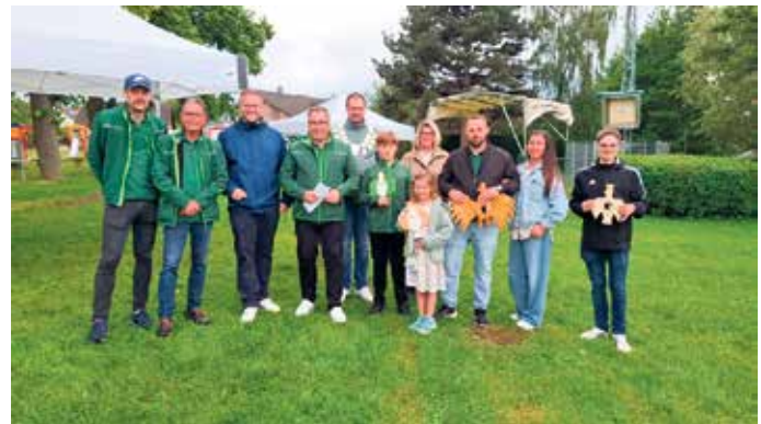
Unsere neuen Majestäten mit Bürgermeister, Vorstand und Schießmeister.

Sonntag, 12. Juli 9:45 Uhr - Festmesse an der Do-