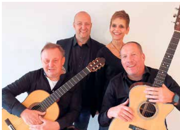
Das Ensemble „BriSamt“ gastiert im Töpfereimuseum

Termin: Sonntag, 28. Juni, im Töpfereimuseum Langerwehe Beginn: 19 Uhr, Einlass: 18 Uhr Eintritt frei, Spenden erwünscht.