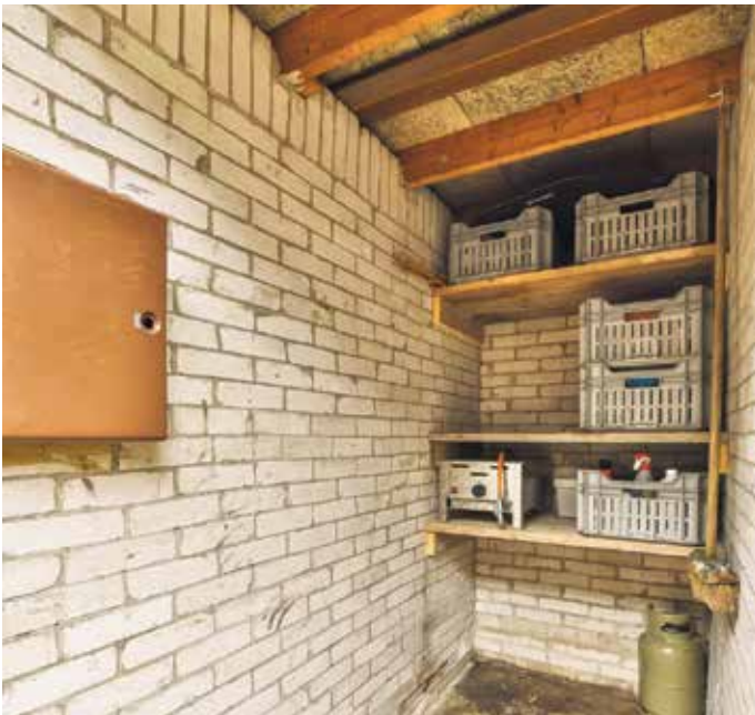
Wer Objekte in Kellerräumen etwas erhöht lagert, kann potentielle Schäden minimieren.

Innerhalb weniger Minuten laufen Straßen voll, Gullydeckel heben sich an, Wasser drückt in Hauseingänge und Keller. Starkregenereignisse treten in Deutschland seit Jahren häufiger auf - und sie treffen längst nicht mehr nur klassische Hochwassergebiete an großen Flüssen. Besonders betroffen sind oft Wohngebiete, deren Kanalisation enorme Wassermengen kurzfristig nicht aufnehmen kann.