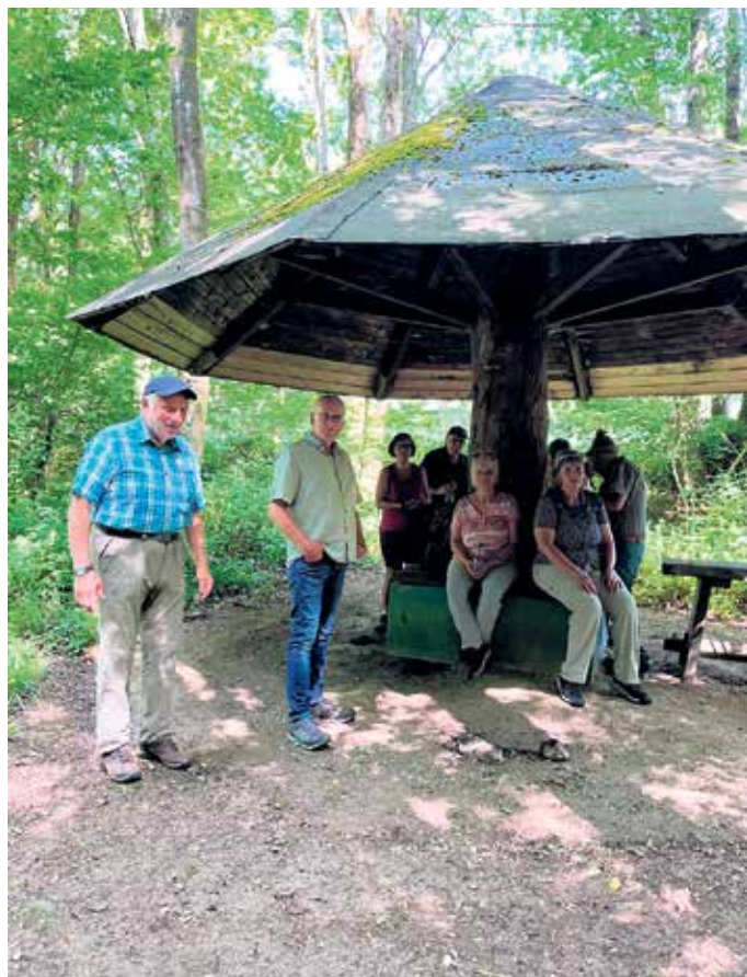
Simonskall - Mestrenger Mühle