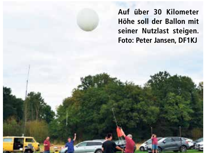
Auf über 30 Kilometer Höhe soll der Ballon mit seiner Nutzlast steigen.

mit Sender, erreicht geplant über 30 Kilometer Höhe und erlaubt eine genaue Verfolgung des Ballons bis zu seiner Landung. In der geplanten Maximalhöhe platzt der Heliumballon. Die Nutzlast gleitet dann an einem Fallschirm zurück zum Boden. Nicht nur das Projektteam wird diesen Flug genauestens beobachten, jeder Interessierte kann die ausgesendeten Informationen mit geeigneten Empfängern mithören. Da ist es sicher nicht nur interessant, welchen Weg der Ballon nimmt, sondern auch, welche Strecken die Funksignale aus dieser Höhe zurücklegen können. Weitere Informationen findet man auf der Webseite g-fliegt.