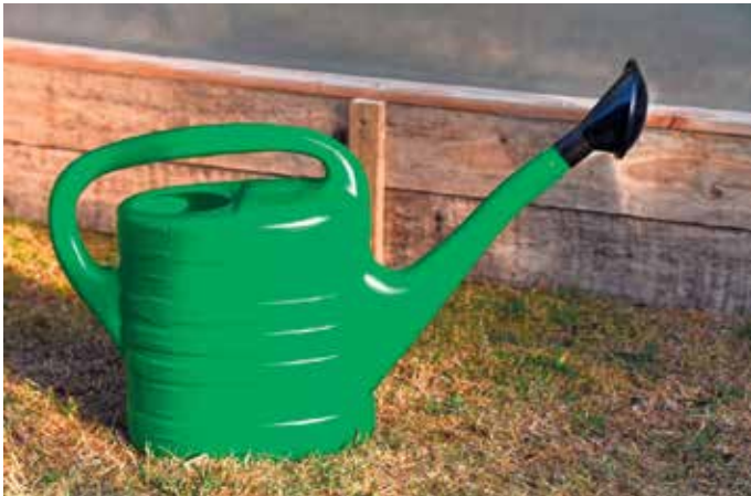
Der Klimawandel stellt viele Hobbygärtner vor echte Herausforderungen.

Mulchen, trockenheitsresistente Arten, klimaangepasste Gehölze - Gartenbauexperte gibt Empfehlungen für den Sommer