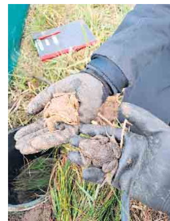
Biologische Station Düren

Unsere Bundesfreiwilligen setzen sich aktiv für den Erhalt unserer Biodiversität ein. Sie lernen die unterschiedlichen Schutzgebiete kennen und übernehmen dort vielfältige praktische Aufgaben.