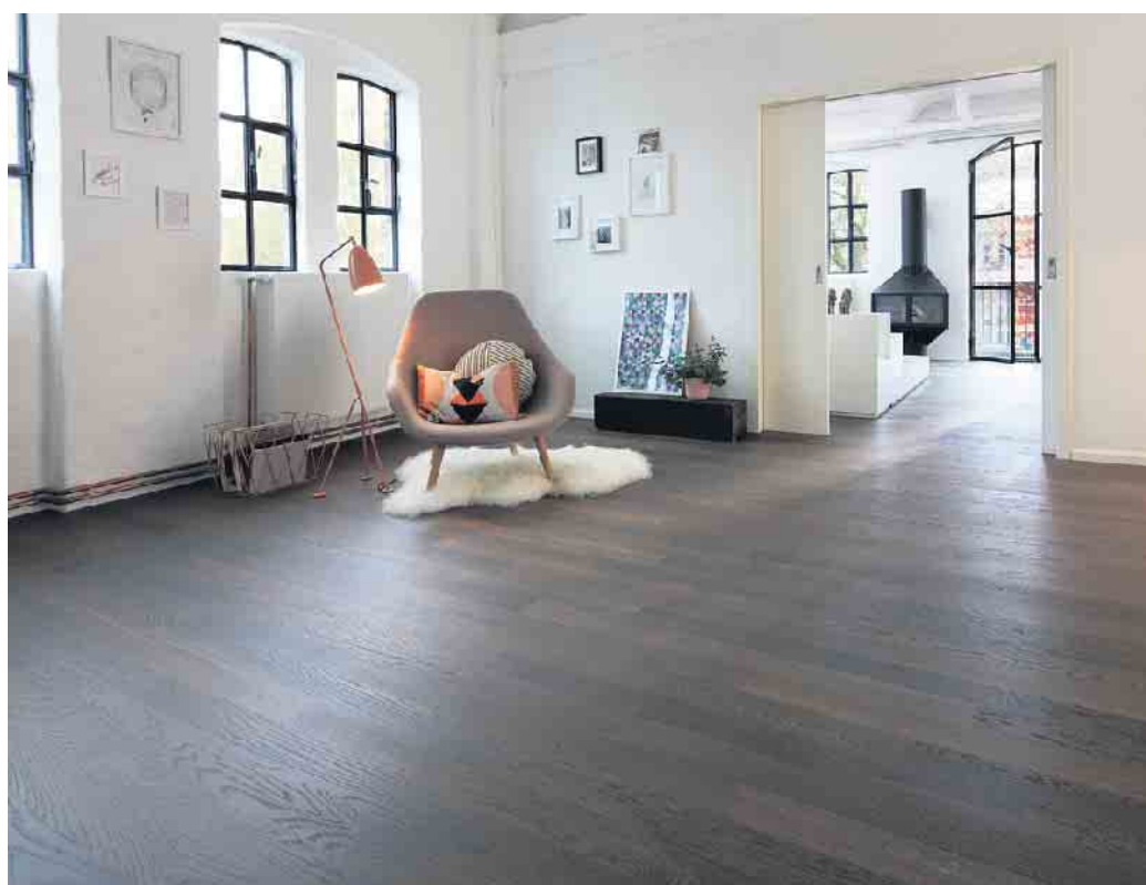
Parkett hält über Generationen.

Um Kratzer auf dem Parkett zu vermeiden, sollten Tische und Stühle, Sessel und Sofas Filzgleiter erhalten. So lassen sie sich verrücken, ohne dass der Holzboden Schaden nimmt. Entsteht doch einmal eine Delle oder ein Kratzer, sollte diese Stelle repariert werden - nicht nur um die Optik zu bewahren, sondern auch um das Holz zu schützen. Stärker beanspruchte Laufwege brauchen trotz guter Pflege irgendwann eine Aufarbeitung. Bei geöltem Holz reicht eine partielle Auffrischung, bei lackiertem Holz muss die gesamte Fläche geschliffen und neu versiegelt werden. So ist der Lieblingsboden immer noch schön, wenn die Einrichtung längst ausgetauscht wurde. Verband der Deutschen Parkettindustrie e.V. (vdpi)