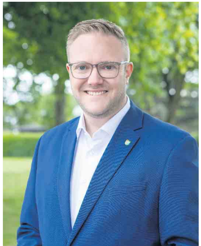
Bürgermeister Moritz Pelzer