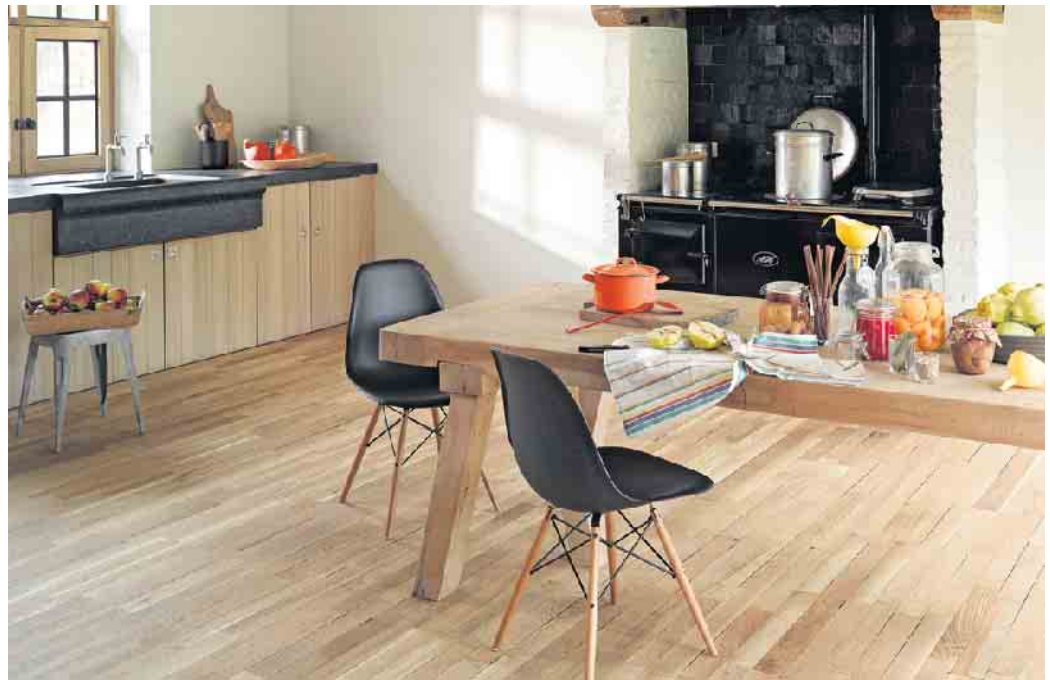
Wichtig sind Filzgleiter unter den Möbeln, um das Parkett vor Kratzern zu schützen.