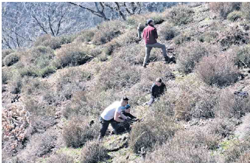
Biologische Station Düren

Wir freuen uns über eine Bewerbung unter info@biostation-dueren.de und hoffen auf neue Bundesfreiwillige, die unser Team verstärken.