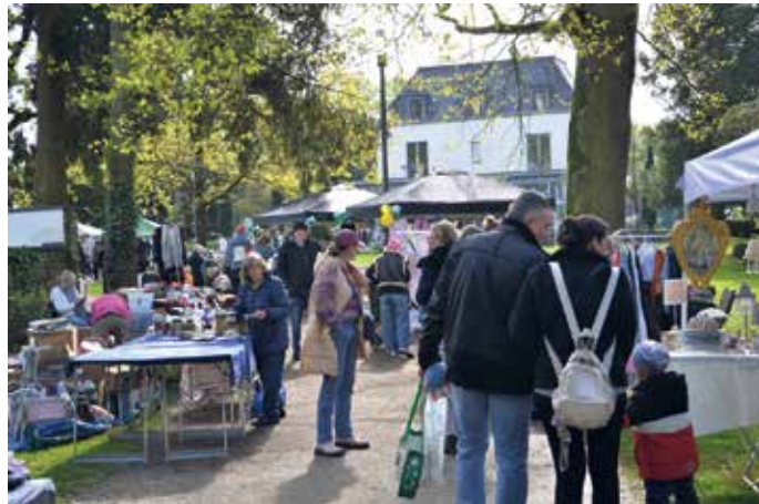
Zahlreiche Trödelfans fanden den Weg in den Park der Villa Fried- linde

Die AWO hatte mit viel Herzblut organisiert: von der Standver- teilung über die Werbung bis hin zum kulinarischen Höhepunkt des Tages - dem großen Kuchenbuffet. Dutzende selbstgebackene Torten und Kuchen sorgten für leuchtende Augen und zufriedene Gesichter. Ob klassischer Apfelkuchen, cremige Schokotorte oder fruchtige Obstva- riationen - das Buffet war ein wah- res Meisterwerk der Backkunst und wurde von den Besucherinnen und Besuchern begeistert angenommen.