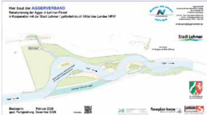
Visualisierung der Renaturierung der Agger in Lohmar-Peisel (Aggerverband)

Bei strahlendem Frühlingswetter ist am 15. April der offizielle Startschuss für die Gewässerentwicklungsmaßnahme an der Agger in Lohmar-Peisel gefallen. Mit dem Projekt des Aggerverbandes in Kooperation mit der Stadt Lohmar wird ein rund 350 Meter langer Abschnitt der Agger ökologisch aufgewertet und naturnäher gestaltet. Die Maßnahme ist Teil der Umsetzung der europäischen Wasserrahmenrichtlinie und verfolgt mehrere Ziele zugleich: Die natürliche Struktur und Dynamik des Flusses sollen wiederhergestellt und die Biodiversität gestärkt werden; zugleich leisten Gewässerentwicklungsmaßnahmen vor dem Hintergrund des Klimawandels einen wichtigen Beitrag zum langfristigen Erhalt der Wasserqualität. Der Hochwasserschutz wird dabei als zentrales und besonders wichtiges Ziel hervorgehoben.