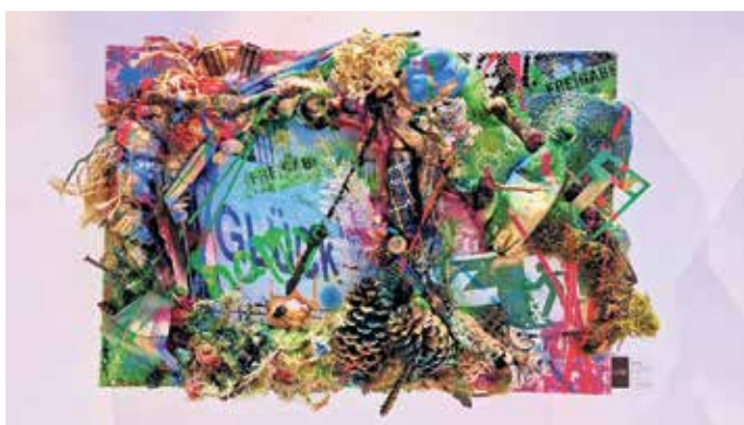
„Farb-Feuerwerke und visuelle Poesie, kurz: „environmental street art“

CHARITY-AKTION: Extra für das Elisabeth-Hospiz schafft Manuela Klein ein eigenes Werk, das meistbietend verkauft werden wird. Alles, was über 555 Euro hinaus geht, kommt dem Elisabeth-Hospiz zugute.