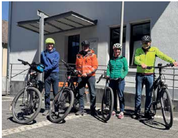
Start des Radwegechecks

bzw. Gefällstrecken auf. Der ADFC schlägt für die durch die Erosion ausgespülten Abschnitte eine Wasser gebundene Deckschicht vor. An den Gefällabschnitten lässt eine eingebaute leichte seitliche Neigung zur Talseite das Regenwasser unmittelbar abfließen, Ausspülungen längs des Weges (wie z. Zt.) würden vermieden. Eine solche nachhaltige Ertüchtigung macht Freizeit- und Alltagsradfahren sicherer und die Radrouten zwischen den Ortschaften attraktiver. Gut befahrbare Radwege animieren statt Auto das Rad als Verkehrsmittel zu wählen. Der ADFC will dazu weiter mit der Verwaltung der Stadt Lohmar und den Politikerinnen und Politikern im Gespräch bleiben.