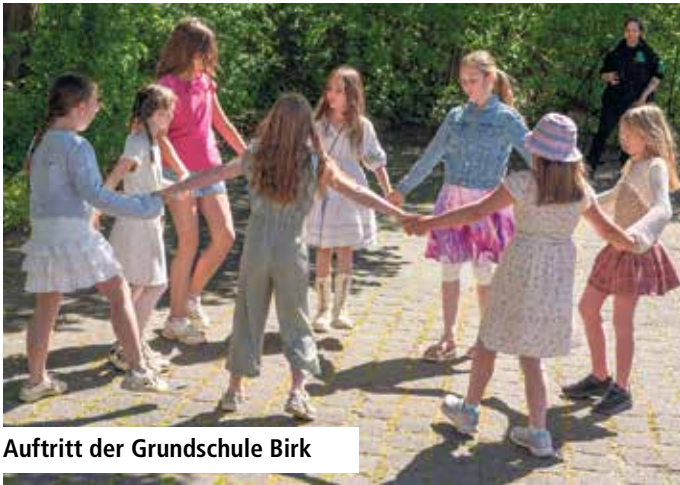
Auftritt der Grundschule Birk