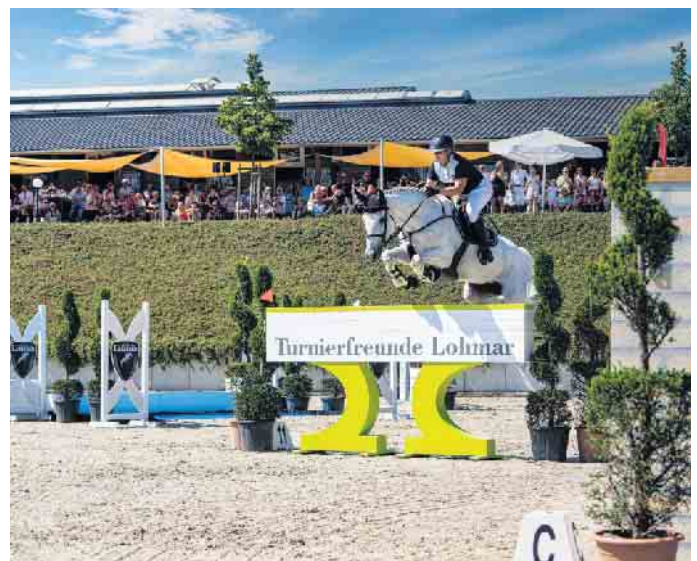
Das neue Hindernis der Turnierfreunde Lohmar