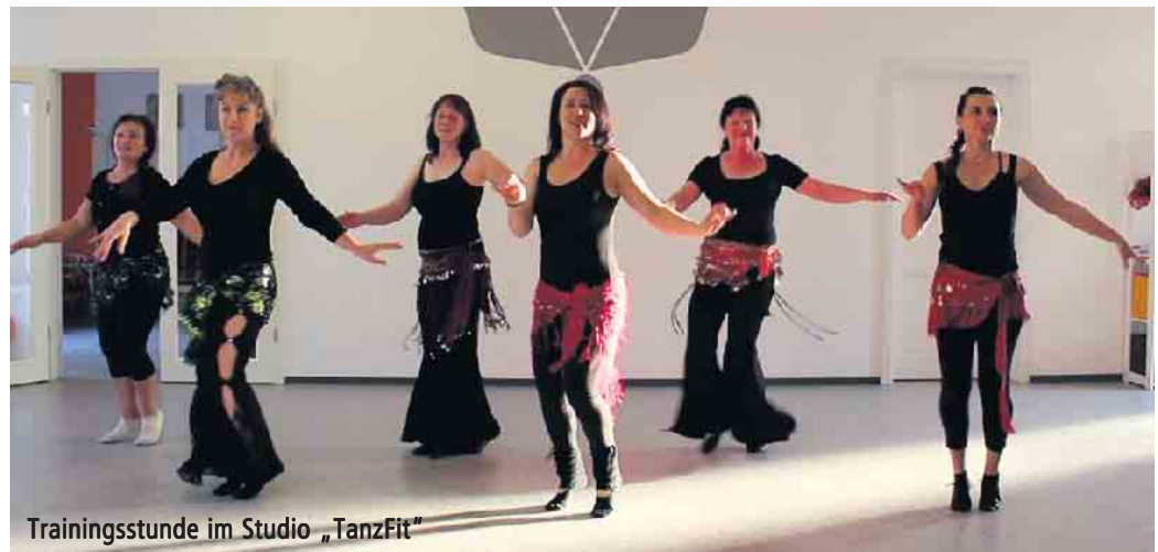
Trainingsstunde im Studio „TanzFit“

Trainingseinheiten (je 60 Minuten) und finden im Studio „Tanz-Fit“ Eitorf (Hospitalstraße 3)