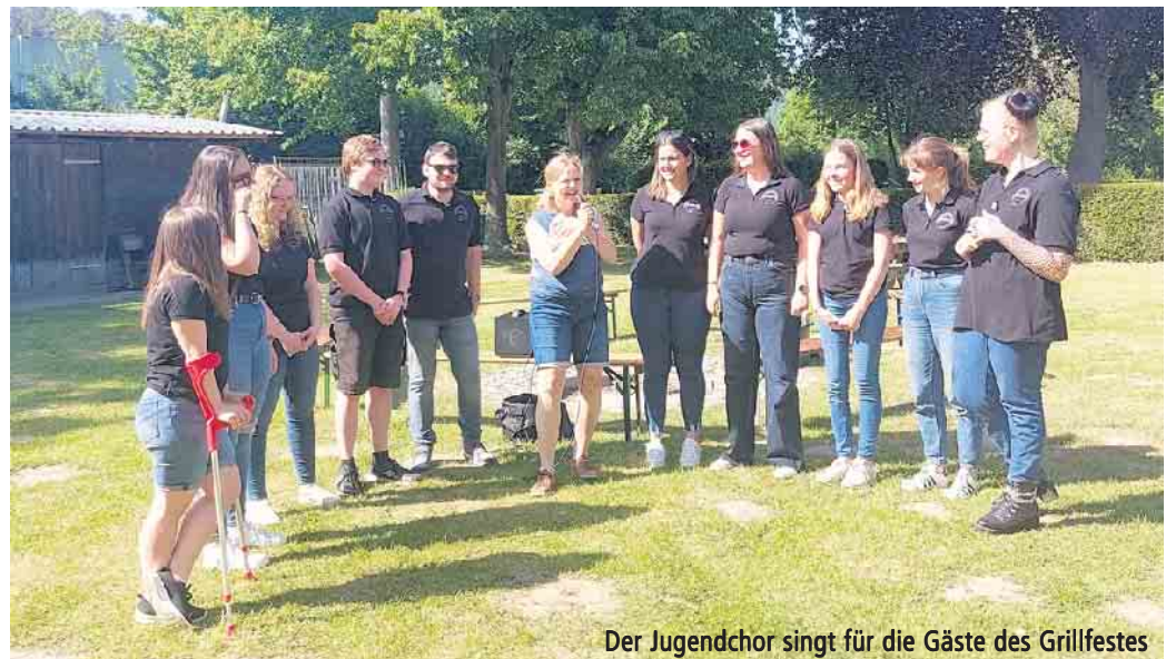
Der Jugendchor singt für die Gäste des Grillfestes