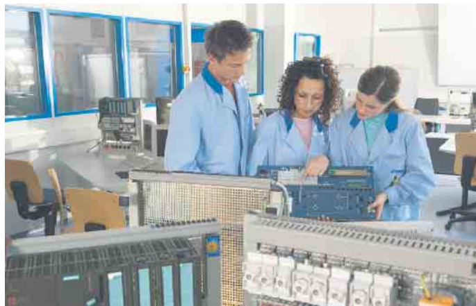
Während eines Praktikums gewinnt man Einblicke ins Berufsleben.

RAUTENBERG MEDIA KG Kasinostraße 28 -30 53840 Troisdorf www.rautenberg.media