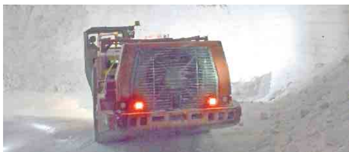
Im heimischen Kali- und Salzbergbau werden wichtige Rohstoffe gewonnen.

den. Unter www.vks-kalisalz.de erfährt man mehr dazu. Wer in der Branche eine Ausbildung absolviert, hat gute Chancen, nach bestandener Prüfung übernommen zu werden und einen zukunftssicheren Arbeitsplatz zu haben. (DJD)