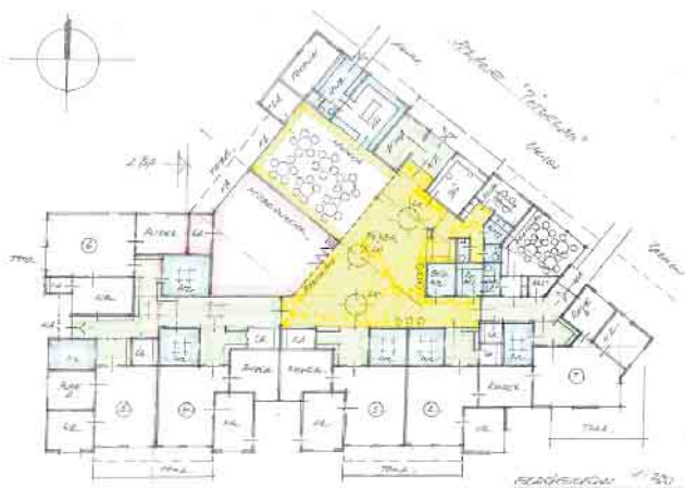
Visualisierung 1: Der Entwurf sieht eine eingeschossige Kita vor, inklusive des entsprechenden Außenbereichs, der notwendigen Stellplätze und der Erschließungsanlage.