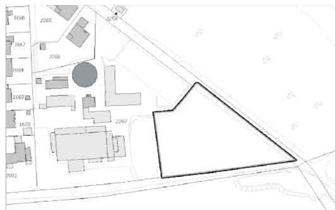
Visualisierung 2: Die direkte Lage am Wald ist für eine Kindertageseinrichtung - wie auch am jetzigen Standort der Waldgeister - optimal.

eine Artenschutzprüfung, ein Umweltprotokoll, eine Bodenuntersuchung sowie ein Bodengutachten vor. Die Stadtverwaltung hat bereits einen Aufstellungsbeschluss zur Änderung des Bebauungsplans gefasst, um die Fläche für die neue Kindertagesstätte auszuweisen. Die Öffentlichkeit wird frühzeitig über die Planung informiert.