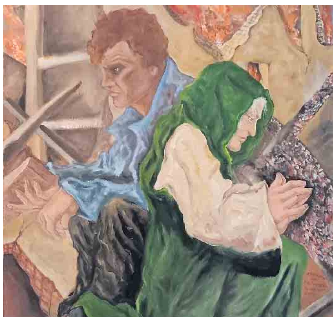
Das Bild trägt den Titel „Zwischen den Trümmern“.

hat sein Atelier in Honrath. Die Werke zeigen die dramatischen Ereignisse der auf der Welt geschehenen Kriege. Die öffentliche Vernissage ist am 8. November um 19:00 Uhr, Gäste sind herzlich willkommen.