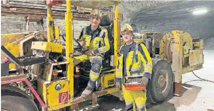
Die Bergleute arbeiten mit hochmoderner Ausrüstung und Technik.

Eine Ausbildung im Bergbau ist spannend und bietet sehr gute Berufsperspektiven