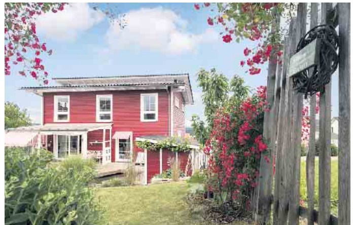
Wohlfühlwohnen gelingt in einem individuell geplanten Holz-Fertighaus sicher.

Die meisten Fertighäuser werden schlüsselfertig in Auftrag gegeben. Das heißt, die Baufamilie hat im Planungsprozess umso mehr Bau- und Ausstattungsentscheidungen zu treffen. Dafür erhält sie schon weit vor Baubeginn ein detailliertes Bild von ihrem individuellen Traumhaus, von außen und auch von innen. Die gesamte Arbeit übernimmt bei einer schlüsselfertigen Bauausführung der Haushersteller, die Baufamilie braucht nach der Bauabnahme nur noch einzuziehen. Das heißt, sie hat während der Bauphase alle Freiheiten, ihren Alltag wie gewohnt fortzuführen und zudem genügend Freizeit, den Umzug vorzubereiten. „Mit einem schlüsselfertigen Fertighaus kommt weniger Stress auf - und ist der Umzug erst einmal gemeistert, lässt es sich in einem regionaltypisch inspirierten Holz-Fertig-