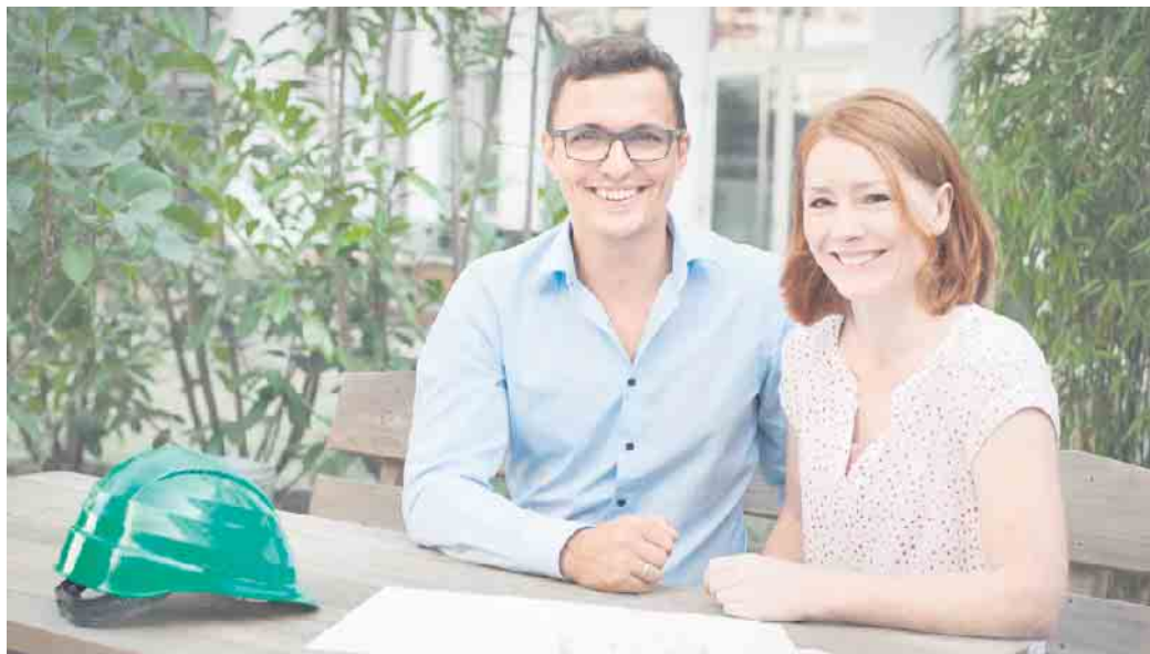
Sesshaft werden mit Ende 30: Immobilienkäufer werden immer jünger.