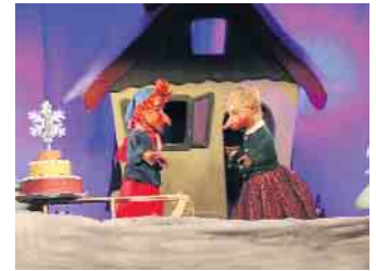
Das Winterwunder im Kindergarten Scheiderhöhe.

Gemeinsam wurde gesungen und geklatscht, bis der Schneemann zum Leben erwachte und Kasper und seine Tante Frieda tatsächlich zusammen mit den Kindern und den Erziehenden des Kindergartens Scheiderhöhe ihr Weihnachtswunder erlebten. Zurück blieben viele staunende Kinder die, wie der fünfjährige Felix, das Puppentheater „richtig cool“