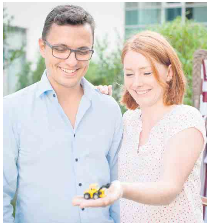
Für den Bau des eigenen Zuhauses kommt es auf eine solide Eigenkapitalbasis an.

Zinsänderungsrisiko ab. Denn wenn die Anschlussfinanzierung ansteht, ist dann schon ein relativ großer Anteil getilgt und der Folgekredit ist niedriger und günstiger.“ Wie genau die passende Lösung im Einzelfall aussieht, stelle sich immer im persönlichen Gespräch heraus. (djd)