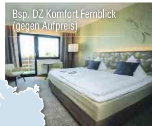
Bsp. DZ Komfort Fernblick (gegen Aufpreis)