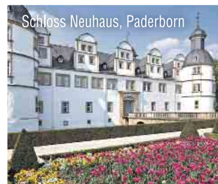
Schloss Neuhaus, Paderborn