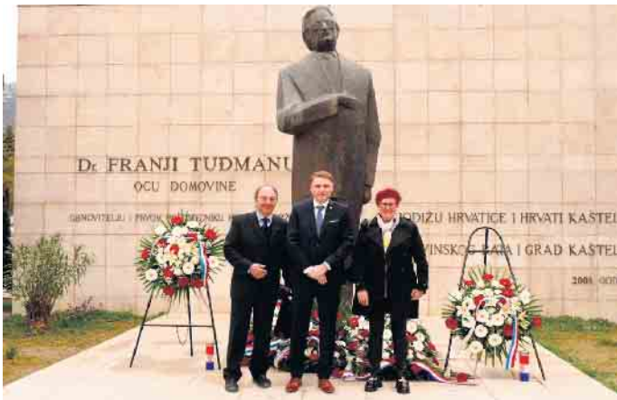
Die Lindlarer Delegation nach der Kranzniederlegung am Denkmal „Dr. Franji Tudman“

Im Rahmen der jährlichen Feierlichkeiten zum Städtetag von Kaštela wurde das 35. Jubiläum der Städtepartnerschaft gefeiert