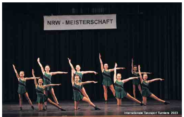
Juniorengruppe im Alter von 12 bis 15 Jahren

Insgesamt sind alle Tänzerinnen und Trainerinnen mehr als zufrieden und stolz über diesen