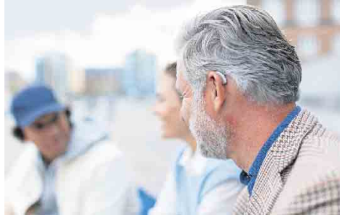
Wenn man Schwierigkeiten hat, einer Unterhaltung in geselliger Runde zu folgen, weist das auf Hörverlust hin.

Gutes Hören macht jugendlich Weit verbreitet ist zudem nach wie vor die Annahme, Hörsysteme ließen Menschen älter wirken - dabei ist das Gegenteil der Fall. Wer gut lauschen kann, ist entspannt und