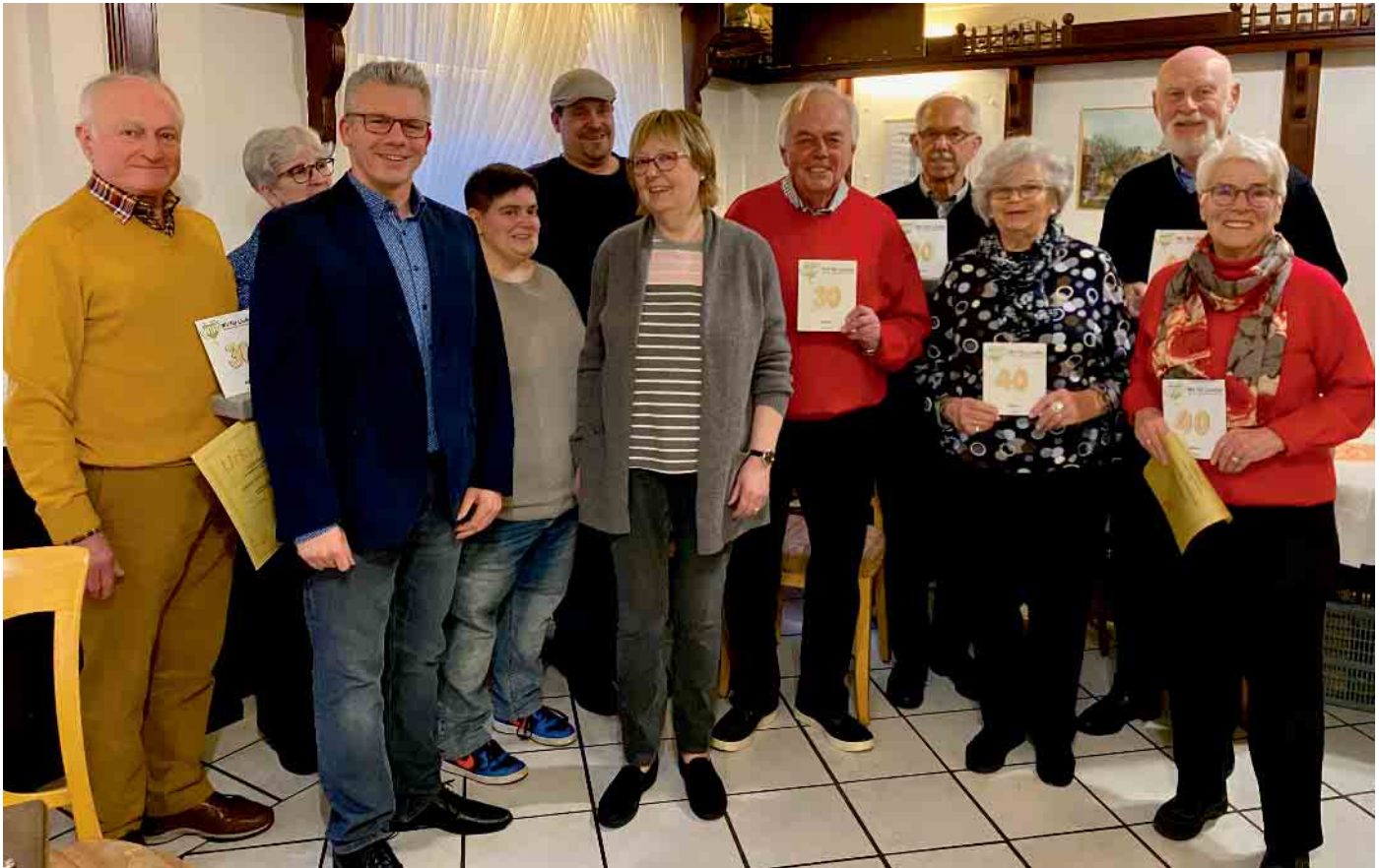
Langjähre Mitglieder werden vom Vorstand für Ihre Treue ausgezeichnet.

Vor Aufnahme der Aktivitäten im Frühjahr lud „Wir für Lindlar e.V.“ alle Mitglieder zu einem Empfang ein. Viele Vereinsmitglieder wurden für ihre langjährige Vereinszugehörigkeit ausgezeichnet.