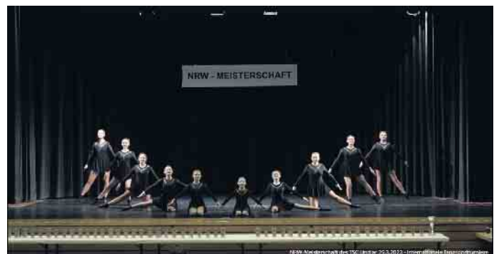
Seniorengruppe im Alter von 16 Jahren aufwärts

erfolgreichen Saisonauftakt. Jetzt heißt es: Motivation aufrechterhalten und fleißig weiter