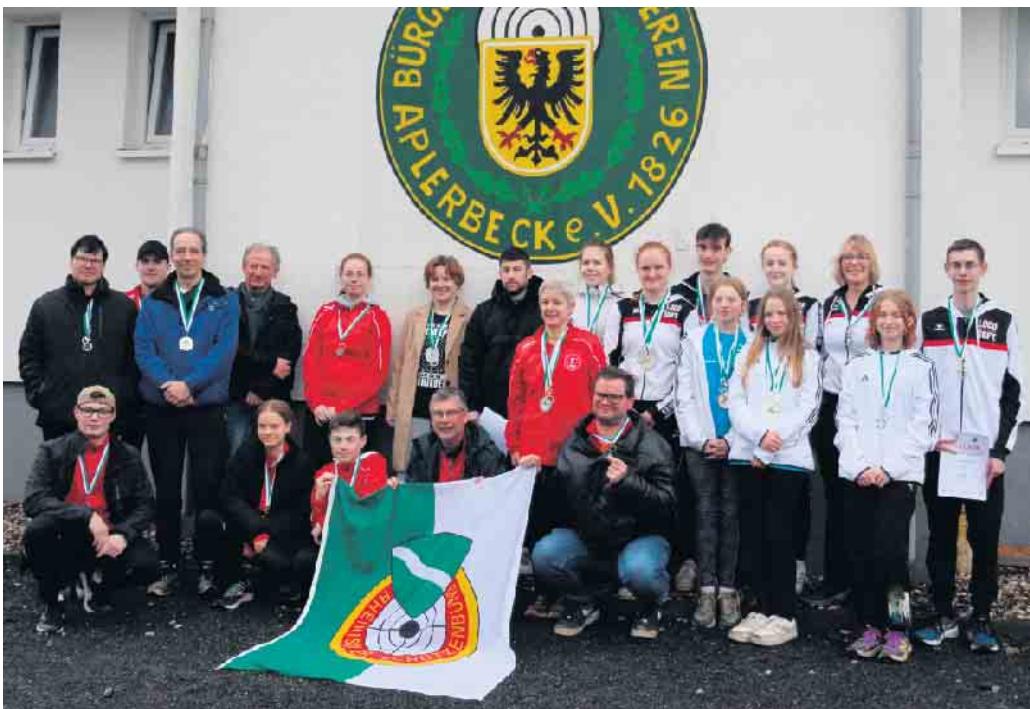
Das Rheinland-Team in Dortmund

Lindlarer Schützen erfolgreich im Rheinlandteam