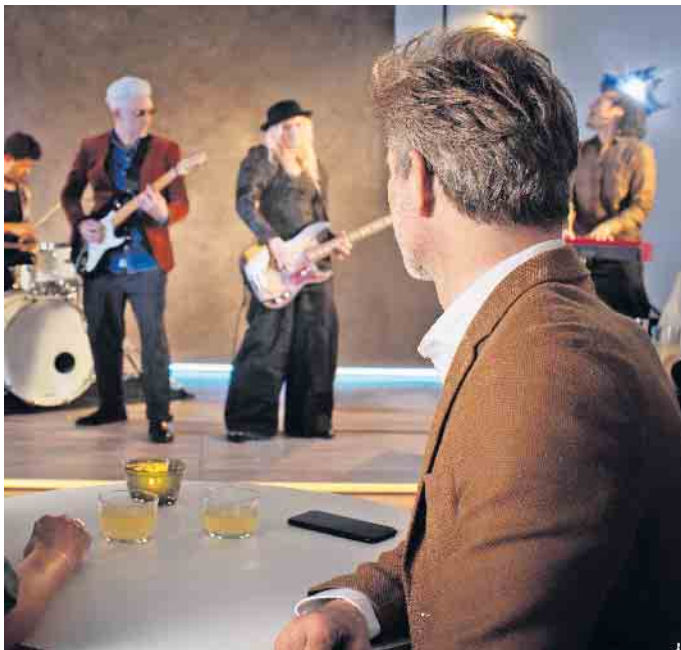
Um Musik richtig genießen zu können, ist ein feines Gehör eine wichtige Voraussetzung.

wirkt damit jünger als Menschen, die mit angestrenzter Miene immer wieder „Wie bitte?“ fragen müssen. Und falsch ist auch die Befürchtung, das Tragen eines Hörgeräts würde den Hörverlust verschlimmern. Vielmehr verhindert so ein System sogar, dass unser Gehirn die Verarbeitung bestimmter Frequenzen verlernt. Eine Möglichkeit, um diesen positiven Effekt noch zu fördern, ist etwa die von Oticon entwickelte BrainHearing-Technologie für Hörgeräte. Das mehrfach ausgezeichnete Hightech-System Oticon More kann Menschen mit Hörminderung wieder einen Zugang zur gesamten Klangumgebung ermöglichen. Das Gehirn erhält alle relevanten Töne - nicht nur Sprache - in optimierter Form.