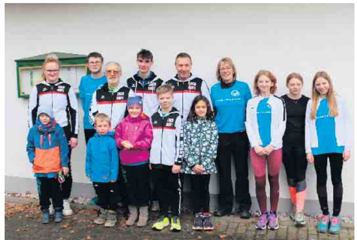
Das Lindlarer Team zum Saisonauftakt