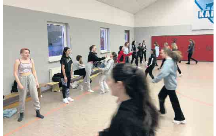
Teilnehmerinnen erhalten Einblick in Selbstverteidigung