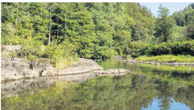
Untere Wupper nahe Solingen-Burg

Der Wupperverband hat auf seiner Internetseite Infos und Filmclips rund um die Wupper und ihre Geschichte, aber auch zur Bewirtschaftung des Flussgebietes zusammengestellt.