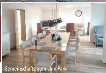
Gemeinschaftsraum „Am Park“