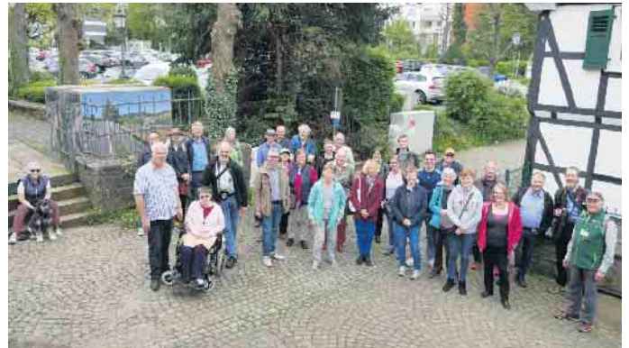
Die englisch-deutsche Gruppe bei ihrer Führung durch die Gemeinde Lindlar.