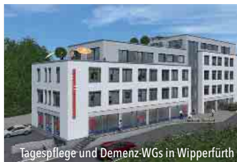
Tagespflege und Demenz-WGs in Wipperfürth