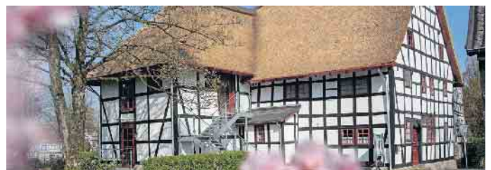
Das mehr als 400 Jahre alte „Weissen Pferdchen“ in Hohkeppel

Tag der offenen Tür in der historischen Herberge im „Weissen Pferdchen“