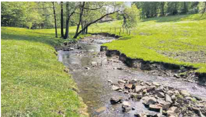
Am Oberlauf: die Wipper in Schmitzwipper / Gemeinde Marienheide

Wupper regeneriert sich vom Abwasserfluss zum Lebensraum