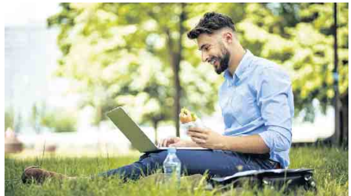
Bei jüngeren Mitarbeitern mit hoher digitaler Affinität hat vor allem das mobile Arbeiten stark an Beliebtheit gewonnen.