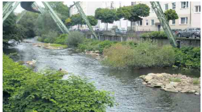
Urban geprägte Wupper mit naturnaher Gestaltung in Wuppertal, Bereich Pfälzer Steg

Das Umweltbundesamt (UBA) hat den Mittelgebirgsfluss zum Gewässertyp des Jahres 2023 gekürt. Typisch für den Mittelgebirgsfluss ist laut UBA seine hohe Abflussdynamik, der Fluss bewegt Steine und Kies und bildet Inseln und Nebengerinne aus. Dadurch ist er ursprünglich Lebensraum für viele Tier- und Pflanzenarten.