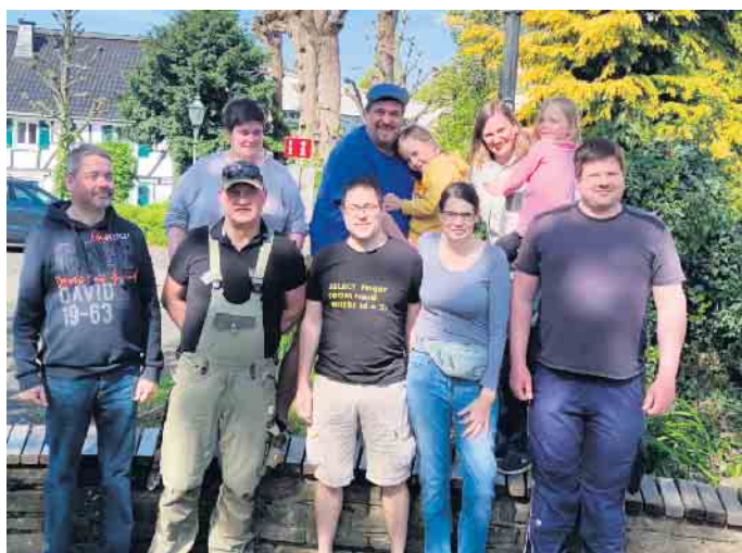
Aktive von Wir für Lindlar e. V. trafen sich zur ersten Verschönerungsaktion im Jahr.

Nach längerer Regenphase startet Wir für Lindlar e. V. mit Aufräumaktion endlich in die Verschönerungs-saison. Große Müllsammelaktion soll am 3. Juni stattfinden.