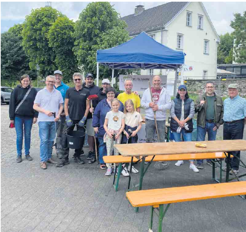
Gemeinsam startete eine Gruppe aus Vereinsaktiven und Bürgerinnen und Bürgern am 17. Mai zum Lindlarer Dorfputz.

Aus dem traditionellen „Frühjahrsputz“ wurde der „Lindlarer Dorfputz“ mit vielen Aktionen von Wir für Lindlar e. V. zur Dorfverschönerung mit großer Resonanz aus der Bevölkerung