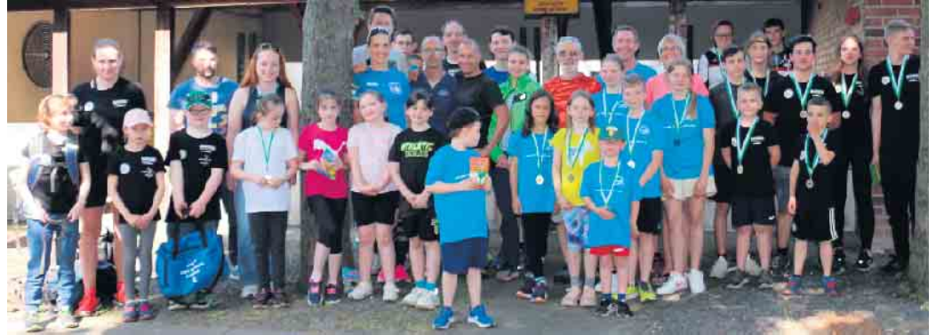
Lindlar im Reigen der Rheinlandathleten

Zum dritten Lauf des Rheinlandcups führte es die Sommerbiathleten des Schützenverein Lindlar nach Heimerzheim in der Nähe von Weilerswist.