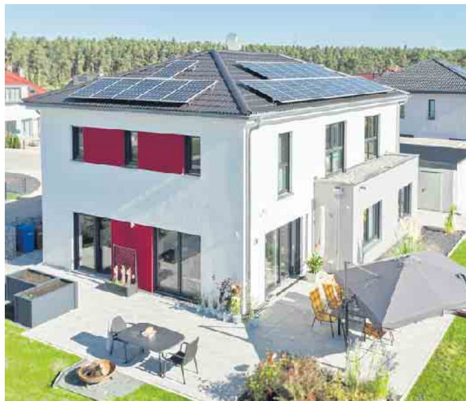
Beim Fertighausbau wird der Grundriss so wie das gesamte Haus individuell auf die Baufamilie zugeschnitten.

Fast immer den meisten Platz nimmt der Koch-, Ess- und Wohnbereich ein. Dieser wird gerne offen gestaltet, meist auf etwa 50 Quadratmetern im Erdgeschoss. Wer sich für eine Kücheninsel entscheidet, braucht für den Kochbereich etwas mehr Platz. Wer im Wohnzimmer nur eine kleine Couch-Ecke benötigt, kann hier Platz sparen, um das Esszimmer auf Wunsch zur geräumigen Kommunikationszentrale des Hauses werden zu lassen. In einem klassischen Schlafzimmer sind gut zwölf Quadratmeter und eine freie, raumhohe Wand mit über drei Metern Länge für den Kleiderschrank sinnvoll. In vielen modernen Grundrissen aber gibt es einen begehbaren Kleiderschrank oder gar ein separates Ankleidezimmer. Im Kinderzimmer dürfen es ruhig auch 15 Quadratmeter und mehr zum Schlafen, Spielen und Lernen sein, während ein geräumiges Familien-Badezimmer auf zehn Quadratmeter passt, jedoch eher kein Wellness-Tempel mit freistehender Badewanne, Regendusche und Sauna. Nicht zu vergessen sind Flure und der Treppenbereich sowie Abstellmöglichkeiten