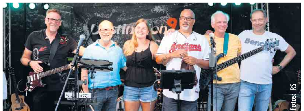
Am Samstag, 10. Juni, spielte die Lindlarer Rock-Cover-Band „Destination9“ live im Rahmen des traditionellen Bacchusfestes in Lindlar. Hier einige Impressionen vom Abend.