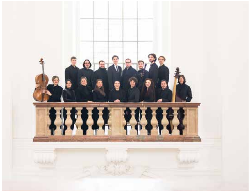
Das Vokalensemble BachWerkVokal.