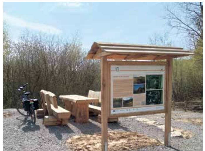
Die Sitzgelegenheit neben der Infotafel lädt zum Picknick ein.