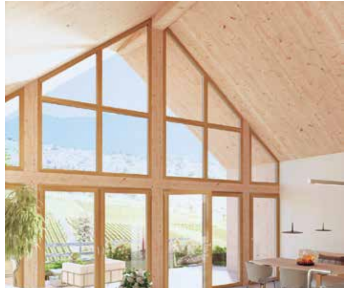
Bei großen Fensterfronten ist der Energiespar-Effekt von gut gedämmten Fenstern besonders groß.

Besonders Fenster mit Einfachverglasung, die bis Ende der 1970er Jahre eingebaut wurden, bieten sich für einen Tausch an. Im Gegensatz zu modernen Zwei- oder Dreifachverglasungen bieten sie keinerlei Wärmedämmung. Aber auch ältere Isolierverglasfenster (vor 1995, also noch ohne Wärmeschutzbeschichtung) lassen noch immer viel Wärme entweichen. Auch sie sind gute Kandidaten für eine Sanierung. „Wer noch einen dieser Fenstertypen verbaut hat, sollte unbedingt über eine Modernisierung nachdenken. Das gilt insbesondere, weil die Bundesregierung bei Einzelmaßnahmen wie der Fenster-Sanierung mit der BEG-Förderung weiterhin bis zu 20 Prozent der Investitionskosten übernimmt.“, rät Frank Lange, VFF-Geschäftsführer. Alternativ kann im selbstgenutzten Wohnraum im Rahmen der Einkommensteuer 20 Prozent der Sanierungskosten direkt mit der Steuerschuld verrechnet werden. Vor der Sanierung sollten sich Interessenten sowohl von einem Fachhändler als auch einem Steuerberater beraten lassen oder den VFF-Fördermittel-Assistenten nutzen. Umfangreiche Information zur Energieeffizienz und Wirtschaftlichkeit neuer Fenster hat der VFF in seiner aktuellen Studie „Im neuen Licht: Energetische Modernisierung