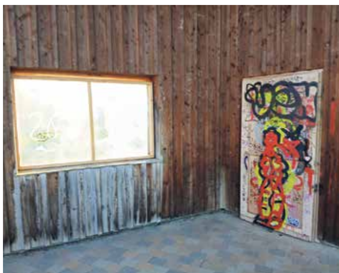
Heute bietet sich dieser Anblick - eine Schande!