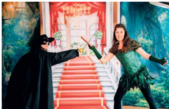
Der Graf mit der Zaubergefee Bella.

Die Kinderoper unter dem Titel "Bella und das Orchester" ist für Grundschulkindern kostenlos. Ansonsten gibt es Karten für acht Euro: KulturGut Holzhausen, Gutshof 1, 33039 Nieheim, Tel.: 05274/952094. oder Tel.: 0177 2108040 und in der Grundschule Nieheim, E-Mail: info@voices-holzhausen.de, im Netz: www.voices-holzhausen.de