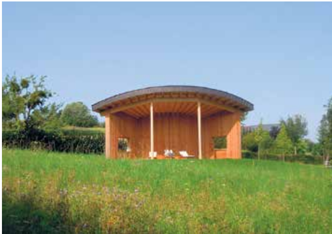
Das Foto zeigt die Liegehalle im Ursprungszustand vor mehr als 10 Jahren.

Besonders betroffen ist die "Liegehalle" - Wer macht so etwas?