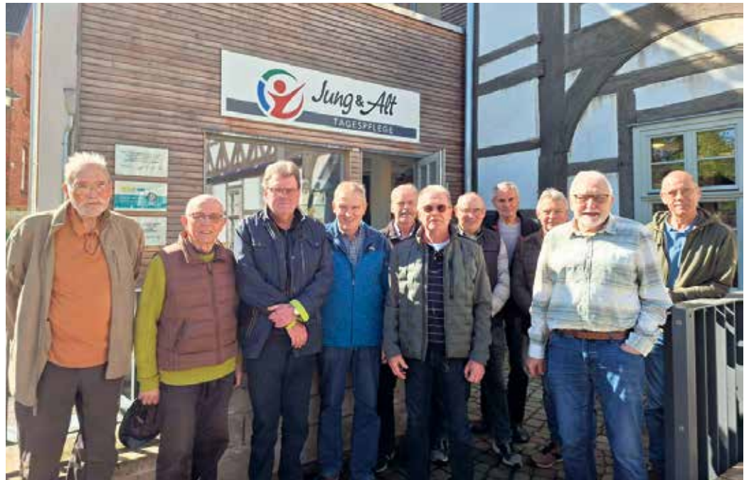
Die „Rentner“ des Männergesangsvereins Kollerbeck zu Besuch in der Tagespflege.

Ein zufriedenes Lächeln bei den Gästinnen und Gästen sowie dem Team der Tagespflege ist die schönste Belohnung für alle Sänger. Im nächsten Jahr kommen wir gerne wieder!