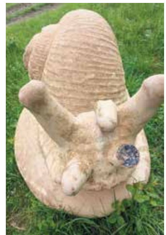
Auch die Tierskulpturen außerhalb des Parks wurden beschädigt