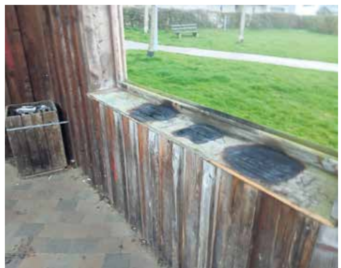
Wenn Grillen ausartet! Alkoholkonsum, Frustrationstendenzen und Gruppeneffekte sind Ursachen von Vandalismus.