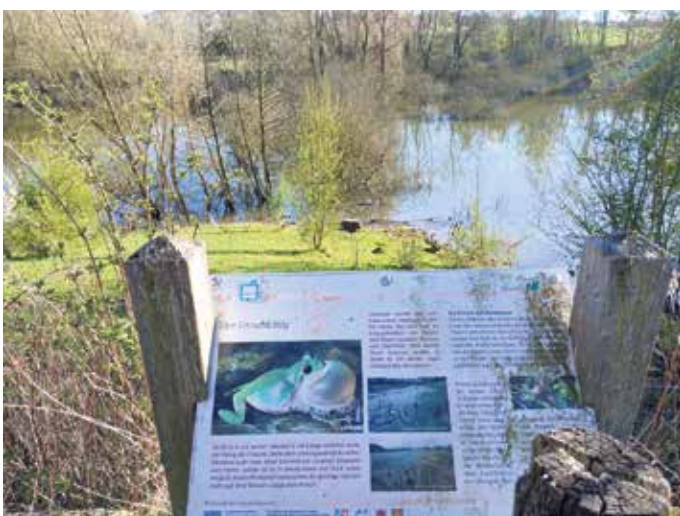
Aussichplattform von wo aus die Wasserbüffel beobachtet werden können.