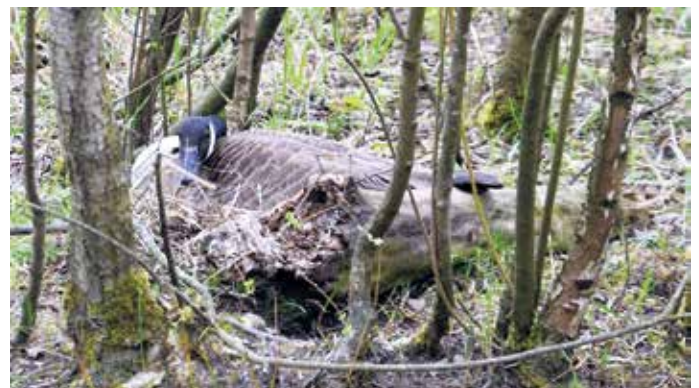
Gut getarnt eine Kanadagans auf ihrem Gelege direkt am Wildnis- und Erlebnispfad

anstimmen. Ein kurzer Rundweg gewährt zudem Einblicke in einen sprichwörtlich "verwunschenen" Weidenwald.