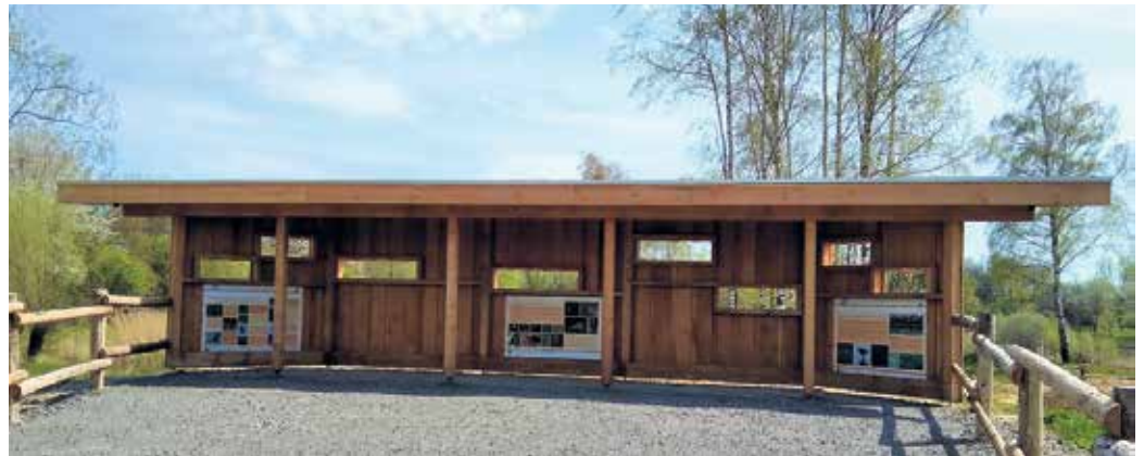
Von einer weiteren Beobachtungsplattform lassen sich zahlreiche Wasservögel beobachten

Die beiden Tongruben am Ortsrand von Nieheim waren schon während des aktiven Abbaus Lebensraum für seltene Tierarten, die sich in den zahlreichen Tümpeln und Teichen wohlfühlt haben. Nach Einstellung des Tonabbaus schien das Schicksal der Gruben als Lebensraum für viele Tiere und Pflanzen zunächst besiegelt. Sie sollten zukünftig als Sondermülldeponie dienen. Es ist dem entschiedenen Widerstand der Bevölkerung zu verdanken, dass diese Planungen aufgegeben wurden. Im westlich gelegenen Teil (früher Grube Ziegelei Rath) helfen die Wasserbüffel, den Gehölzwuchs