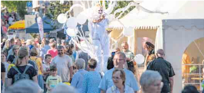
Ein buntes Glasstadtfest erwartet die Besucher am 20. & 21.09.2025 in Bad Driburg.

Für jeden etwas - ein Tag der Wissenschaft mit Solarboot-Rennen und einer Bewegten Meile, ein bunter Glasstadtmarkt mit Unterhaltungsprogramm sowie ein verkaufsoffener Sonntag