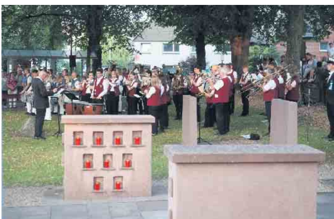
Einen Augenblick des Innehaltens bot der vom Musikverein Bredenborn gespielte Große Zapfenstreich.