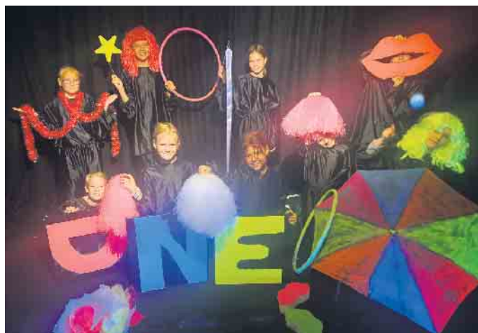
Eine ganz besondere Erfahrung im Kinderferienspaß - Schwarzlichttheater!