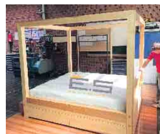
MEISTERSTÜCK - traumschönes Himmelbett mit Staufunktionen.