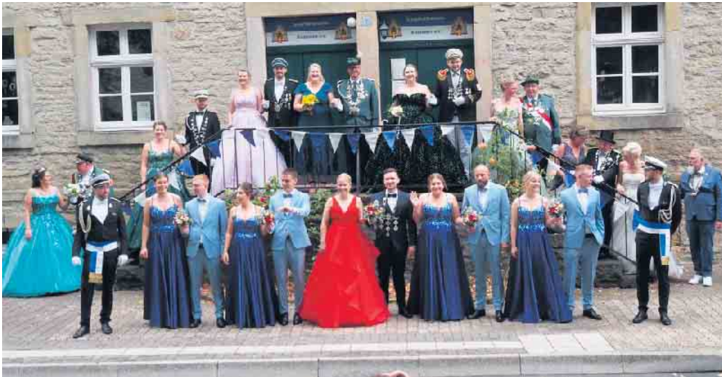
Royalen Glanz verbreiteten die bei der Königsparade auf der hohen Treppe Aufstellung nehmenden neun Königspaare.

Der Jungschützenverein Bredenborn begeisterte im einhundertsten Jubiläumsjahr mit einem großartig vorbereiteten Schützenfest.