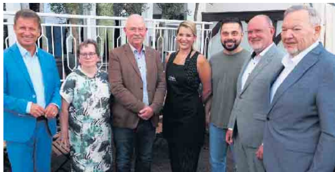
Das Gruppenfoto mit den Vereins- und Verbandsvorstehern sowie den Ehrengästen entstand im abendlichen Biergarten des „Dakos.“

Der Wirteverein Bad Driburg-Steinheim-Warburg feierte beim „Nieheimer Griechen“ ein leckeres Sommerfest