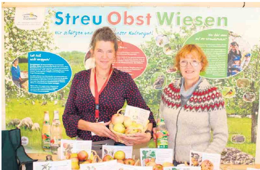
Informationen und Kostproben alter Apfelsorten gibt es am Stand der regionalen Obstexpertinnen.

Für Sonntag, den 14. September haben sich wieder weit über 90 Marktteilnehmer angemeldet. Sie freuen sich darauf ihre Handwerkskunst vorzuführen und ihre Produkte aus eigenem Anbau oder Herstellung anbieten zu können. So wird für jeden was dabei sein, ob er nun nach Holzkunst, Honig, Wildbratwurst oder einer Bürste sucht, neue Hanfprodukte kennenlernen möchte, einen Schal oder ein schönes Dekoelement braucht oder ganz einfach sein Kräuter- und Essigreservoir auffüllen möchte. Das Orgateam freut sich in diesem Jahr die Solidarische Landwirtschaft ( SoLaWi ) aus Dalborn begrüßen zu dürfen, die ihr Konzept an einem Infostand vorstellt. Es gibt auch in Steinheim eine Abholstation für die Gemüseboxen. Die Forellenzucht Springborn ist das erste Mal dabei und wird bei gutem Wetter frisch vor Ort räuchern. Zum ersten Mal wird die Bäckerei Mellies aus Bad Meinberg im Holzbackofen vor Ort frisches Brot backen und Kuchen und andere Leckereien anbieten. Den ganzen Tag kann man sich mit leckerem Kuchen, handgemach-