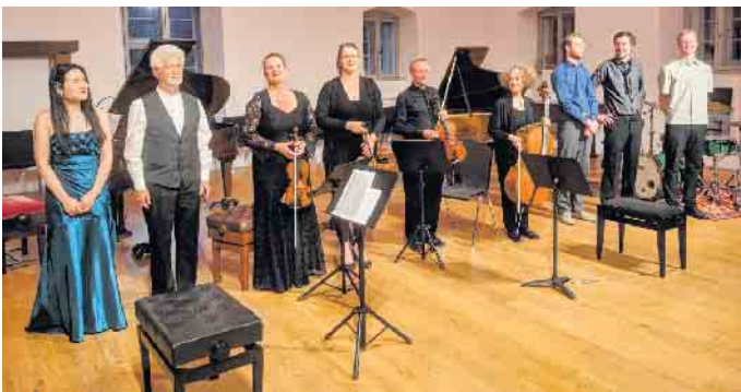
Die Mitwirkenden des besonderen Konzertabends mit Werken von Otto Martin.

Projekt der Klosterlandschaft OWL bringt ein vergessenes Streichquartett des jüdischen Komponisten Otto Martin zurück ins Licht. Premierenumfeld ist begeistert.