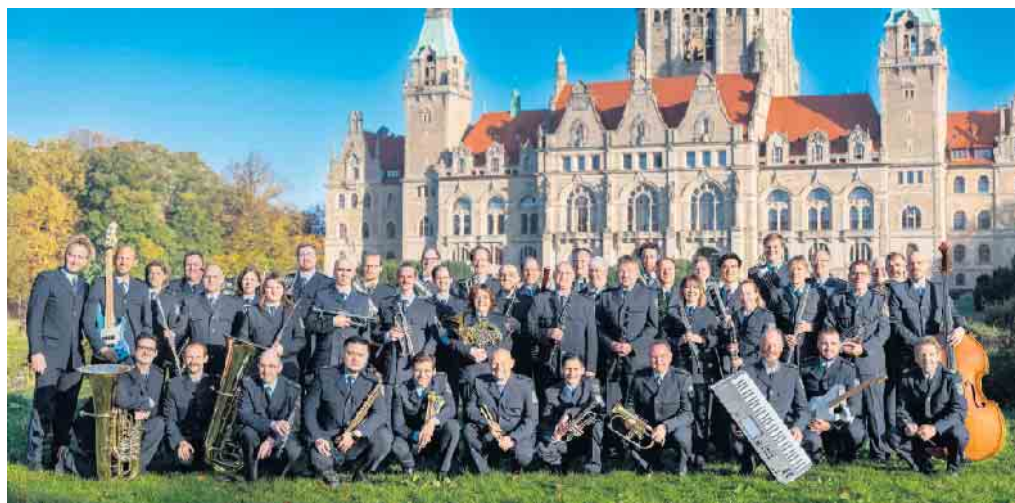
Bundespolizei-Orchester Hannover

Stiftung für Natur • Heimat • Kultur im Steinheimer Becken (: 0 151 / 52 13 04 76