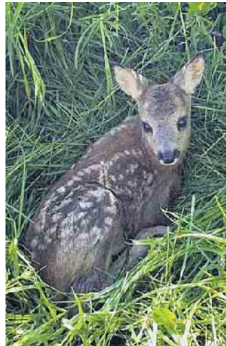
Gut versteckt: Ein kleines Kitz kauert sich tief ins Gras und ist damit vor dem Mähen schlecht zu sehen. Damit hat die Drohne kein Problem.

diesem Frühjahr und Sommer konnten 34 Rehkitze gerettet werden, und auf insgesamt 310 Hektar wurde abgeflogen. Das Team besteht aus rund 60 Helfern, darunter sieben ausgebildete Piloten. Die Einsatzzeit von April bis Juni hat gezeigt, dass die Drohnentechnik Zeit spart, gezielter arbeitet und das Tierwohl deutlich erhöht. Der Plan dahinter ist einfach, aber wirksam: Frühe Warnsignale erkennen, Kitze sicher lokalisieren, sie in stabile Boxen geben und erst wieder freigeben, wenn die Mahd durch ist. Muttertiere sind oft in der Nähe - Respekt vor der Natur ist hier selbstverständlich Teil des Vorgehens. Die Einsätze finden früh morgens statt, wenn der Boden noch kühl ist und die Kitze leicht