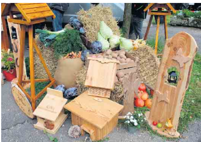
Hübsche Arrangements von Kunsthandwerk und Naturprodukten sind auf dem Bauernmarkt immer ein Hingucker und Publikumsmagnet.

meinsam mit dem Heimatverein Ottenhausen und der Kolpingfamilie Ottenhausen wurden von 2004 bis 2014 durch verschiedene Wechsellausstellungen und Schwerpunkte am Markt konzept gearbeitet. Was dazu führte, dass der Markt sich zu einem der größten und schönsten in der Region entwickelt hat.