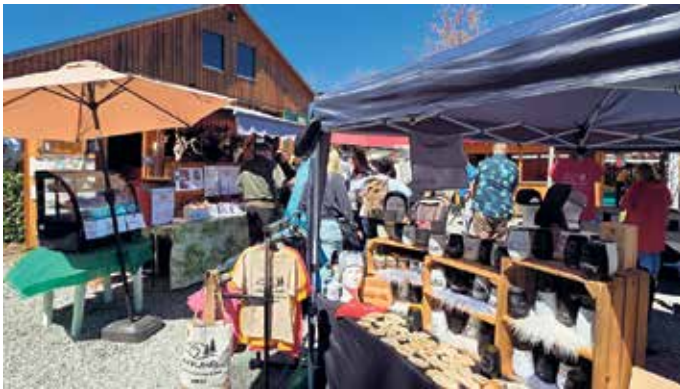
Regionalmarkt in Hallenberg

Besser hätte der Start in die neue Regionalmarkt-Saison 2026 kaum ausfallen können. Bei strahlendem Sonnenschein und unter einem leuchtend blauen Himmel lockte der erste Hallenberger Regionalmarkt des Jahres zahlreiche Besucherinnen und Besucher an die Oldtimerhalle.