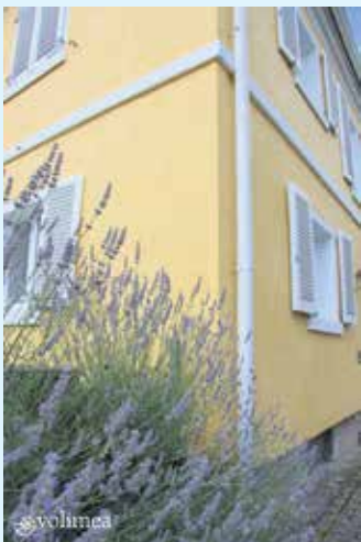
Helle Fassadenfarbe von Volimea für ein Privathaus