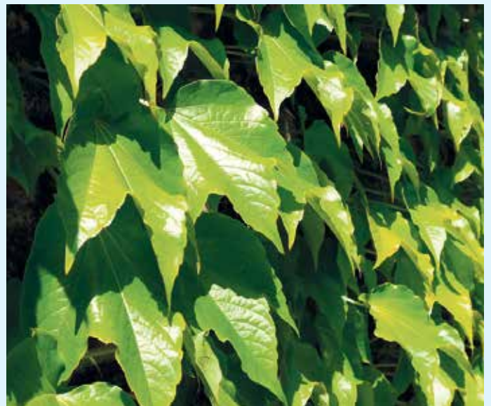
Die klassische Art der Fassadenbegrünung: Wilder Wein wächst an einer Hauswand.

Welche Programme für eine konkrete Immobilie infrage kommen, zeigt der kostenlose VFF-Fördermittel-Assistent schnell und zuverlässig. Ergänzend bietet eine separate Herstellersuche die Möglichkeit, gezielt Fachbetriebe im eigenen Umkreis zu finden. Verband Fenster + Fassade e.V. (VFF)