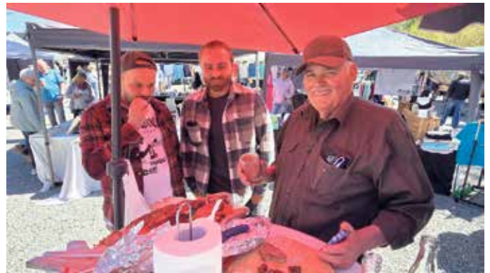
Burkhards Wildküche auf dem Regionalmarkt in Hallenberg

Doch nicht nur Feinschmecker kamen auf ihre Kosten. Zahlreiche Kunsthandwerker präsentierten ihre liebevoll gefertigten Produkte. Von