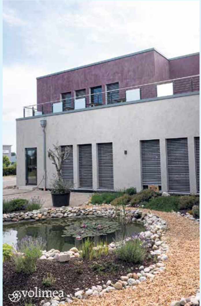
Wandbeschichtung Fassade Firmengebäude mit Fassadenfarbe von Volimea

Lassen Sie sich vom Malerbetrieb Schnorbus auch für außergewöhnliche Looks inspirieren und beraten. [BL]