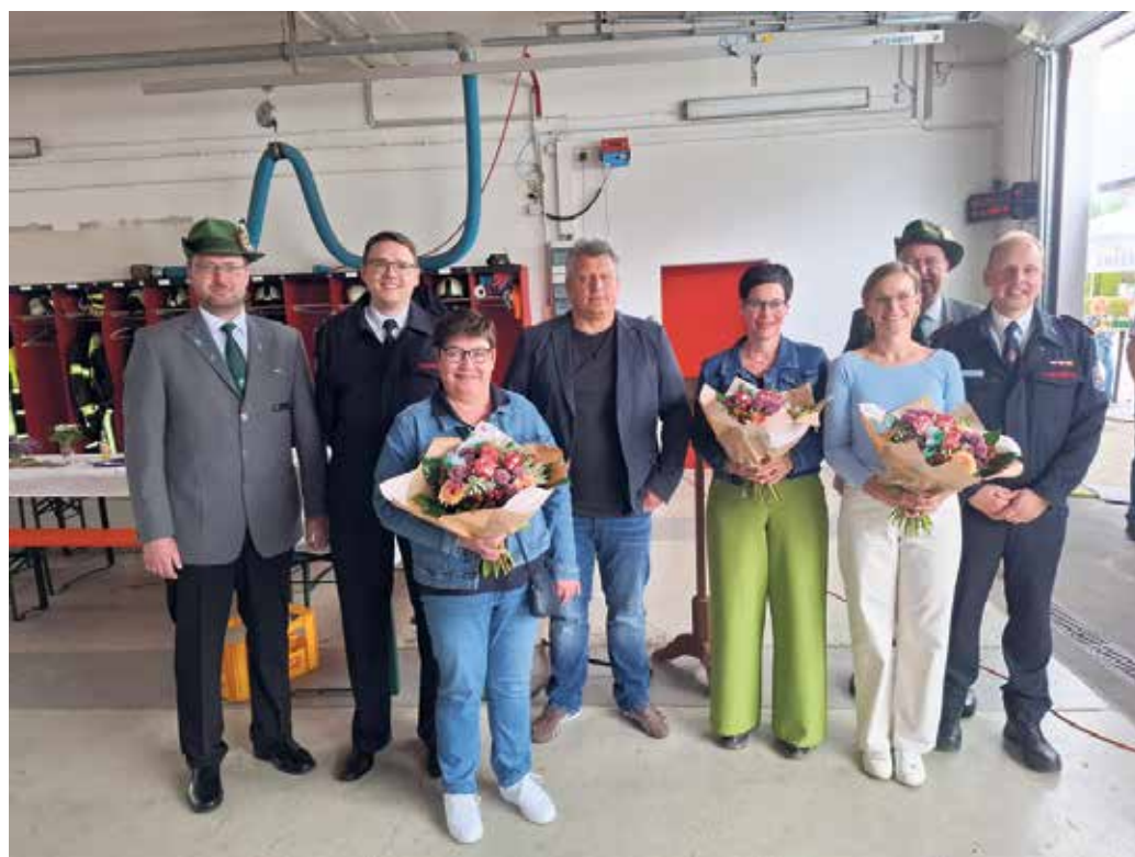
Kinderschützenkönig 2026."