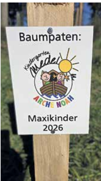
Hinweisschild der Baumpaten in der Medeloner „NaturWerkStatt“

Medelon. Die Maxikinder im Kindergarten Arche Noah bereiten sich mit besonderen Projekten