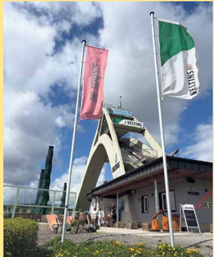
Terrasse für Sonnenanbeter am Schneewittchen-Haus

kontakt@die-schanze.de Schneewittchen-Haus Am Waltenberg 119 59955 Winterberg Tel.: +49 (0) 2981 425 9020 kontakt@schneewittchenhaus.de