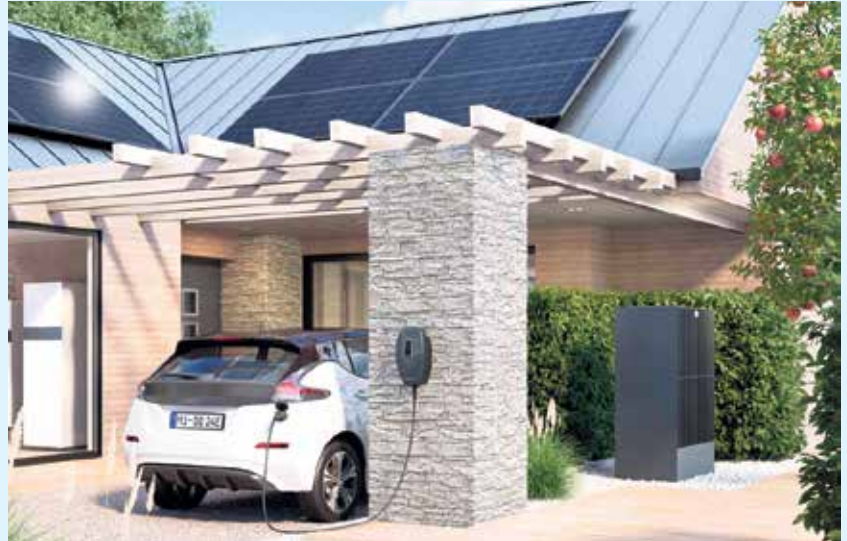
Wärmepumpe in Kombination mit Solar mit Wallbox für Alt- und Neubau

Die Wärmepumpen Vitocal 250-A und Vitocal 252-A sind hocheffizient und erzeugen Wärme besonders klimaschonend. Deshalb wird ihr Einsatz bei der Modernisierung vom Bund besonders attraktiv gefördert. Auf Wunsch prüfen wir mit dem Viessmann FörderProfi in einem ers-