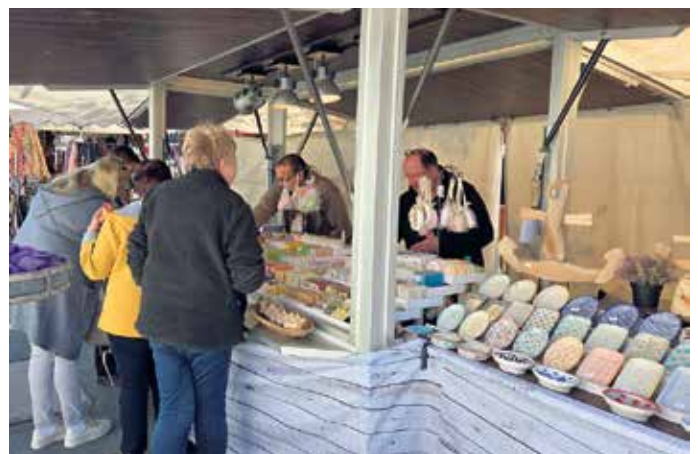
Regionalmarkt in Hallenberg

stilvollem Schmuck über dekorative Wohnaccessoires bis hin zu Artikeln, die die Verbundenheit zum Sauer-