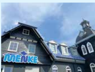
Der Meisterbetrieb Menke in Winterberg-Siedlinghausen

Für Kostenersparnis beim Heizungstausch mit einer der neuen Wärmepumpen sorgt auch deren patentierte Hydraulik Hydro Auto-Control. Sie passt sich an nahezu alle vorhandenen Heizungssysteme bei der Modernisierung an und reduziert gegenüber herkömmlichen Wärmepumpen die Installationszeit erheblich. Außerdem ist durch die Hydraulik der Platzbedarf der Anlage um fast zwei Drittel geringer.