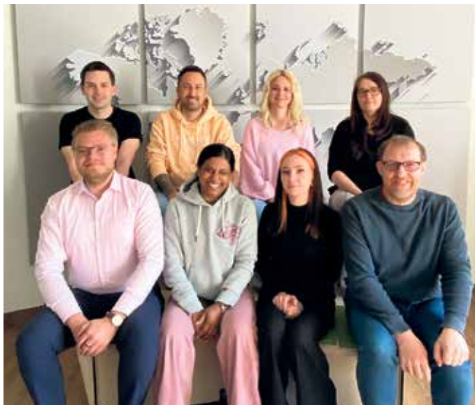
Gemeinsam für das Wohl von Kindern: Das Team der Beistandschaften im HSK-Jugendamt.

Hochsauerlandkreis. Die Beistandschaft ist ein Angebot des Kreisjugendamtes und unterstützt Eltern dabei, die Rechte ihrer Kinder zu sichern und rechtliche Angelegenheiten zuverlässig zu regeln. Das Angebot richtet sich an alle Eltern, insbesondere an alleinerziehende Elternteile und ist freiwillig sowie kostenfrei.