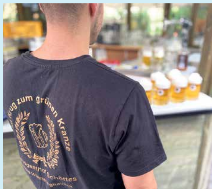
Reichlich „kühles Blondes“ im Biergarten des Gasthof Schöttes