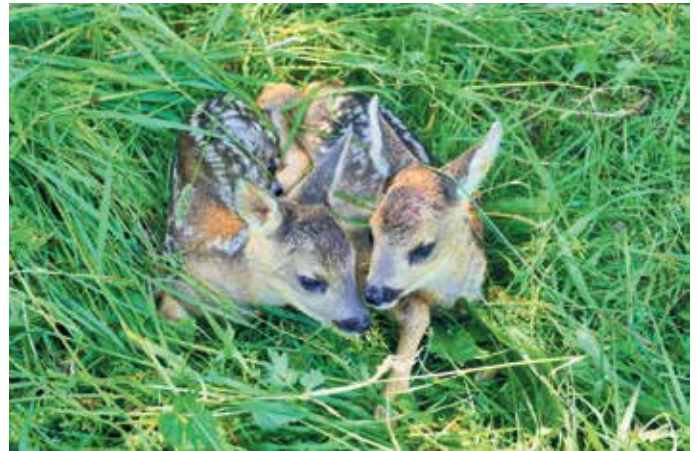
(Archivfoto aus Juni 2023)