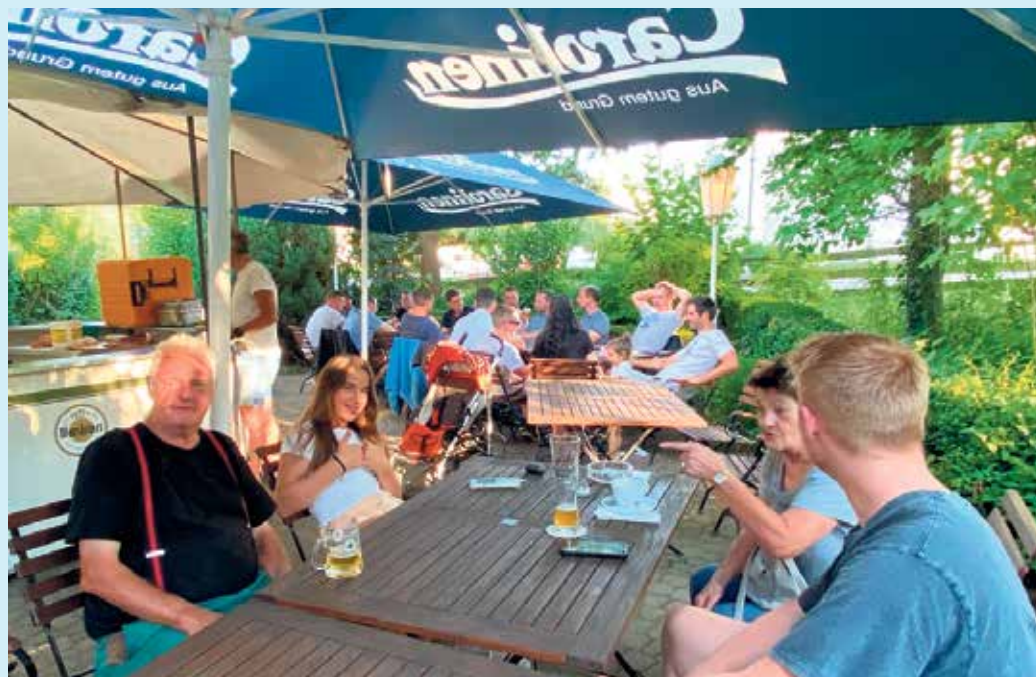
Beliebt bei allen Generationen: der gemütliche Biergarten des Gasthof Schöttes

Feine, gutbürgerliche Küche mit urig-gemütlichem und liebevollem Ambiente.- Das bietet der Gasthof Schöttes in Wiemeringhausen. Im traditionellen "Gasthof der Chöre" kommt immer gute Stimmung auf. Jeden Montagabend ab 19.00 Uhr wird im Saal noch kraftvoll ge-