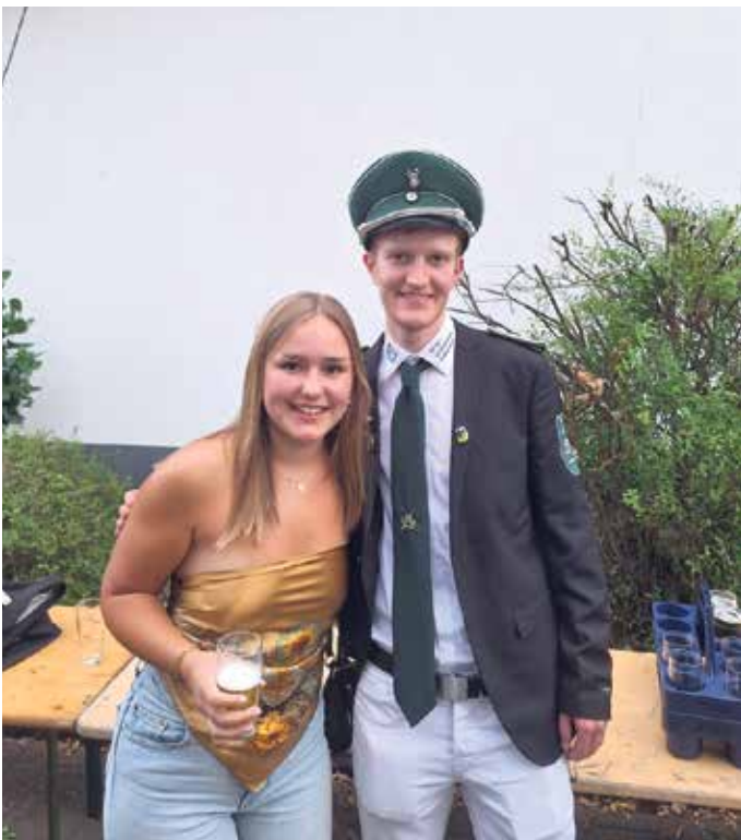
Jungschützenkönigspaar Düdinghausen 2025-2026

Der erste Tag des Hochfestes am Freitag, 17. Juli, gehört wie gewohnt der Jugend und hat mit dem Jungschützenschießen am Freitagabend seinen ersten Höhepunkt.