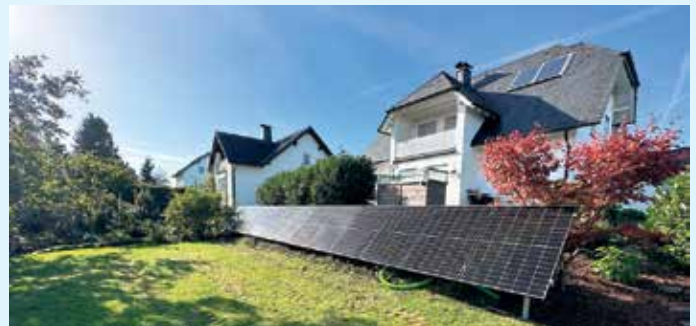
Eine Photovoltaikanlage muss nicht zwingend auf einem Dach montiert werden.