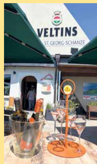
Zeit für kühle Drinks an der Schanze