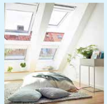
Glas schafft Licht, Raumbeziehungen und visuelle Offenheit.

Der Trend bei Glaselementen geht über reine Effizienz hinaus zu einer ganzheitlichen Betrachtung ihres Lebenszyklus: Wie wirkt ein Bauteil über Jahrzehnte? Wie lassen sie sich Ressourcen schonend wiederverwenden oder recyceln? Hochwertige Verglasungen punkten mit Energiekennwerten und Langlebigkeit, mit Reparaturfähigkeit sowie Recycling. Der Bundesverband Flachglas fördert diese Entwicklung gemeinsam mit der Gütegemeinschaft Flachglas, indem sie Verglasungen mit klar definierten Qualitäts- und Prüfstandards auszeichnen und so eine verlässliche Basis für nachhaltiges Bauen schaffen. Die Zukunft von Verglasungen zeigt sich im Zusammenspiel von technischer Leistungsfähigkeit, gestalterischer Vielfalt und nachhaltiger Verantwortung. Für Bauherren, Planer und Architekten ist Glas ein Baustein zukunftsfähiger Gebäudehüllen. Weitere Informationen auf der Webseite des Bundesverbandes Flachglas unter www.bundesverband-flachglas.de Bundesverband Flachglas e.V.