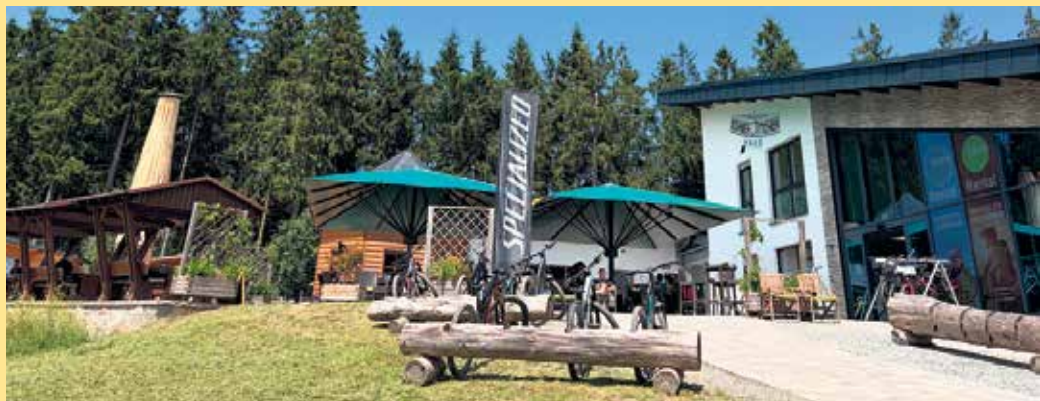
Die Terrasse des Schneewittchenhaus für Sonnenanbeter

Mitten im Skigebiet auf 734 m findet Ihr eine der schönsten Aussichtsterrassen von Winterberg. Seit fast 100 Jahren prägt hier die St.Georg Sprungschanze die Skyline von Winterberg als Wahrzeichen. Mit einer der "Spritz-Variationen" aus der Sommerdrink-Karte schweift der Blick vom Kahlen Asten bis weit über Winterberg hinaus. Für die kleinen Gäste ist eine eigene Spielwelt mit Kugelbahnen und großer Spiel-Pistenwalze vorhanden. In der Gastronomie im Fuße der Schanze warten frisch gebackener Kuchen, Waffeln mit verschiedenen Toppings sowie eine ansprechende Auswahl an Speisen. - Auch in vegetarischen Variatio-