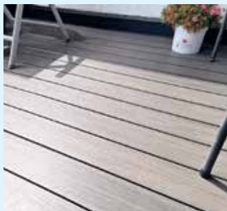
Terrassenboden von der Tischlerei Holztec

Auch zur Sommerzeit ist die Tischlerei Holztec aus Küstelberg der richtige Ansprechpartner in Sachen Terrassenböden, Sichtschutzelemente, Zaunelemente für den erholsamen