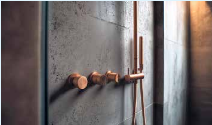
Wandgestaltung in der Dusche von STUCCO POMPEJI RESIA

Der Malerbetrieb Schnorbus berät Sie gerne mit vielfältigen Farbmustern für alle Räume- hier können alle Wohnräume umgesetzt werden. [BL]