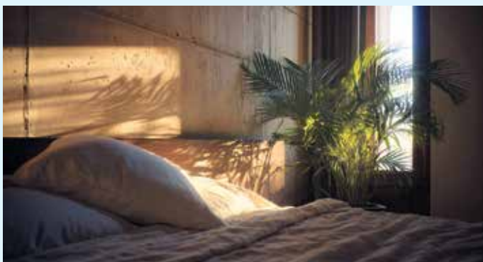
Wand im Schlafzimmer von STUCCO POMPEJI RESIA