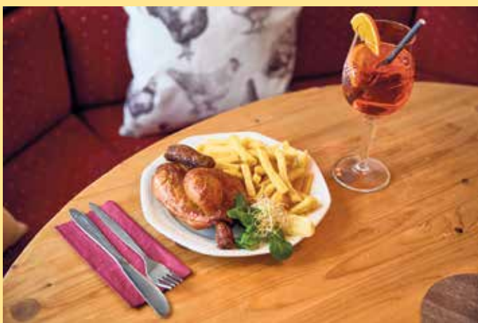
Speisen im Gockelstall im Skigebiet

lienfeiern, Firmenevents oder für besondere Anlässe. [BL]