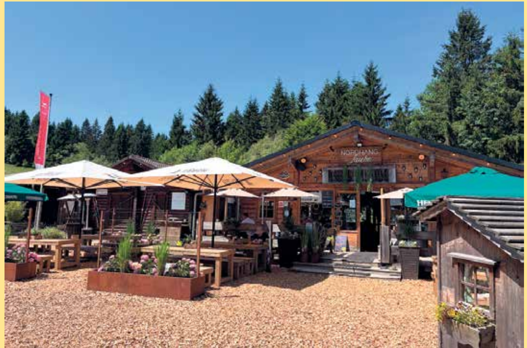
Gemütlichkeit an der Nordhang Jause

Mit der Nordhang Jause wurde ein Ort geschaffen, an dem man ankommt, durchatmet und gemeinsame Zeit genießt. Direkt am Nordhang des Kahlen Astens treffen echte Gastfreundschaft, warme Hüttenatmosphäre und die Liebe zur Natur aufeinander. Ob entspannte Stunden mit Familien-