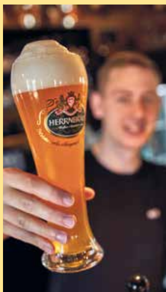
Na dann Prost!

und Freunden, eine gemütliche Pause nach der Wanderung oder besondere Augenblicke bei gutem Essen - hier geht es um das, was wirklich zählt: Gemeinsame Erlebnisse, die in Erinnerung bleiben. Die Nordhang Jause ist ein Ort zum Wohlfühlen.- Ein Lieblingsplatz mitten im Sauerland. [BL]