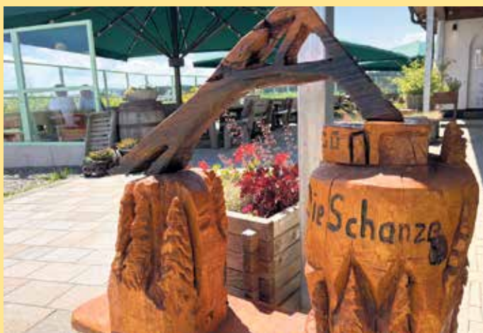
Schanze in Miniatur auf der Terrasse mit Weitblick

Die Schanze Herrlohweg 100 59955 Winterberg Tel.: +49 (0) 2981 425 9019 kontakt@die-schanze.de Schneewittchen-Haus Am Waltenberg 119 59955 Winterberg Tel.: +49 (0) 2981 425 9020 kontakt@schneewittchenhaus.de