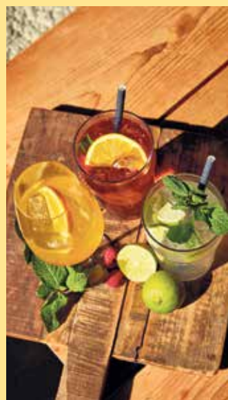
Sommer-Drinks an der Nordhang Jause