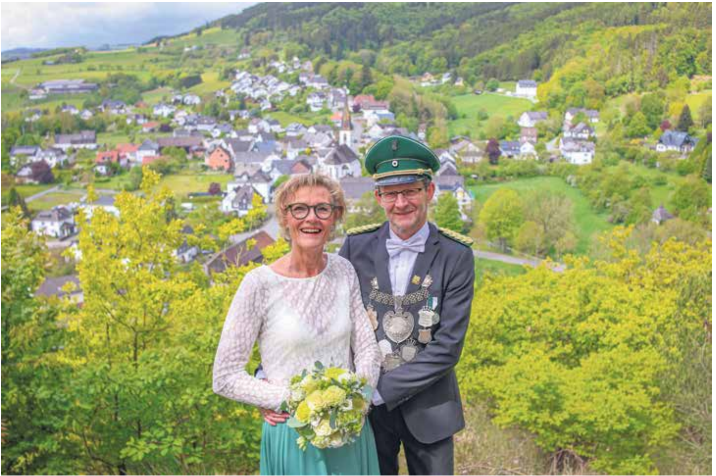
Königspaar Düdinghausen 2025-2026