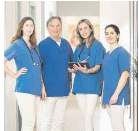
Das Team der dental suite im Kölner Rheinauhafen

Darüber hinaus kommt die Methode auch Angstpatienten sehr entgegen, da der gesamte Behandlungszeitraum (inklusive Vorbereitung und Nachbehandlung) sehr kurz gehalten werden kann.