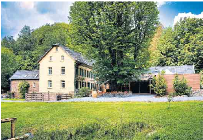
Die unter Denkmalschutz stehende Kupfersiefer Mühle bei Köln erhält eine neue Zukunft mit innovativen, kreislauffähigen Baumaterialien.