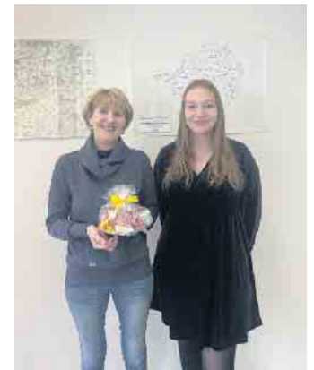
Eine glückliche Siegerin des Osterrätsels (Stadt + Handel 2024)