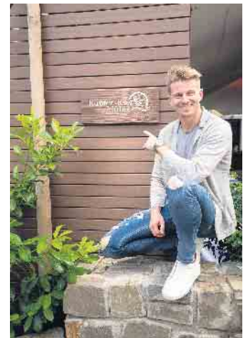
Formel-1-Rennfahrer Nico Hülkenberg hat sich auf den ersten Blick in die historische Mühle verliebt.