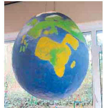
Die selbstgebastelte Weltkugel in der KiTa St. Martinus