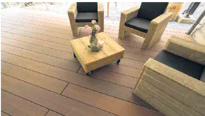
Die Terrasse der historischen Mühle hat mit dem Holzwerkstoff ein einladendes Ambiente erhalten.