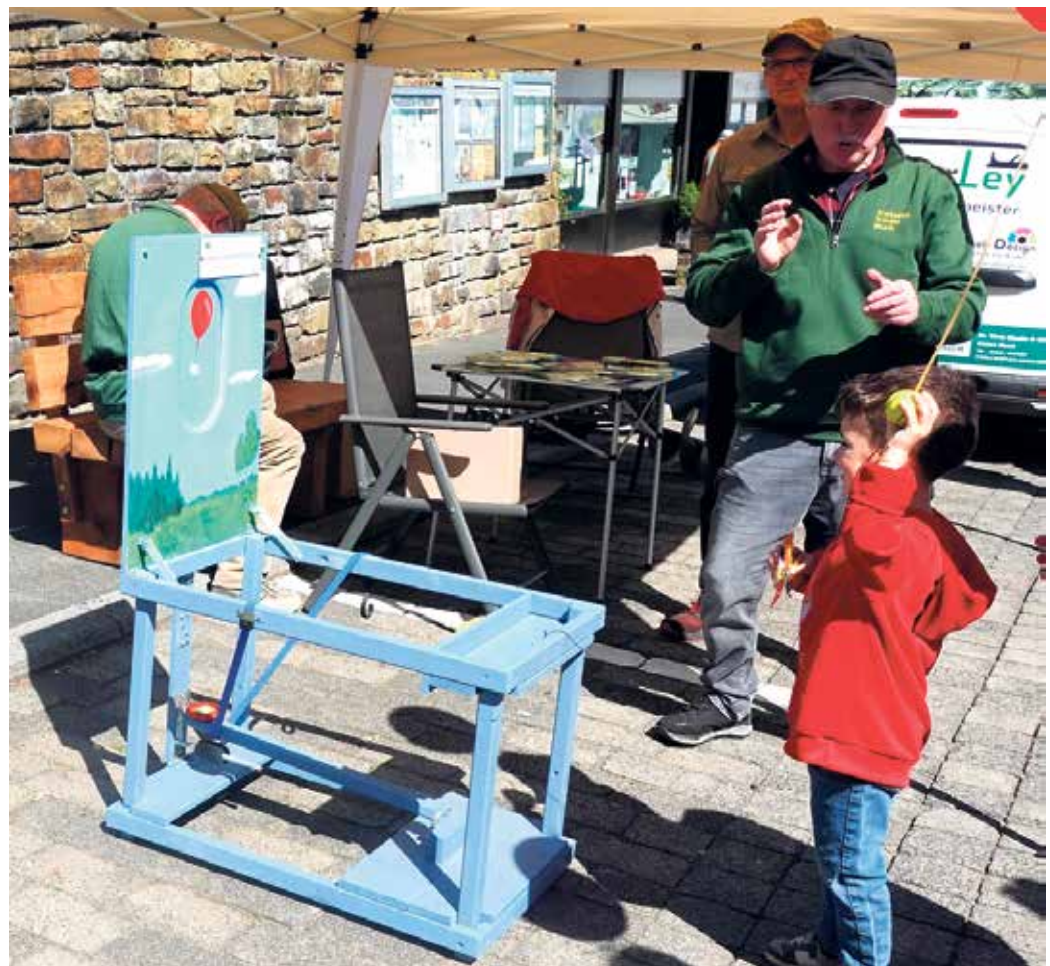
Selbst die ganz Kleinen wollten einen Treffer landen.