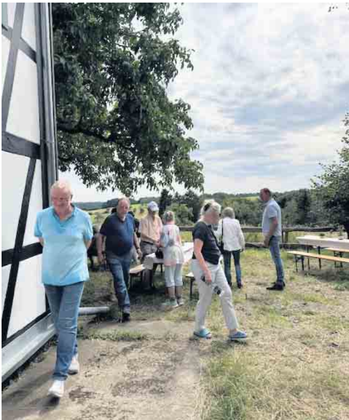
Viel Besuch beim „Tag der offenen Tür“

Nach diesem gelungenen Auftakt sind weitere Veranstaltungen geplant, so dass der Fischerhof ein Treffpunkt für Naturinteressierte ist. So macht sich die Bürgerinitiative zum Erhalt des Naafbachtals e.V. weiter als Naturschutzverein stark für den dauerhaften Schutz des Flora-Fauna Schutzgebietes, dem Naafbachtal.