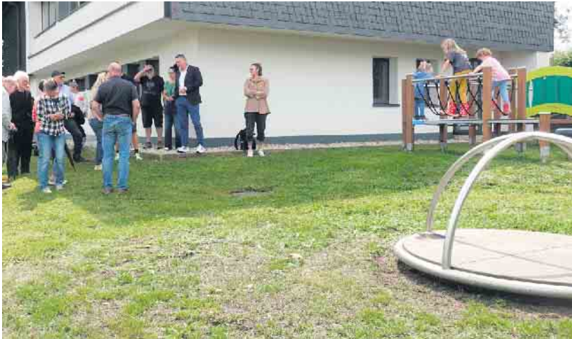
Der Spielplatz bereichert den Marienfelder Ortskern.