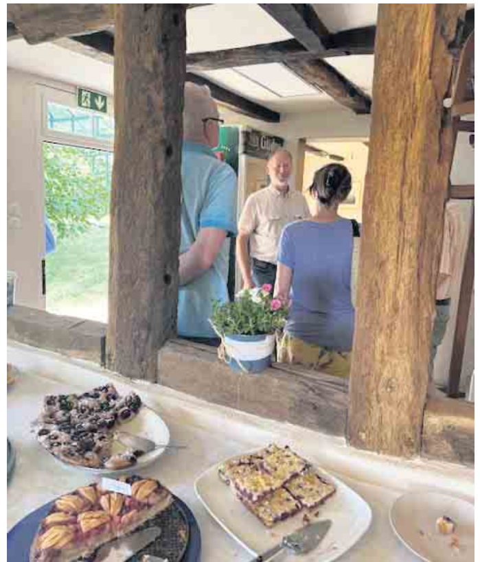
Im Fischerhof Eingangsbereich