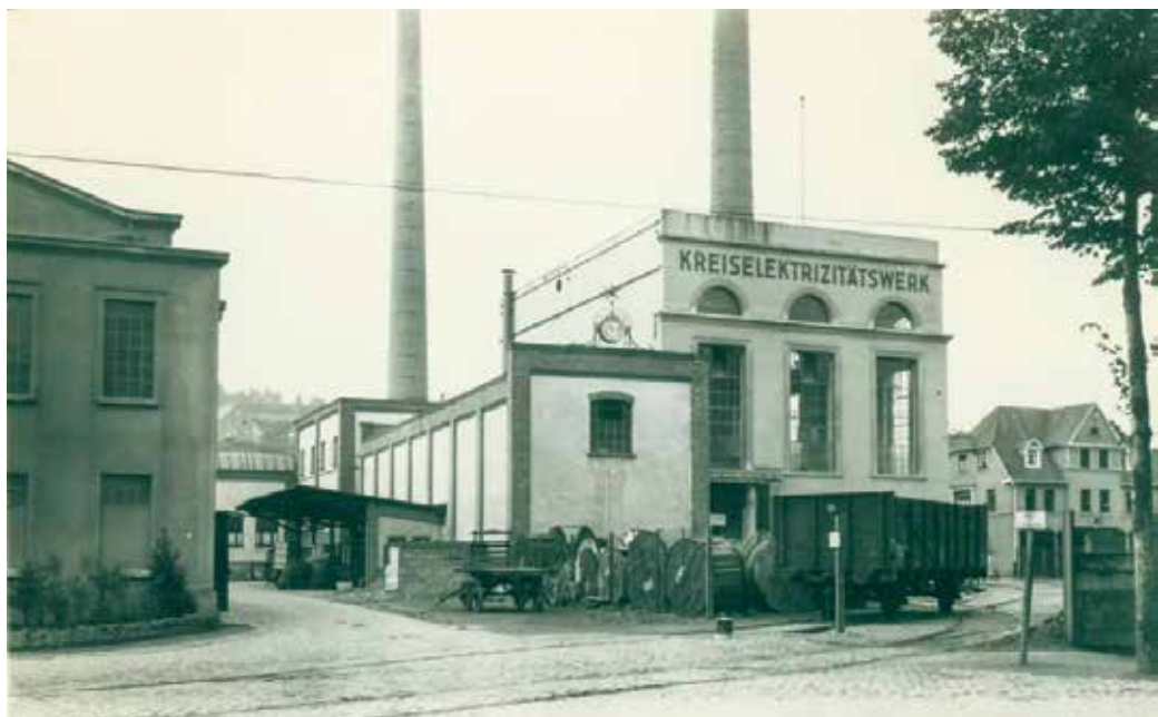
Kreiselektrizitätswerk Dieringhausen Mitte der 1920er-Jahre