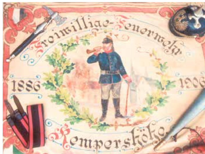
Alte Fahne der Feuerwehr Kempershöhe

Stiftungsfest rund um die Reithalle an Pfingsten