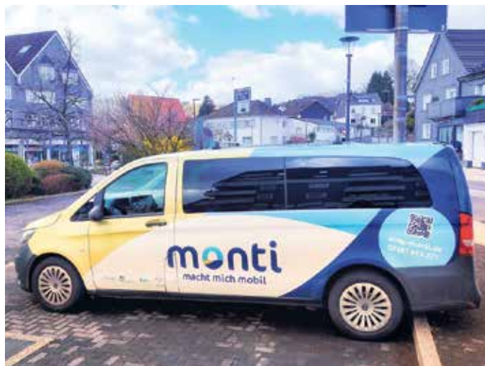
Das größere der beiden Fahrzeuge in Marienheide.

Auch in Nümbrecht und Wiehl gibt es eigene monti-Gebiete. Die Fahrt durch Reppinghausen, Eberg, Stühlinghausen, Rodt und Müllenbach