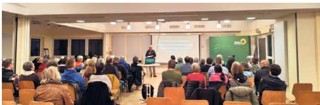
Gut besucht war der Filmabend der Grünen

Unser Filmabend im Rahmen der internationalen Wochen gegen Rassismus am 18.3.2026 im Kath. Pfarrheim war sehr gut besucht, rund 70 Menschen sahen den eindringlichen Dokumentarfilm über die Konsequenzen der zunehmend restriktiven europäischen und deutschen Migrations- und Asylpolitik. „ Sie hassen uns Migranten! “, so klang das aus dem Mund eines Überlebenden. Illegale, sogenannte Push-backs der europäischen Grenzschutzorganisation Frontex sind dokumentiert, werden aber nicht juristisch verfolgt. Übergriffe griechischer und syrischer Grenzschützer haben schon Tausende Menschenleben gekostet, die Prügelszenen am Grenzzaun der spanischen Exklave Ceuta sind schwer zu ertragen. Europa wird zur Festung, schutzsuchende Menschen werden kriminalisiert und mit