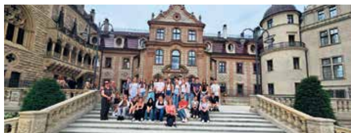
Die Gäste aus Marienheide vor Schloss Moszna.

Der Austausch wurde durch das Deutsch-Polnische Jugendwerk (DPJW) finanziell unterstützt, dessen Förderung die Durchführung des Programms maßgeblich ermöglichte.