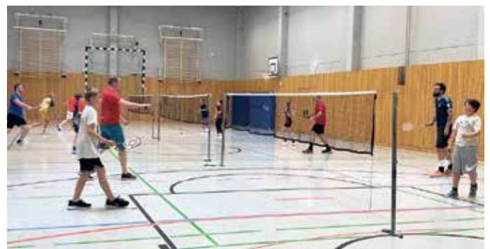
Übungsbetrieb in der Jahnhalle Anfang Juni 2026.