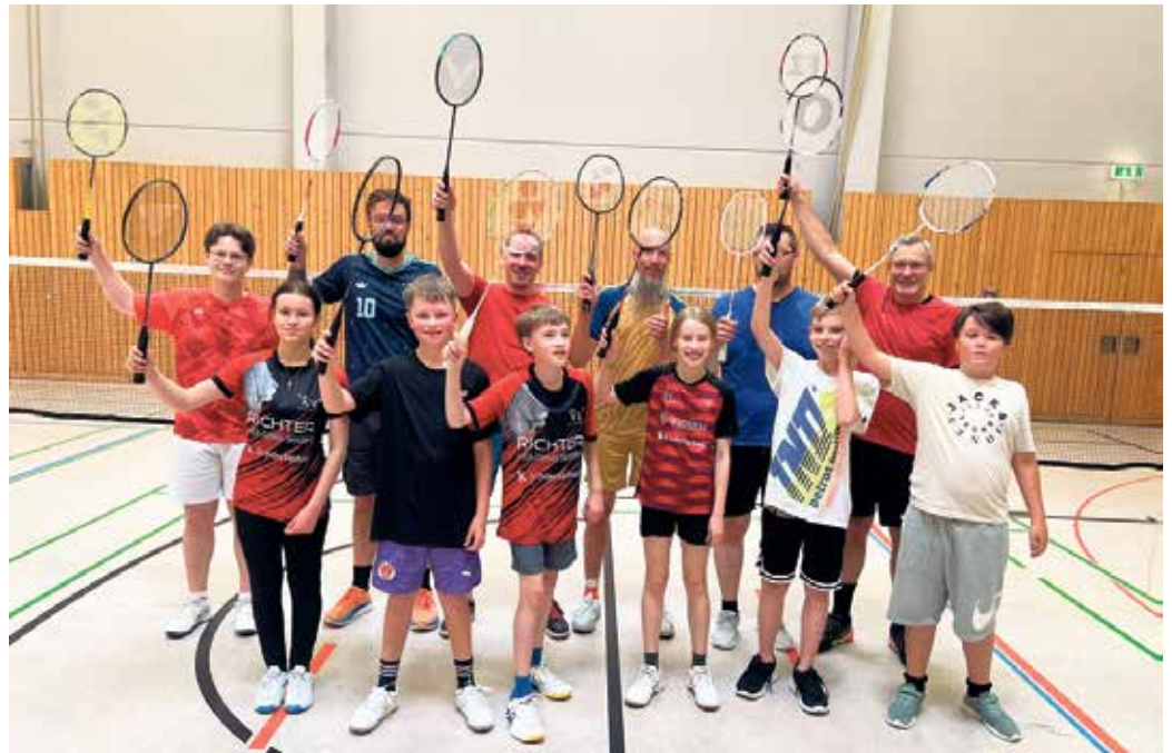
Die Trainingsgruppe in der Jahnhalle Anfang Juni 2026.

Nach dem Tief im Sommer 2024, verursacht durch den Austritt vieler Mitglieder, hat der 1. BCW-Marieneide durch kontinuierlichen Mitgliederzuwachs seit 2025 nun wieder eine stabile Mitgliederzahl erreicht. Regelmäßig trainieren mittlerweile dienstags von 18:30 bis 20:30 Uhr und samstags von 10 bis 12 Uhr in der Regel 10 bis 15 Mitglieder von jung bis alt in unterschiedlicher Zusammensetzung in der Zweifachhalle bzw. Jahnhalle in Marieneide. Natürlich sind Interessentinnen und Interessenten, die sich über die Sportart Badminton informieren wollen, bei den Trainingsterminen gerne gesehen und der 1. BCW-Marieneide würde sich über weitere Mitglieder freuen. Im Übungsbetrieb arbeitet der 1. BCW-Marieneide eng mit dem 1. BC Wipperfeld zusammen. Dies zeigt sich u.a. darin, dass einerseits einige Jugendspieler*innen aus Marieneide auch in Wipperf