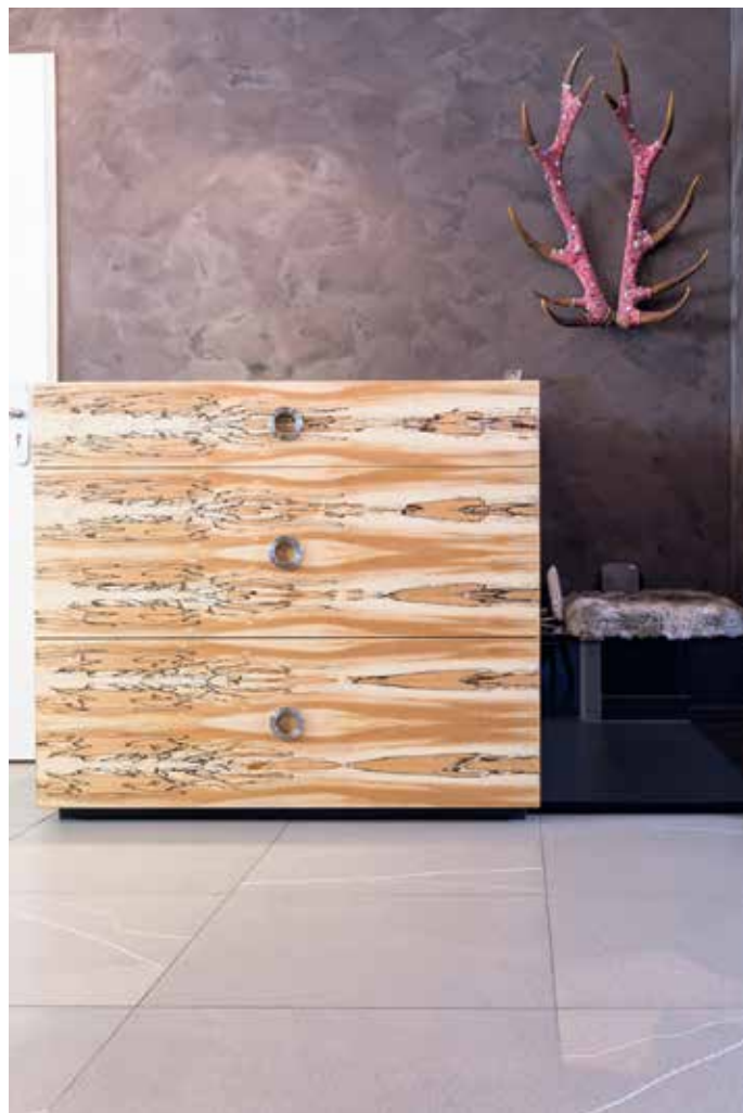
Ein Meisterwerk der Natur: Diese Kommode zeigt auf perfekte Weise, was alles mit Furnier möglich ist.