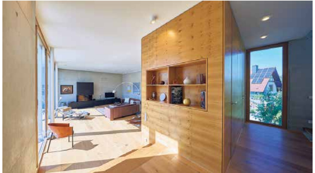
Hier entfaltet das Furnier der Asteiche seine außergewöhnliche Wirkung.