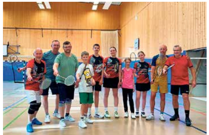
Die Trainingsgruppe in der Zweifachhalle Mitte Juni 2026

feld unter bc-wipperfeld.de. Beide Vereine freuen sich auf eine rege Teilnahme.