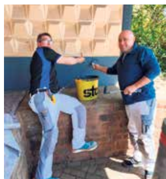
Kampf den lästigen Schmierereien: Bauhof-Mitarbeiter der Stadt überpinselten unter anderem die Graffitis an der gegenüberliegenden Bushaltestelle.