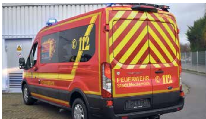
Der Ford Transit werde baugleich zu einem bereits im Dienst befindlichen Fahrzeug sein.

wichtige Fahrzeug wird zukünftig im Gebiet des Löschzuges 4 am Standort Weyer stationiert“, berichtet Nico Schmitz von der Löschgruppe Weyer. Der Ford Transit werde baugleich zu einem bereits im Dienst befindlichen Fahrzeug sein. Im Januar hatte der Stadtrat die Verwaltung mit der Be-