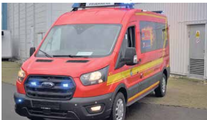
Künftig verstärkt ein neues Mannschaftstransportfahrzeug den Fuhrpark der Mechernicher Feuerwehr.