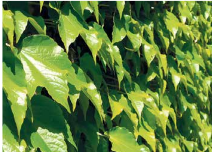
Die klassische Art der Fassadenbegrünung: Wilder Wein wächst an einer Hauswand.

Hitze im Sommer, steigende Anforderungen an Klimaschutz und Energieeffizienz sowie der Wunsch nach mehr Grün in dicht bebauten Städten machen die Fassadenbegrünung immer beliebter. Begrünte Gebäudehüllen können einen positiven Beitrag zur klimaresilienten Stadtentwicklung leisten. Der Verband Fenster + Fassade (VFF) informiert über Vor- und Nachteile dieser