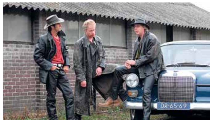
Eine kompromisslos echte „ZZ-Top-Bluesrock-Maschine“: TresHombrés aus den Niederlanden.