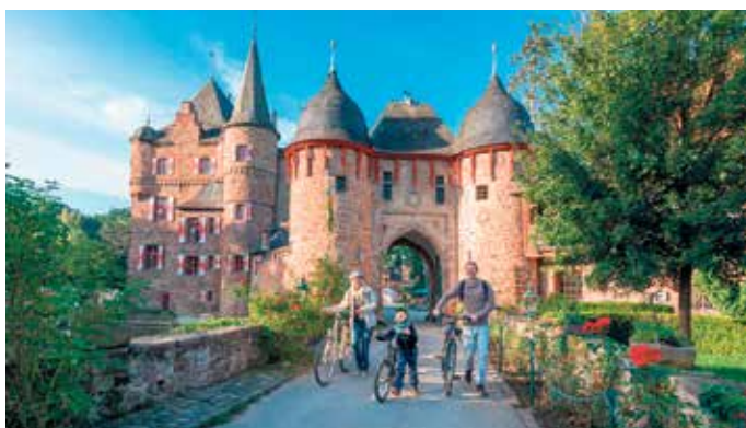
„Wo Ritter Feste feiern“, heißt die 24,5 Kilometer lange EifelRadSchleife Nr. 7 rund um Mechernich, die als „moderat“ eingestuft wird.