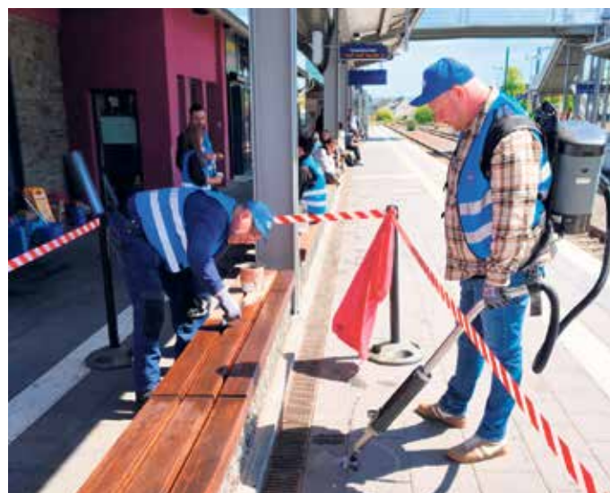
Achtung, frisch gestrichen! Diese Bänke hatten es bitter nötig, wie die DB-Mitarbeiter bestätigten. Die Pflastersteine auch.