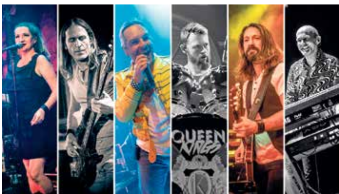
„Don't stop me now!“ ist hier Programm: „The Queen Kings“.