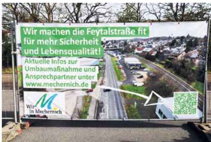
Hinweisschilder entlang der Baustelle verweisen mit QR-Code auf den aktuellen Stand der Bauarbeiten.

allein für die Rohre“, fasst Marcel Maniecki Bauleiter der Firma Backes, zusammen.