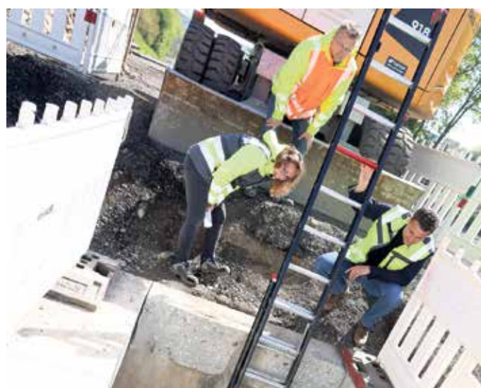
Rund fünf Meter geht es hinunter in den Kanalschacht, in dem gerade mit vollem Einsatz gearbeitet wird.

„Um die Verkehrsführung vorzubereiten haben wir unter anderem zehn neue Bushaltestellen an der Turmhofstraße und an der Heinrich-