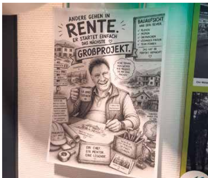
Liebevoll verziert hatten die Kollegen zum Abschied die Bürotür ihres in den Ruhestand gehenden Teamleiters.