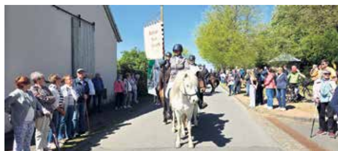
Die Prozession zum Georgspütz, einer heiligen Quelle, die seit dem Mittelalter, vielleicht auch schon länger, verehrt wird, wird seit 1953 von einer Standarte zu Pferde angeführt.