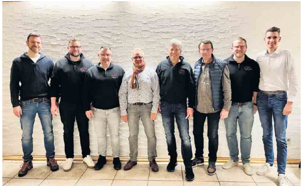
Vorstand MGV Seelscheid