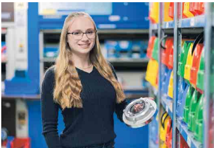
Kaufleute für Groß- und Außenhandelsmanagement sorgen für einen reibungslosen Warenfluss.

Wir suchen für die SSE Deutschland GmbH für unseren Standort der Hauptverwaltung in Troisdorf zum nächstmöglichen Zeitpunkt in Vollzeit (40 Stunden/Woche) einen: