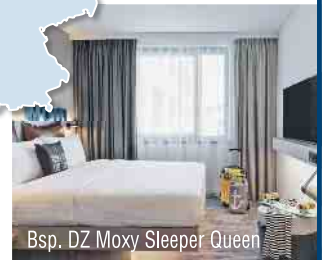
Bsp. DZ Moxy Sleeper Queen