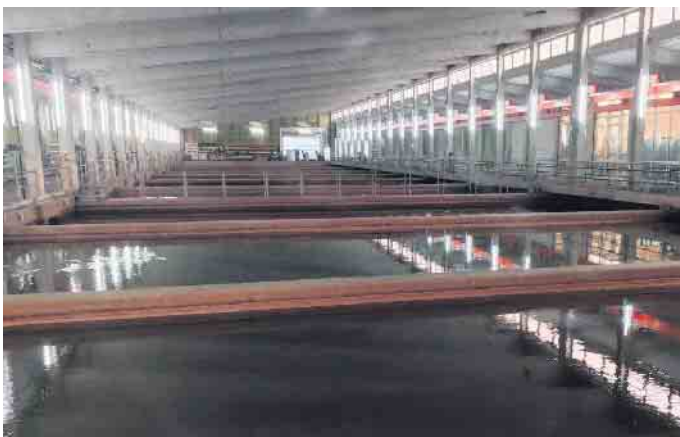
Blick in die Halle mit den zehn großen Filterbecken