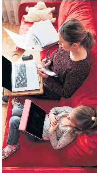
Mobiles Arbeiten kann bequem, aber gleichzeitig auch belastend sein.

Die Bedingungen sind in den meisten Unternehmen in sogenannten Zusatzvereinbarungen einvernehmlich zwischen Firma und Mitarbeitern festgeschrieben und verbindlich geregelt. Beispiel 1: Die Arbeit darf nur an bestimmten Wochentagen mobil erledigt wer-