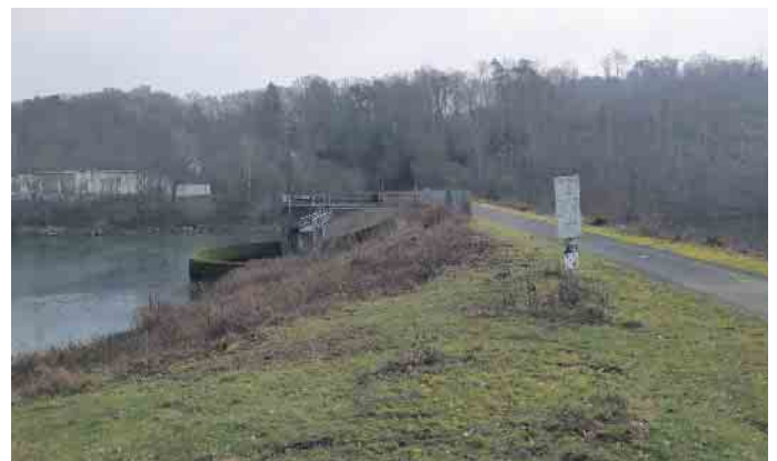
Rechts der Behälter am Vordamm, links das Vorbecken, im Hintergrund die PEA