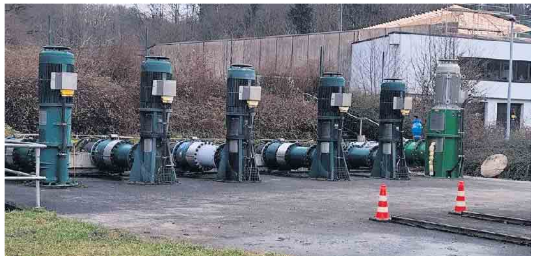
Die Pumpen, die das Wasser in die PEA holen