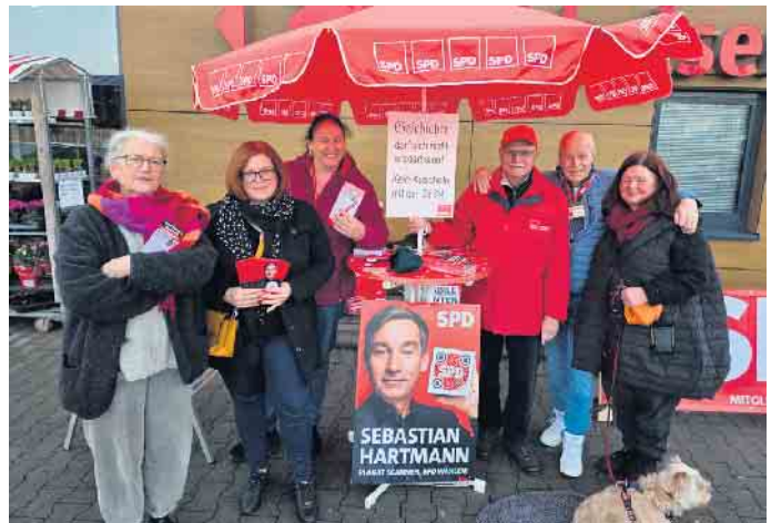
Mit vollem Elan dabei