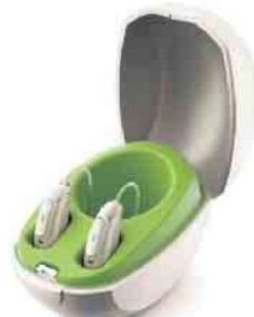
Phonak Audéo™ Paradise

Jetzt Termin vereinbaren und unverbindlich Probe tragen!