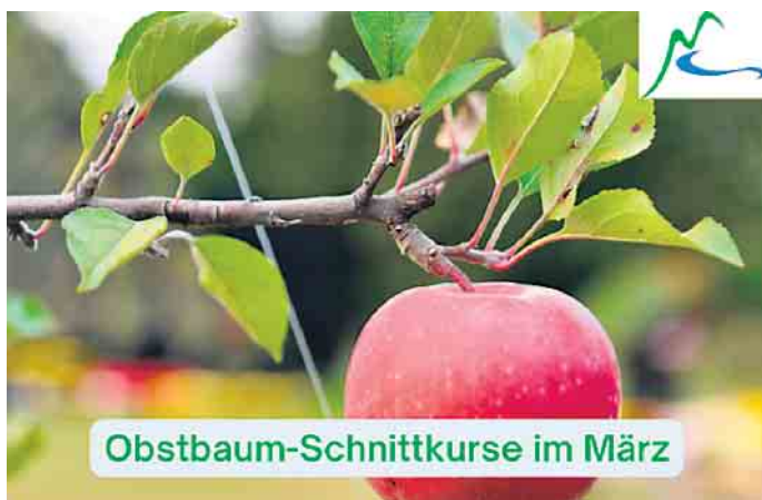
Obstbaum-Schnittkurse im März

Es wird eine Kursgebühr von 25,- Euro pro Teilnehmer erhoben.