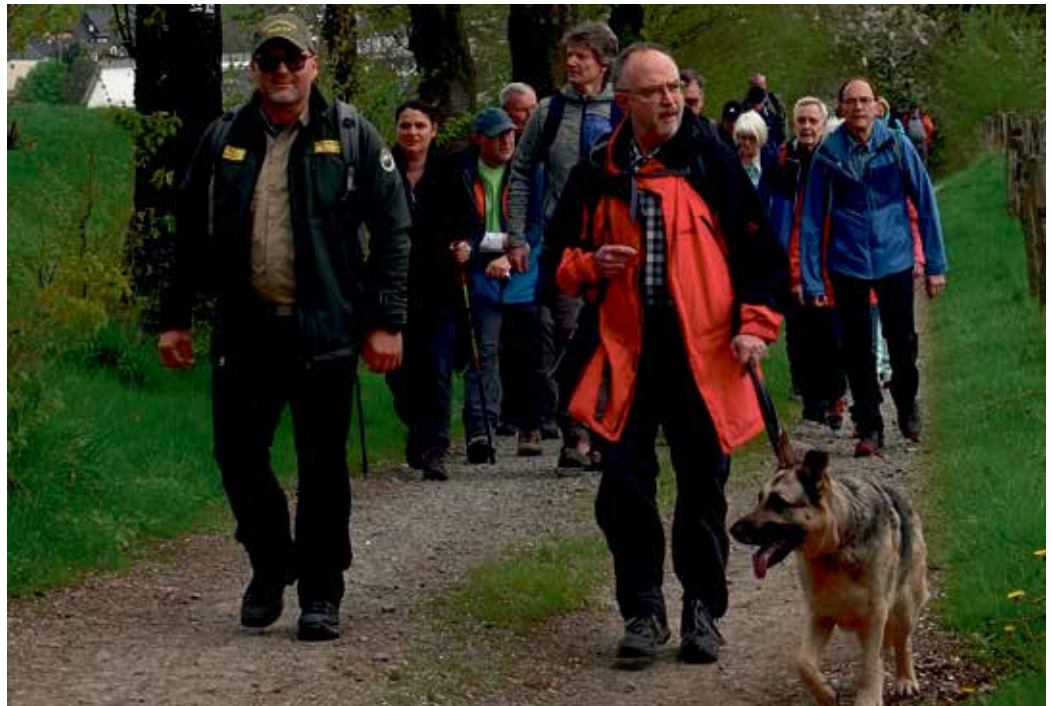
Unsere Wanderung ist beliebt!

An unserem Stand präsentieren wir u.a. unsere Süßigkeitenwurfmaschine und haben einen interessanten Sponsorentermin mit der Kreisspar-