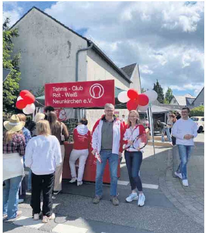
Der TC RW Neunkirchen auf dem Frühlingsfest

Einfach mal ausprobieren, jeder ist herzlich willkommen!