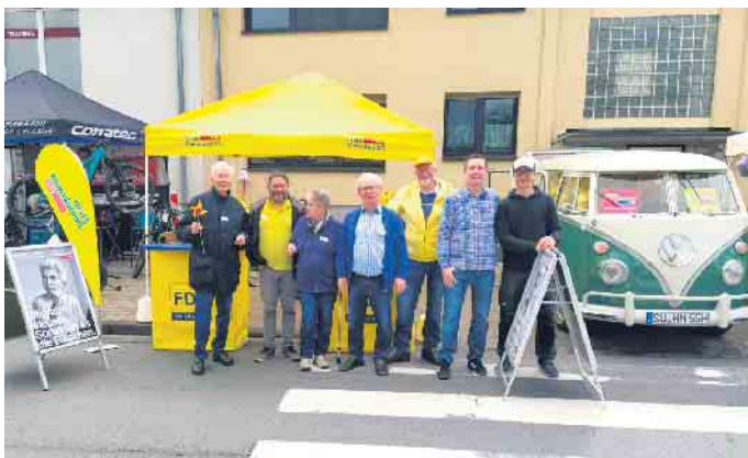
Die Frühschicht der Freien Demokraten hat den Infostand aufgebaut.

Liebe Mitbürgerinnen und Mitbürger, das Frühlingsfest am vergangenen Sonntag war ein voller Erfolg, es kamen so viele Gäste wie nie zuvor. Kurz vor 11 Uhr war der Infostand aufgebaut und die Freien Demokraten am Ort freuten sich auf viele gute Gespräche. Thema dieser Gespräche war natürlich die Wahl zum Europa-