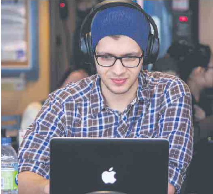
Bei der Lehrstellensuche spielt das Internet eine große Rolle.

Schon während der Schulzeit beschäftigen sich Burschen und Mädels mit der Frage, welcher beruflichen Tätigkeit sie später nachgehen wollen. Doch die Suche nach einer passenden Lehrstelle kann sich für die jungen Menschen manchmal als schwierig erweisen. Anlaufstellen mit Informations- und Beratungsangeboten für Jugendliche sind in dieser Phase von hoher Bedeutung. Der Lehrstellenmarkt ist riesig und genauso vielfältig sind die Möglichkeiten, die Schülerinnen und Schüler für die Suche nach einer passenden Lehrstelle nutzen können.