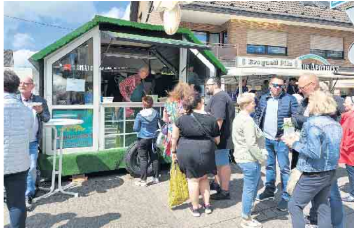
MGV Verkaufsstand beim Frühlingsfest