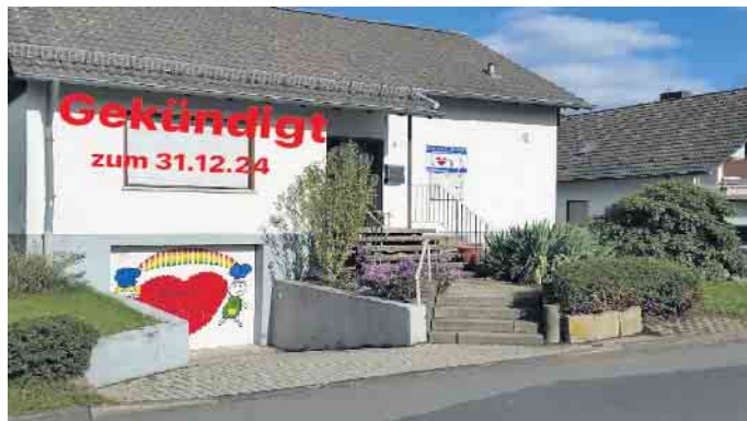
Die Stöberstube in Neunkirchen

geeigneten Objekt. Sie möchten jedoch darauf hinweisen, dass die neuen Räumlichkeiten Platz zum Sortieren, Lagern und Stöbern bieten sollten. Gesucht wird ein Ladenlokal/eine Wohnung von mindestens 70 qm, wenn möglich mit einer Garage oder einem trockenen Kellerraum für die Lagerung der Verkaufsgegenstände. Der Kinderschutzbund würde sich sehr freuen, wenn die Räumlichkeiten in der Ortsmitte von Neunkirchen lägen und Parkplätze in der Nähe zur Verfügung stünden. Da der Verein nur beschränkte finanzielle Mittel zur Verfügung hat und es auf dem freien Markt ausgesprochen schwierig ist, ein geeignetes Mietobjekt zu finden, wird auf die Mithilfe der Bürger und Bürgerinnen gehofft. Wenn Sie oder Ihr Umfeld also von geeigneten Räumen wissen oder etwas erfahren oder Sie sich