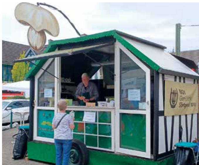
Der Verkauf kann beginnen.