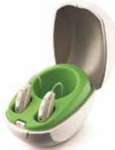
Phonak Audéo™ Paradise

Jetzt Termin vereinbaren und unverbindlich Probe tragen!