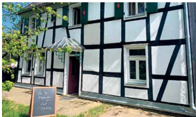
Fischerhof in Aiselsfeld

Mit vielen neuen Eindrücken ging es anschließend weiter zum Gasthaus „Auf dem Berge“ in Höffen.