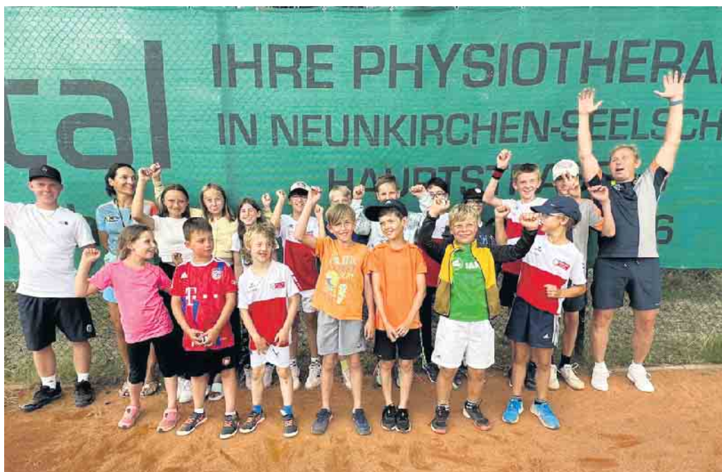
Tenniscamp TC RW Neunkirchen

Das große Highlight der Woche stellte sicher das am Donners-