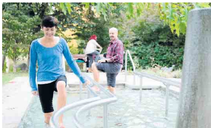
Wassertreten macht fit