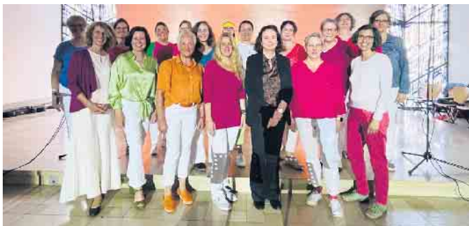
Herzliche Einladung zum Sommerkonzert des Frauenchors AnKlang am Antoniuskolleg

Einladung zum Sommerkonzert des Frauenchors AnKlang am Antoniuskolleg