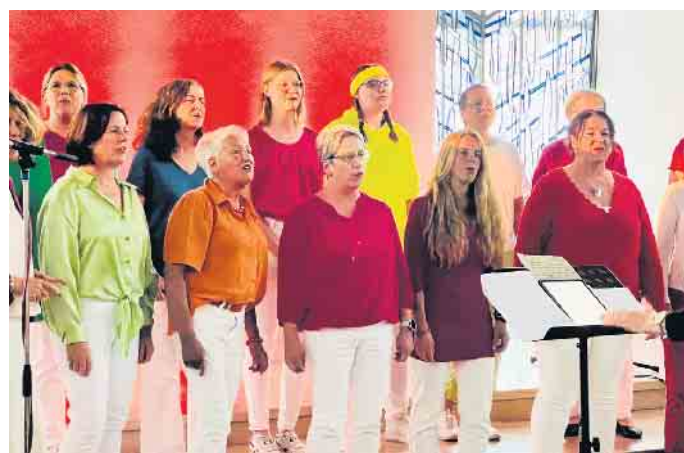
Nachsommerklänge - Lieder von und mit starken Frauen

musikalisch dem Thema „Starke Frauen“ widmet. Die Besucher*innen dürfen sich auf ausdrucksstarke und berührende Chormusik aus den Bereichen „Pop“ und „Musical“ freuen. Der Eintritt ist frei. Wir freuen uns auf Ihren und euren Besuch. Brita Recker