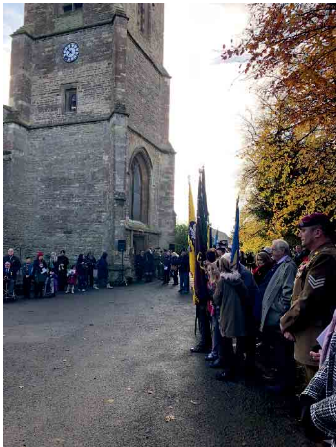
Gedenkfeierlichkeit vor der Kirche St. Edburg's

Aktivitäten abstimmt. Der Remembrance Day ist immer der 11. November. Dieser Gedenktag wurde im britischen Empire nach dem 1. Weltkrieg eingeführt und erinnert an den unterzeichneten Waffenstillstand in Frankreich. Die Kriegshandlungen sollten am „Elften Tag des elften Monats um elf Uhr“ enden. Im United Kingdom wird das