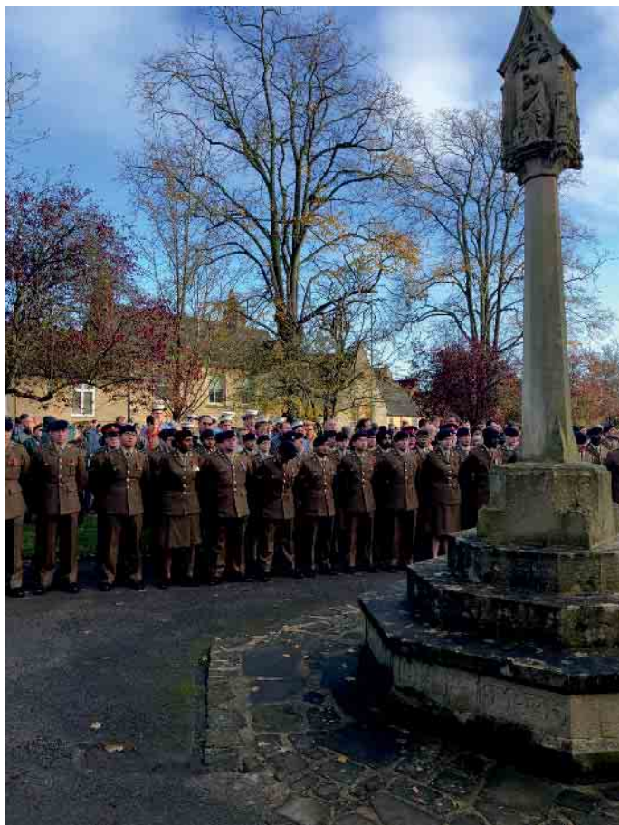
Soldatenformation am Ehrenmal, dem Cenotaph

Partnerschaftsverein Neunkirchen-Seelscheid e.V.