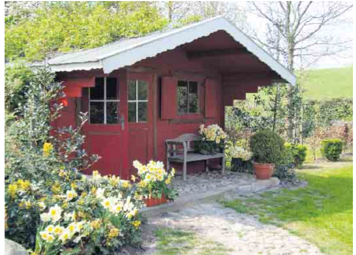
Wir genießen die stärkere Sonneneinstrahlung im Frühling und freuen uns an Austrieb und Blüte der Pflanzen.

Doch auch wenn keine großen Veränderungen geplant sind, ist es ratsam, sich zu Beginn des neuen Gartenjahres für einen Gartenrundgang mit dem Landschaftsgärtner oder der Landschaftsgärtnerin des Vertrauens zu verabreden. Armin Knauer: „Es gibt eine Reihe von typischen Frühjahrsaufgaben, die wir jetzt bei unserer Kundschaft durchführen. Hier oder da zeigt sich nach dem Winter eine Lücke im Beet, die mit neuen Pflanzen gefüllt werden will. An anderer Stelle ist ein Großstrauch zu beschneiden, damit er vital bleibt und sich in schöner Form entwickelt.“ Mehr noch, die Wege wollen auf Sicherheit überprüft und gereinigt, die technischen Anlagen zur Gartenbeleuchtung und -bewässerung kontrolliert und auch der Gartenteich auf Vordermann gebracht werden. Der Rasen bekommt die erste Düngung, im April wird vertikutiert, um das Moos herauszuziehen, und auch die Rosen wünschen sich Aufmerksamkeit. „Viele unserer Kundinnen und Kunden kennen inzwischen die Regel: Wenn die Forsythien blühen, werden die Rosen geschnitten“, berichtet Armin Knauer und ergänzt: