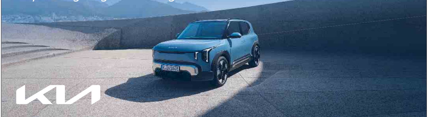
Abbildung zeigt kostenpflichtige Sonderausstattung.

Erleben Sie ihn live am 18.04. beim Kia EV Day in Siegburg oder Königswinter.