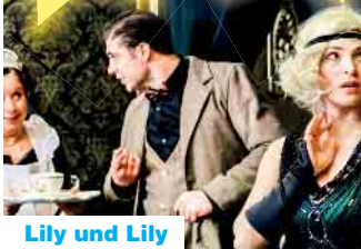
Lily und Lily

Komödie mit Franziska Traub u. a. Sa., 12. September 2026, 20 Uhr