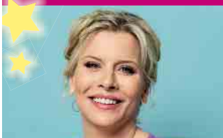
Von wegen Stille Nacht ...