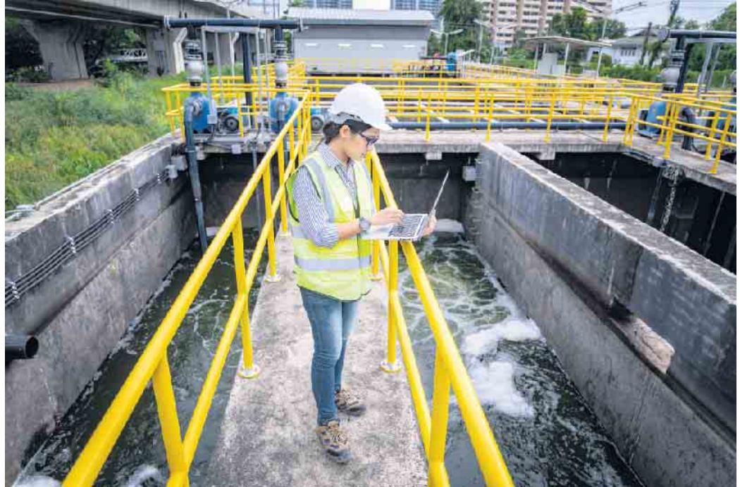
Fachkräfte sichern die Wasser- und Abwasserversorgung als kritische Infrastruktur, schützen die Umwelt und damit unsere Lebensqualität.

Das Berufsspektrum ist breit. Ausbildungsberufe sind etwa Vermessungstechnikerin, Umwelttechnologe für Abwasserbewirtschaftung oder Wasserversorgung sowie An-