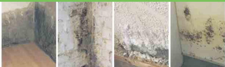
Defekte Horizontalsperre Querdurchfeuchtung Ausblühungen Schimmelbefall