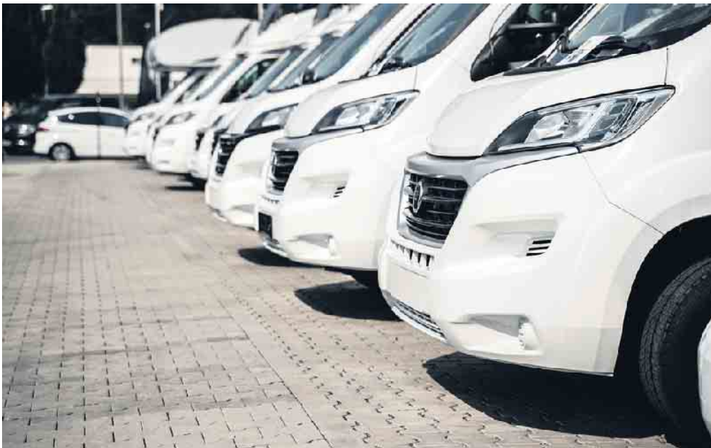
Wohnwagen sind aktuell sehr beliebt.