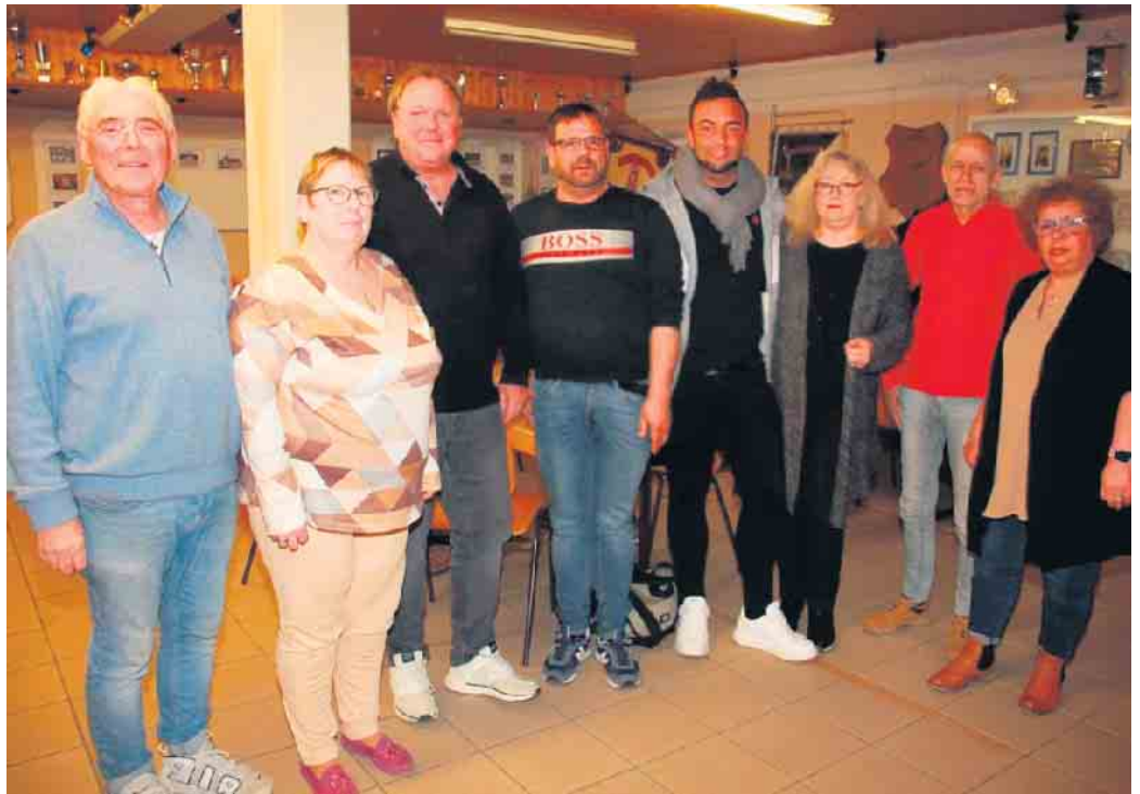
Der Gesamtvorstand des Tambourcorps „Blau-Weiß“ Nörvenich 1928 e.V.