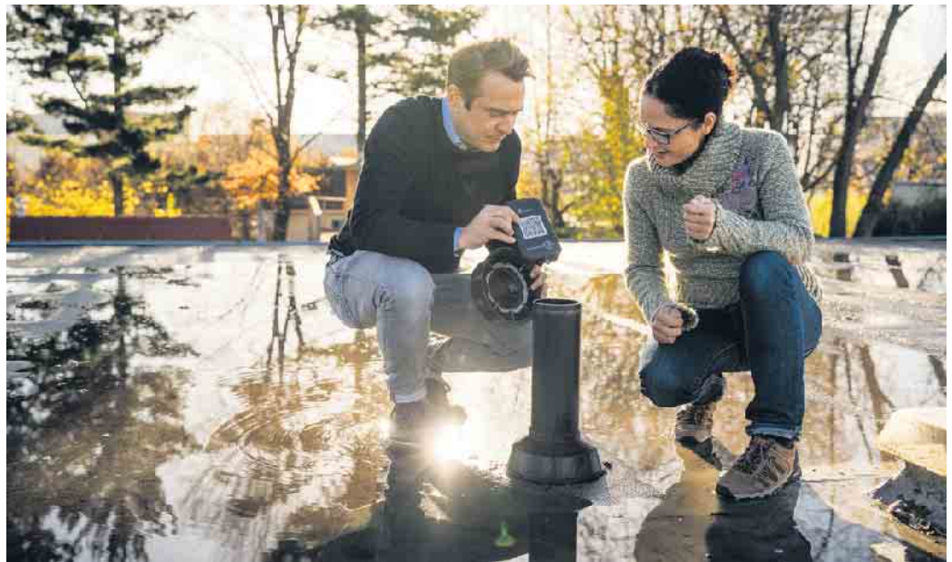
Intelligente Dachlösungen: Von Dachdeckern für Dachdecker entwickelt.

Die Integration von Drohnen und 3D-Technologie hat die Inspektion und Planung von Dachprojekten ebenfalls weiter nach vorne gebracht: Drohnen machen präzise Luftaufnahmen, um den Zustand von Dächern zu bewerten und erste Kostenschätzungen zu erstellen. 3D-Modellierungen ermöglichen es, komplexe Dachstrukturen digital zu entwerfen und zu visualisieren, bevor die eigentliche Arbeit beginnt. Auch Roboter finden mehr und mehr Einsatzgebiete im Dachdeckerhandwerk, zum Beispiel als Exoskelette: Das sind tragbare Strukturen, die den Körper bei schweren Tätigkeiten unterstützen, wie zum Beispiel bei Hebe- und Tragetätigkeiten oder bei Arbeiten über Kopfhöhe. Dadurch werden die Mitarbeitenden ent-