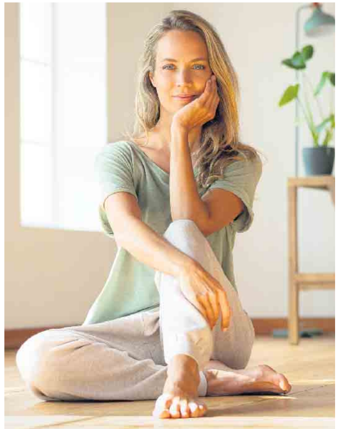
Auch wenn viel zu tun ist: Pausen gehören dazu und sollten fest eingeplant werden. Nutzen kann man sie etwa für Entspannungsübungen.

Mit Autogenem Training, progressiver Muskelentspannung nach Jacobson oder Atemübungen lässt sich Entspannung aktiv erreichen - mehr dazu und weitere Tipps zur inneren Ruhe gibt es unter www.bioelectra-magnesium.de/entspannung . Ganz einfach ist beispielsweise die 4-7-8-Atmung: Vier Sekunden lang durch die Nase einatmen, sieben Sekunden die Luft anhalten und schließlich acht Sekunden geräuschvoll durch den Mund ausatmen. Viermal wiederholen. (DJD)