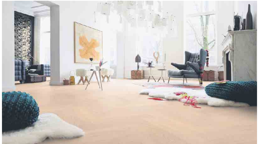
Parkett im Fischgrätmuster gibt weitläufigen Räumen Struktur.