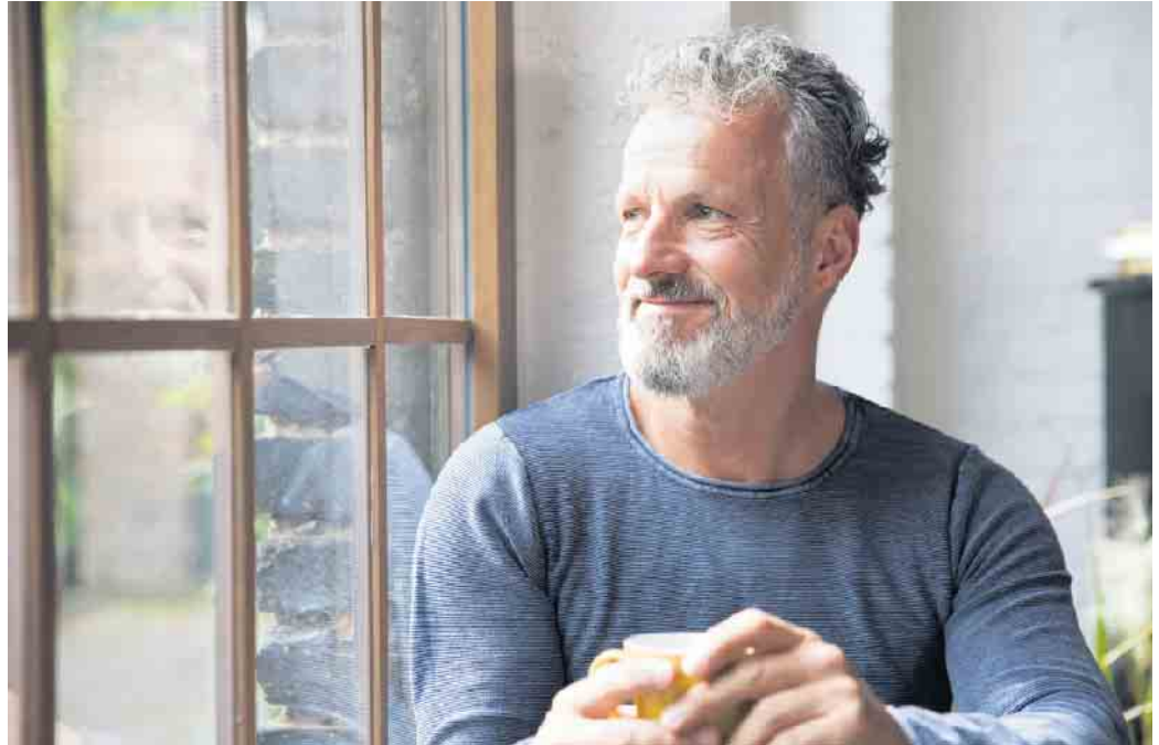
Kleine Rituale wie die morgendliche Tasse Tee am Küchenfenster sorgen für Momente der Entschleunigung.

Wer Aufgaben nach Plan erledigt und auch Pausen vorab festlegt, gerät nicht so leicht ins Rotieren. Kleine Rituale wie zehn Minuten Teepause am Morgen, ein