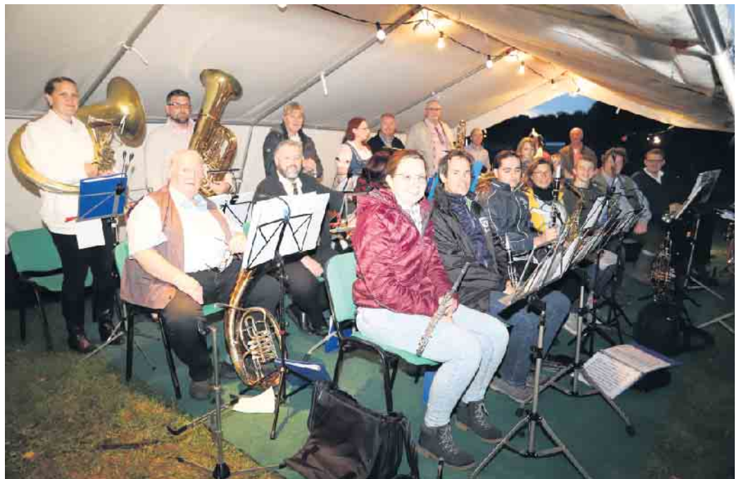
Zünftige Blasmusik gab es vom Musikverein aus Hochkirchen

Zünftige Blasmusik gab es vom Musikverein aus Hochkirchen. So hieß es auch in Nörvenich traditionell: O'zapft is! FH