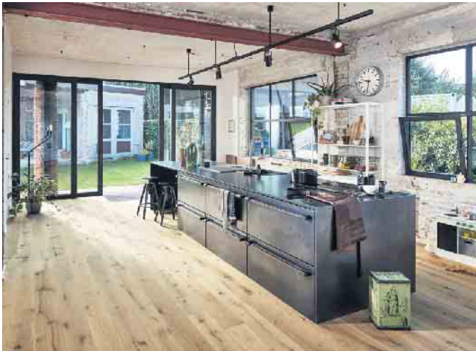
Beim Industrial Style geht alles um die Materialien. Lebhaft sortiertes Parkett mit hohem Astanteil unterstreicht die Authentizität des Holzbodens.

Eiche. Ebenfalls mit dem Landhausstil harmonisieren goldbraune Hölzer - zum Industrial Design hingegen passen dunklere Sorten mit lebhafteren Maserungen. Hier steht das Material der Einrichtung im Vordergrund: Der unbehandelte Look der Eiche mit Ast-Einschlüssen unterstreicht diesen minimalistisch-authentischen Wohnstil.