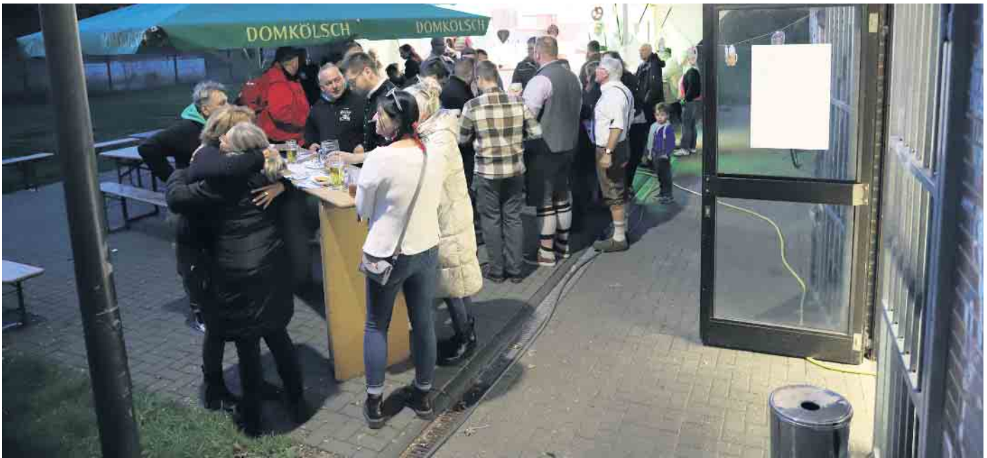
Das Oktoberfest Nörvenich bot den Besuchern im großen Open-Air Biergarten vor dem Vereinsheim zudem feinste Wiesn-Atmosphäre direkt im Herzen der Gemeinde am Neffelbach

„Heim“ mit liebevoller und detailreicher Dekoration in ein Wiesn-Zelt - mit Spießbraten im Brötchen und frischen Brezeln.