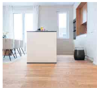
Eng abgemessene Räume profitieren optisch von parallel verlegtem Parkett.

„Die Langlebigkeit des Parketts ist nicht nur ein Qualitätsmerkmal, sondern auch ein Beitrag zum Klimaschutz“, so Schmid. „Denn einmal verlegt, speichert Parkett den im Holz gebundenen Kohlenstoff über Jahrzehnte und gar Jahrhunderte.“ Verband der Deutschen Parkettindustrie e.V.