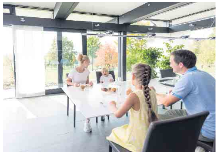
Wohnen mit Durchblick: Glas ist aus der modernen Architektur nicht wegzudenken - auch als Gestaltungsmittel im Innenausbau.

Ein klares Statement setzen Hausbesitzer mit dem Werkstoff auch im modernen Wellnessbad. Hochwertige Ganzglasduschen zum Beispiel verbinden Ästhetik mit hoher Funktionalität sowie hygienischen Vorteilen. Sie lassen sich einfach reinigen und behalten dauerhaft ihr attraktives Erscheinungsbild. In der Küche wiederum kann Glas als bedruckte Rückwand oder als leicht zu reinigende Arbeitsplatte dienen. Und nicht in jedem Fall muss das Material komplett durchsichtig sein: Lackierungen, Sandstrahlungen und Ornamente ermöglichen Designs ganz nach eigenem Geschmack. Glasschiebetüren, Glasrückwände und Raumteiler lassen sich zum Beispiel auch mit einem persönlichen Fotomotiv bedrucken. (DJD)