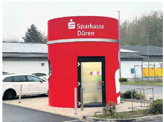
Moderne Geldautomatenaufstellung in einem im Volksmund „Dose“ getauften Gebäude