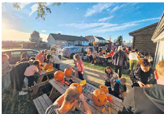
Bei bestem Wetter schnitzten rund 150 Eltern und Kinder über 50 Kürbisse, um für Halloween gerüstet zu sein.

Der Kreativität war an diesem Tag keine Grenzen gesetzt.