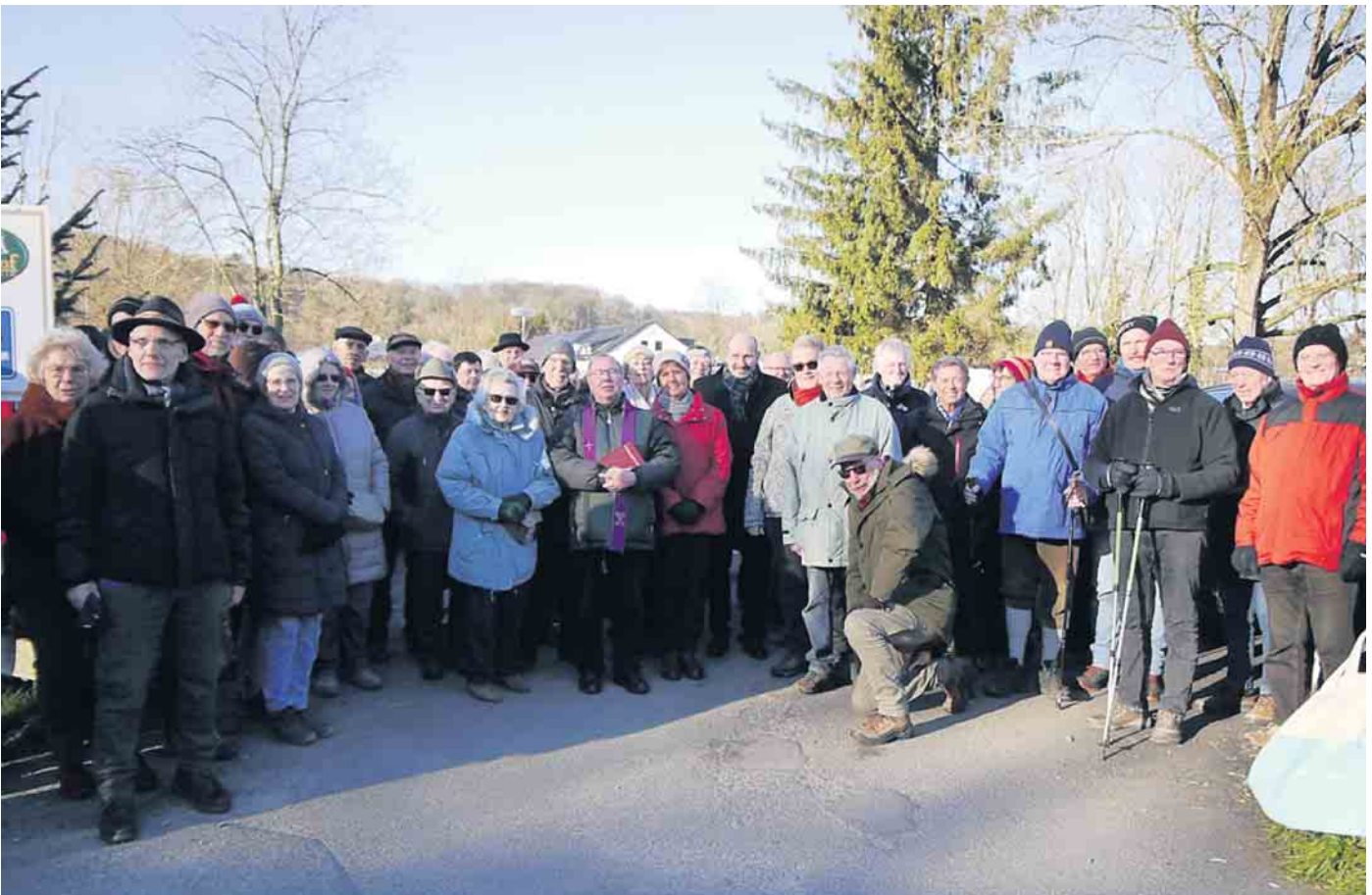
Die beiden Ehrengäste und die beiden Wanderführer des Tages vor der Wanderschar

Zur ersten Wanderung des Jahres 2024 traf sich die Wandergruppe im Auftrag der Stadt Overath am Aueler Hof in Wahlscheid. Dort an der Agger waren 97 bewegungsfreudige Damen und Herren angetreten, um mit 5 oder 10 Kilometern nach der vierwöchigen Weihnachtspause die idyllische Bergische Landschaft zu erkunden. Vor dem Start wurde das Wanderjahr 2024 traditionell mit Segenswünschen eröffnet. Unser Bürgermeister Christoph Nicodemus begrüßte die Wandergruppe, die in diesem Jahr seit 53 Jahren besteht, und wünschte